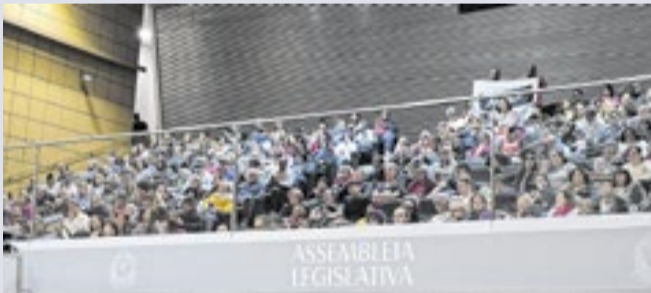
Professores são contra Projeto de Lei nº 1316/2025