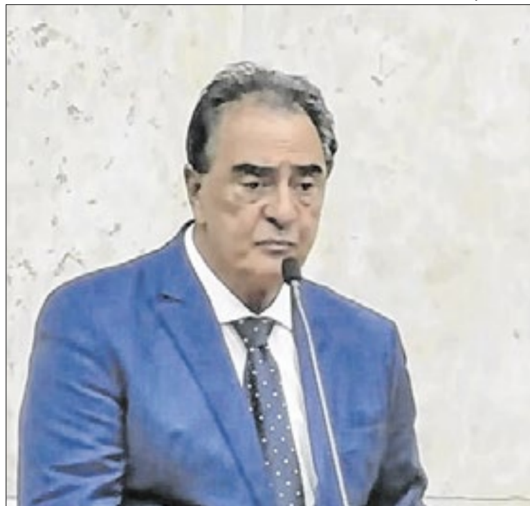
Vereador tem trajetória marcada por sucessivos mandatos na Câmara de SP

A feira integra a programação da festa julina da região do centro da cidade e busca incentivar a economia criativa, ampliar a geração de renda para os expositores e aproximar o público do artesanato local. A entrada é gratuita, e a programação segue durante o evento, com atividades culturais, gastronomia e, também, atrações típicas.