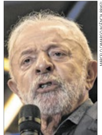
André Mendonça deu prazo para Lula explicar regras

afirmou que o pedido de liminar apresentado pela confederação ficou prejudicado, uma vez que ele já havia concedido, em outro processo sobre o mesmo tema, uma medida cautelar suspendendo, por 90 dias, a utilização das regras como fundamento para autuações, multas, notificações punitivas e outras medidas coercitivas relacionadas aos fatores de risco psicossocial.