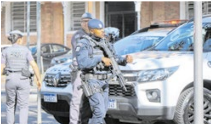
Guarda Municipal durante operação no Centro de Campinas