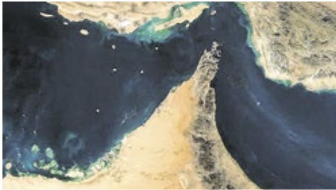
Estreito de Hormuz segue no centro da polêmica