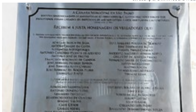
A placa está instalada ao lado dos elevadores da Casa