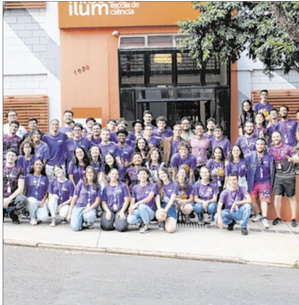
A faculdade pública e gratuita Ilum Escola de Ciência ligada ao CNPEM, em Campinas, está com inscrições abertas para o Ilum de Portas Abertas

“O Ilum de Portas Abertas é um evento de extensão que apresenta para a comunidade as atividades realizadas pelos alunos da Ilum durante sua graduação. Dentro dessas atividades, o IPA 2026 promoverá experiências nas mais diversas áreas da ciência, permitindo que os visitantes conheçam de perto projetos desenvolvidos por estudantes, participem de atividades interativas e explorem temas