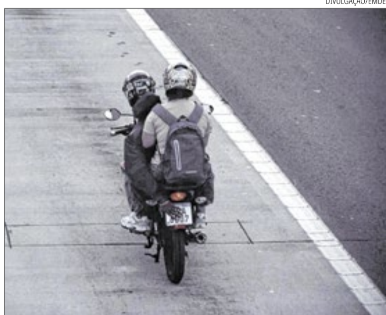
Número equivale a uma média de 32,7 mil flagrantes da irregularidade no mês

Apesar da gravidade, houve redução de 39% no total de flagrantes em relação ao mesmo período de 2025. Entre janeiro e junho do ano passado, foram 323,7 mil imagens de “mão na placa”,