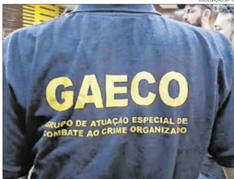
Gaeco, do Ministério Público de São Paulo, em operação de março de 2026

Os investigadores também analisam contratos firmados pela administração municipal e movimentações financeiras ligadas aos suspeitos. O material apreendido será submetido à perícia e poderá subsidiar novas fases da in-