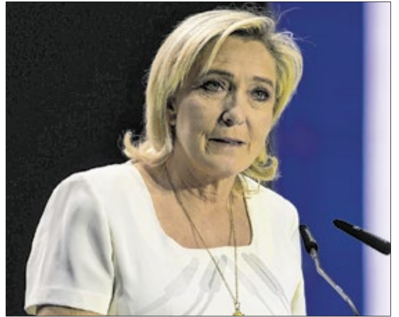
Parlamentar diz que será candidata e, se eleita, indicará Bardella como premiê