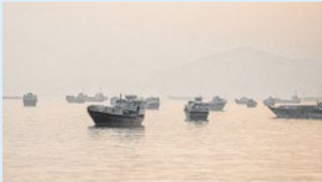
Ataques aumentaram a tensão no Oriente Médio