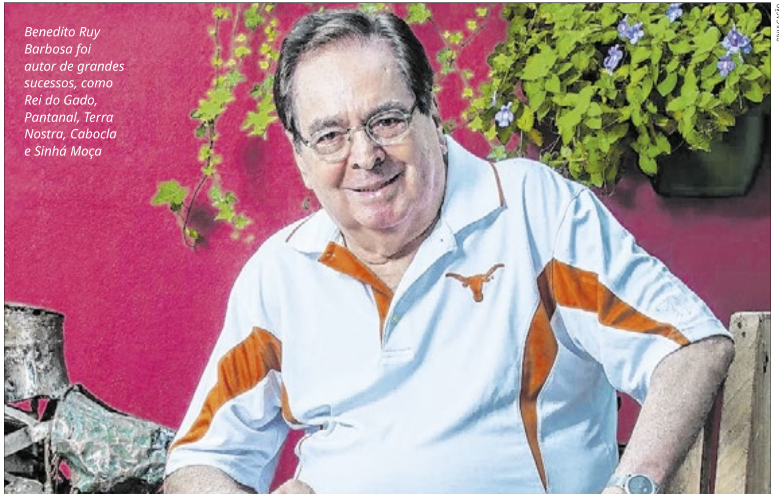
Benedito Ruy Barbosa foi autor de grandes sucessos, como Rei do Gado , Pantanal , Terra Nostra , Cabocla e Sinhá Moça

Nos últimos anos, Benedito Ruy Barbosa enfrentava