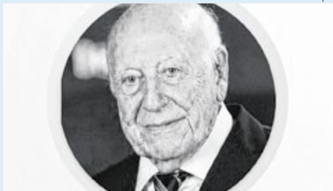
Médico e ex-vice-governador do Acre Labib Murad