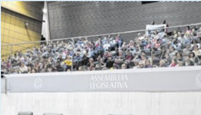
Professores são contra Projeto de Lei nº 1316/2025