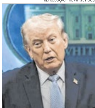
Trump não deve desistir da sobretaxação

As novas tarifas norte-americanas são resultado de uma