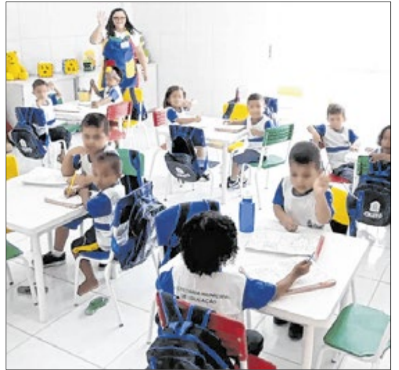
Educação infantil avança no Nordeste e mantém desafio nacional

A Universidade Federal do Ceará concluiu as plenárias deliberativas da Estatuante, processo voltado à revisão do estatuto e do regimento da instituição. O documento-base será encaminhado ao Consuni, responsável por analisar e deliberar sobre as propostas apresentadas pela comunidade universitária antes da definição do texto final.