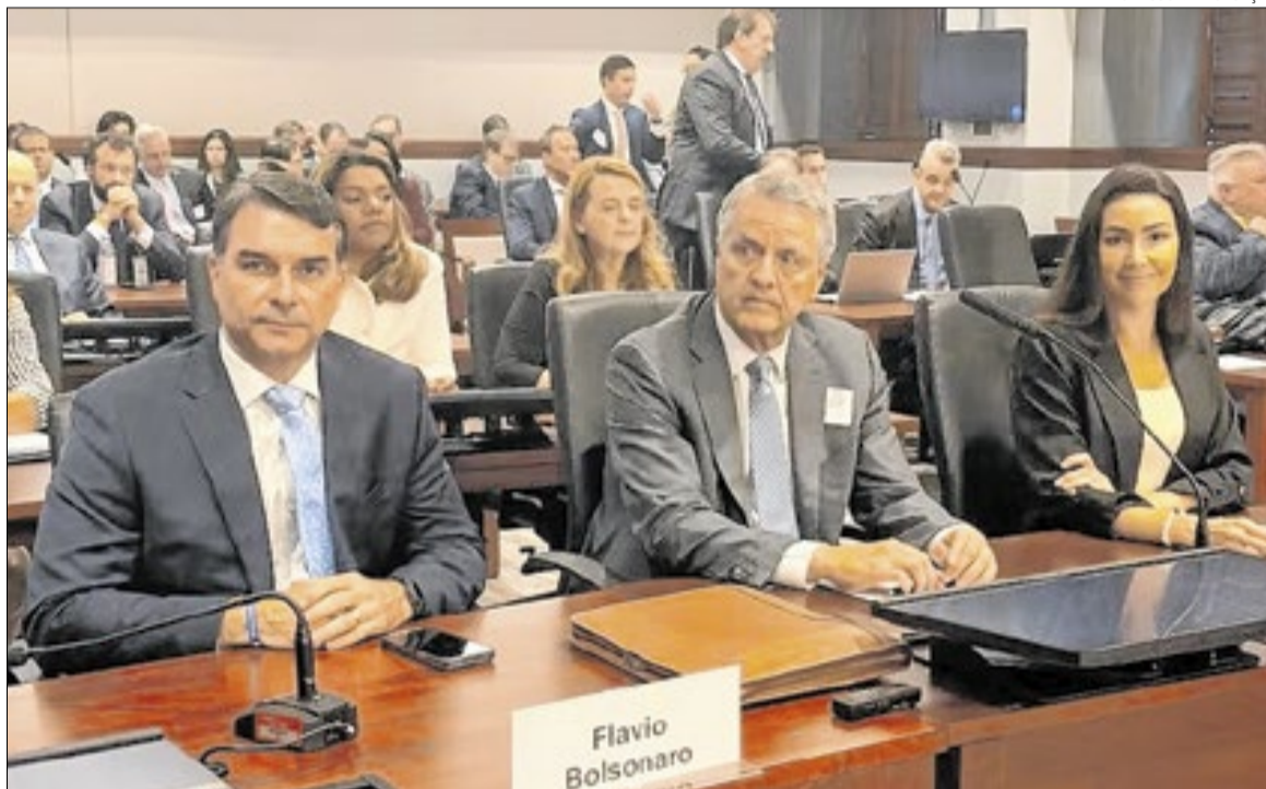
Flávio falou por cinco minutos na audiência da USTR e reforçou inconveniência política do tarifaço

Como reação, na noite desta terça-feira, a Secretaria de Comunicação Social da Presidência da República (Secom) divulgou para a imprensa uma nota