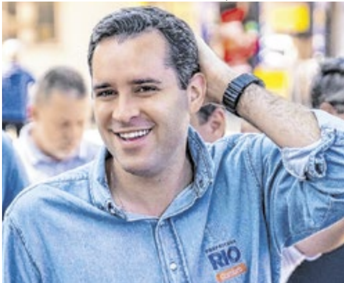
Prefeito do Rio, Eduardo Cavaliere