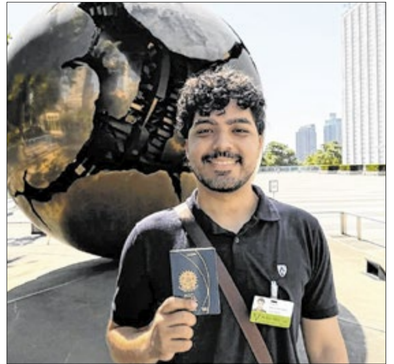
Ainda não há previsão para o início do curso de formação de diplomatas, em Brasília (DF)

A Assembleia Legislativa de Rondônia homologou o resultado definitivo do II Concurso Público de Provas e Títulos da Casa, realizado em 2025, encerrando oficialmente o certame e dando início ao prazo de validade para futuras convocações dos candidatos aprovados. A homologação foi publicada no Diário Oficial eletrônico da ALE-RO.