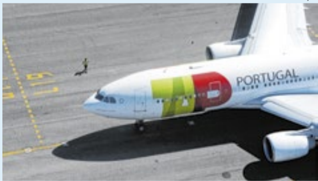
Três frequências semanais entre Curitiba e Lisboa