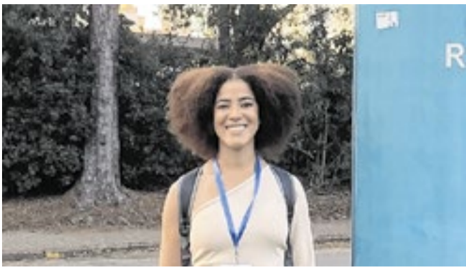
O evento tem como objetivo reunir pessoas pesquisadoras