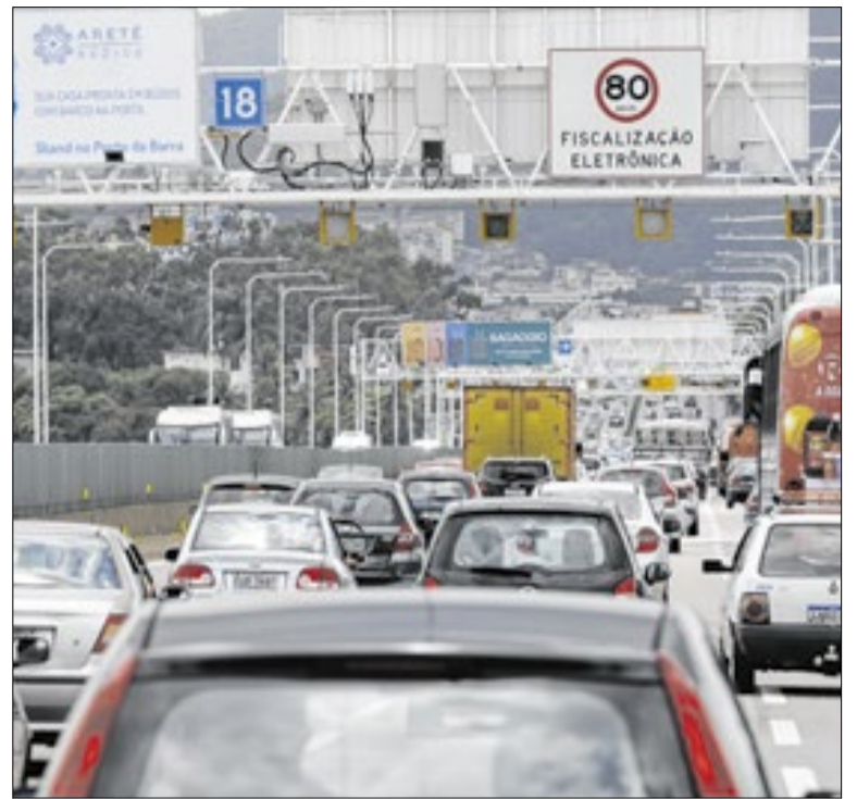
Segundo a Anfavea, o principal crescimento foi no segmento de automóveis

Caso a projeção se confirme, o crescimento será de 11,7% em relação a 2025, bem acima dos 2,7% previstos. O avanço será impulsionado principalmente pelos segmentos de automóveis e comerciais leves, cuja expectativa de crescimento passou para 12,6%. Já os segmentos de caminhões e ônibus devem encerrar o ano com retração de 6%.