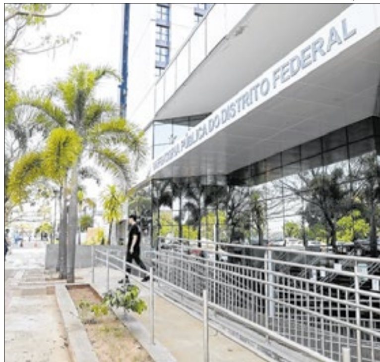
Técnico de tênis precisa retornar ao país para realizar um transplante pulmonar

Moradores de Campo Grande (MS) podem consultar e enviar sugestões sobre o Estudo de Impacto de Vizinhança de um complexo residencial com 464 unidades no Bairro Tiradentes. As contribuições serão recebidas entre 17 deste mês e 6 de agosto. Os documentos estão disponíveis para consulta no site da Planurb e na biblioteca municipal.