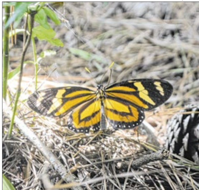
Diversidade de cores foi tema de pesquisa sobre a recuperação da biodiversidade

O projeto-piloto de combate ao borrachudo, iniciado em 2019 com produtores rurais do Distrito de Sede Alvorada, apresentou resultados positivos e foi ampliado para todas as comunidades rurais de Cascavel (PR). A prefeitura, por meio da Secretaria Municipal de Meio Ambiente, realizou a licitação para aquisição do biolarvicida BTI.