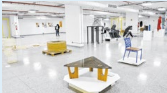
Museus e centros culturais oferecem atividades aos jovens