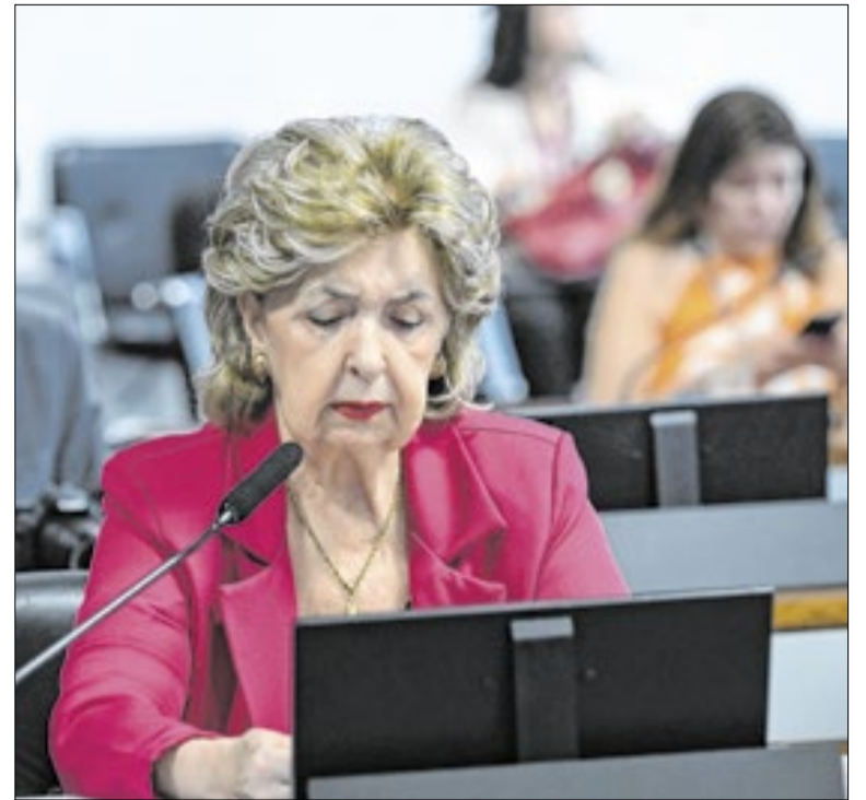
Ivete: projeto fortalece o sistema de prevenção à lavagem de dinheiro

Flávio tem razão também quando diz que o tarifaço acelera a busca de mercados alternativos aos EUA. Isso, de fato, aconteceu e acontecerá. Como mostrou o Correio Político em agosto do ano passado, um mapeamento feito na época pela ApexBrasil identificou 72 mercados potenciais que poderiam substituir o mercado americano.