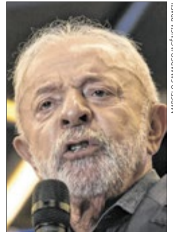
André Mendonça deu prazo para Lula explicar regras

afirmou que o pedido de liminar apresentado pela confederação ficou prejudicado, uma vez que ele já havia concedido, em outro processo sobre o mesmo tema, uma medida cautelar suspendendo, por 90 dias, a utilização das regras como fundamento para autuações, multas, notificações punitivas e outras medidas coercitivas relacionadas aos fatores de risco psicossocial.