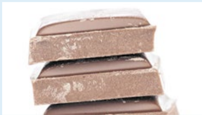
País produziu 814 mil toneladas no ano passado