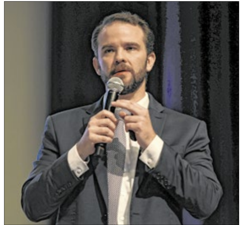
Mesmo sem acordo, Durigan disse que governo fará MP

Já que o assunto é aviação, o Galeão recebeu, na madrugada desta terça-feira (7) para quarta-feira (8), o voo Azul 9429, direto de Nova Iorque, trazendo a delegação brasileira da Confederação Brasileira de Futebol. O voo foi operado com um moderno A330-900, com poucos meses de uso, que pousou às 3 da manhã. Ele estava previsto para decolar às 14 horas de Nova Iorque, mas atrasou duas horas pelo excesso de bagagem dos passageiros.