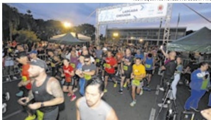
KIUVALQUIR KIU AURELIANO/SECOM-PMC

Inscrições gratuitas para evento no sábado e no domingo