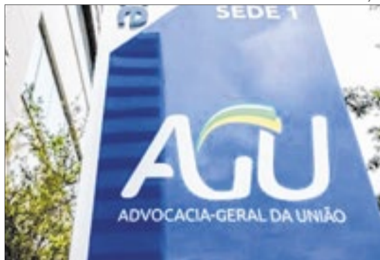
Determinação da AGU resultou na retirada de 100 mil reportagens da EBC do ar

■ No PT, há quem avalie que Jorge Messias, atual chefe da AGU, deveria ter entrado em campo para evitar que essas medidas fossem implementadas. Petistas lembram que ele chegou a ser escolhido por Lula para o STF e, após