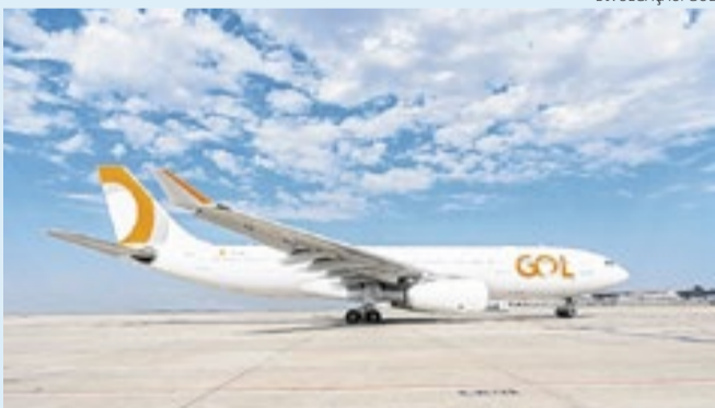
Aeronave Airbus A330 que fará a rota Rio-Nova Iorque