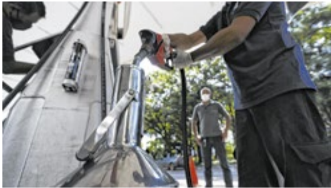
Ministro reitera que país está negociando tarifaço