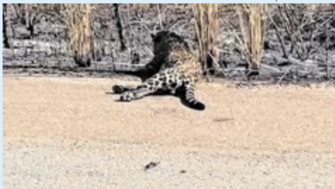
Animal ficou gravemente ferido e tentou voltar para a mata

Uma onça foi atropelada em uma estrada na zona rural de Balsas, no sul do Maranhão. O caso aconteceu nas proximidades do povoado Batavo. Segundo informações divulgadas, o animal teria saído da mata tentando fugir de uma queimada registrada no dia anterior. Ao tentar atravessar a pista, a onça acabou sendo atingida por um carro de passeio. Equipes da Guarda Ambiental, do Corpo de Bombeiros e da Secretaria de Meio Ambiente foram acionadas para tentar resgatar o animal.