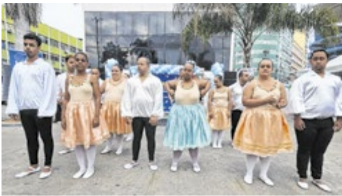
Evento teve programação voltada às pessoas com deficiência