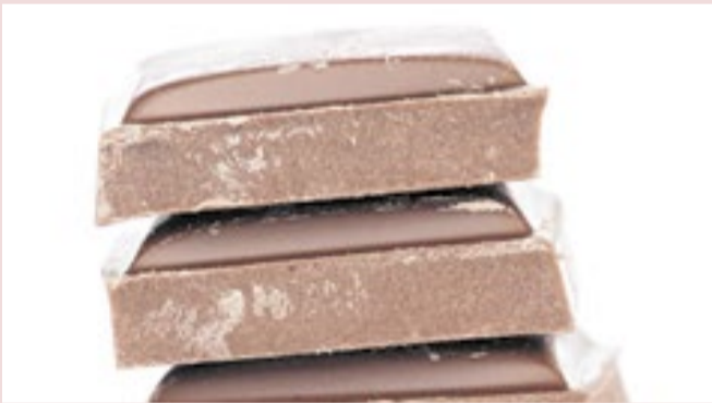
País produziu 814 mil toneladas no ano passado