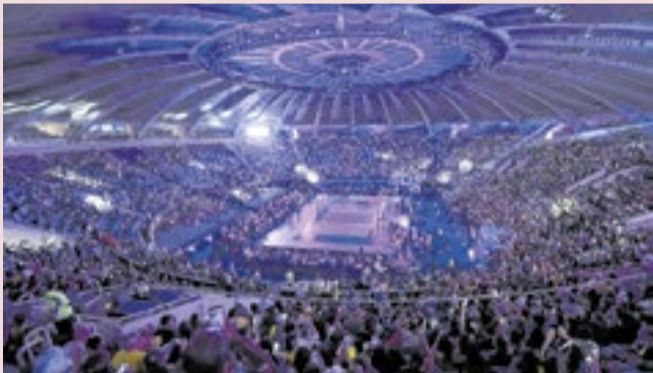
Maracanãzinho vai sediar o Sul-Americano