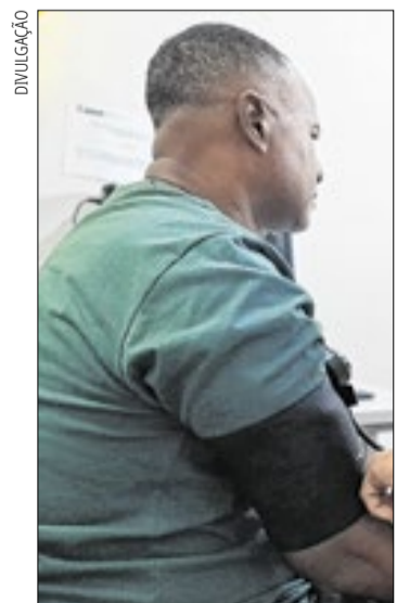
Sintomas podem incluir cansaço extremo, falta de ar etc

“Todas as unidades da Prefeitura estão preparadas para identificar rapidamente um infarto e encaminhar para os locais de tratamento. Você pode procurar uma Unidade de Pronto Atendimento, as Unidades Pré-Hospitalar, os hospitais Ferreira Machado, HGG e São José. O melhor é buscar a unidade mais próxima”, concluiu.