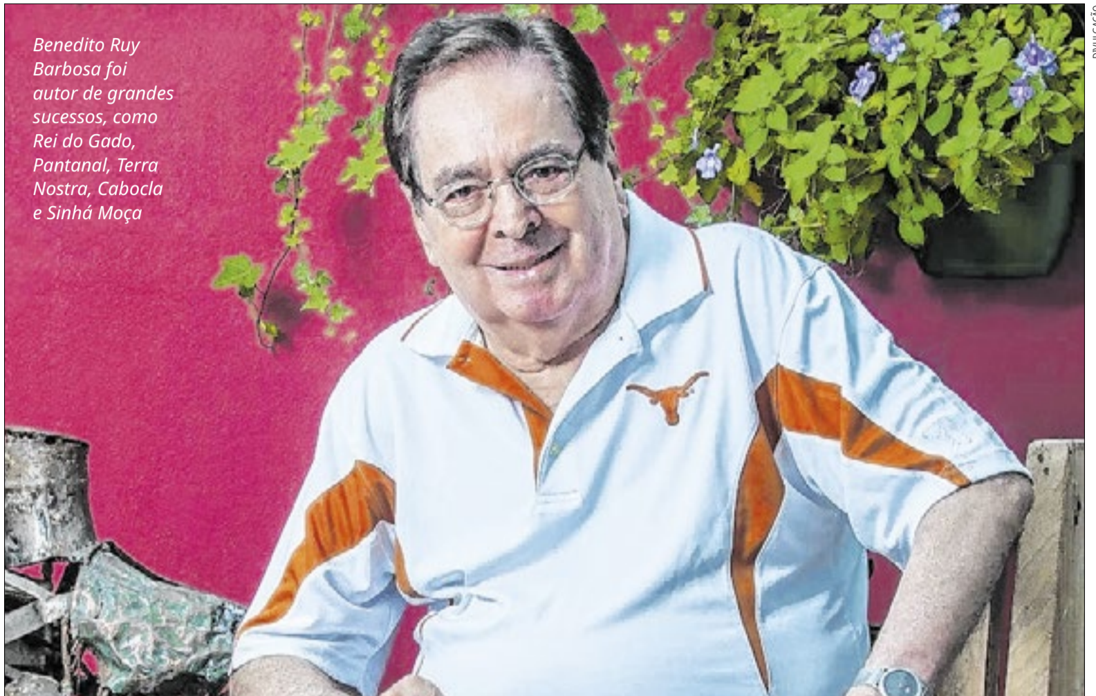
Benedito Ruy Barbosa foi autor de grandes sucessos, como Rei do Gado , Pantanal , Terra Nostra , Cabocla e Sinhá Moça

Nos últimos anos, Benedito Ruy Barbosa enfrentava