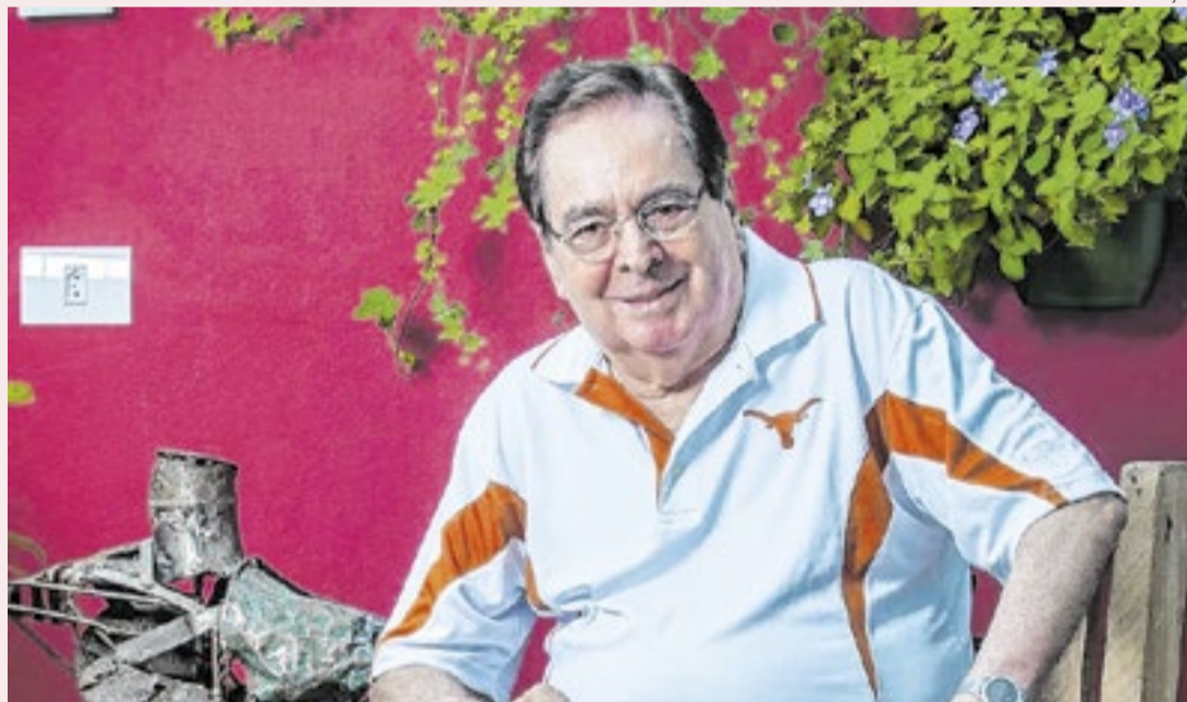
Benedito Ruy Barbosa foi autor de grandes sucessos, como Rei do Gado , Pantanal , Terra Nostra , Cabocla e Sinhá Moça

O Brasil deu adeus ao autor da teledramaturgia Benedito Ruy Barbosa, que não resistiu às complicações de uma insuficiência renal e morreu aos 95 anos. Benedito