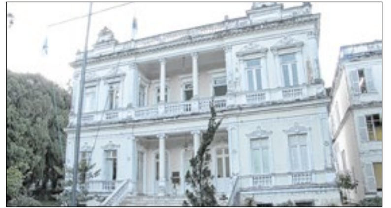
Decreto prevê revisão de contratos, corte de custos e suspensão de horas extras

A Prefeitura de Cordeiro, por meio da Secretaria de Administração, realizou, nesta segunda-feira (6), uma reunião técnica para definir os detalhes da implantação do Processo Digital (GPI). O encontro marcou o início da fase de operacionalização do novo sistema, que substituirá gradualmente o trâmite de documentos físicos por uma plataforma 100% digital.