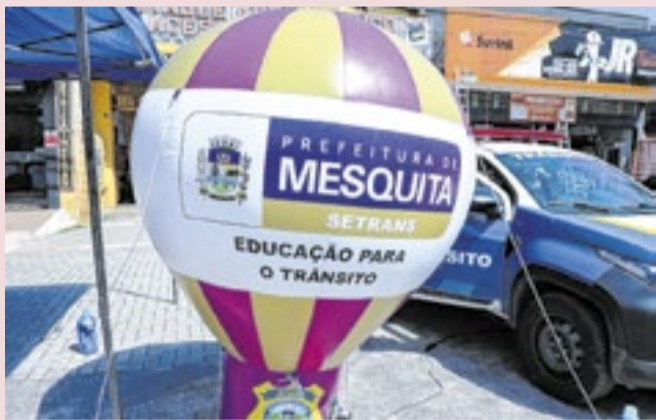
Iniciativa amplia ações de conscientização no trânsito

A Prefeitura de Mesquita ampliou o alcance das ações de Educação para o Trânsito desenvolvidas no município. A partir de agora, empresas, igrejas e escolas particulares também podem solicitar palestras promovidas pela Subsecretaria Municipal de Transporte e Trânsito, que levam orientações sobre segurança viária, respeito às leis de trânsito e atitudes capazes de contribuir para um trânsito mais seguro e organizado.