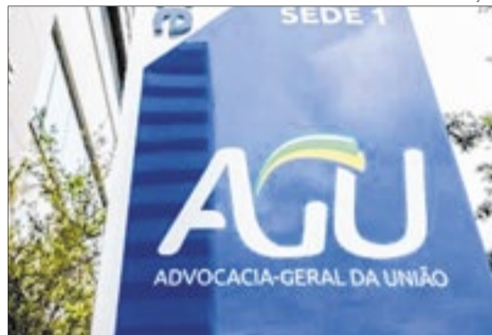
Determinação da AGU resultou na retirada de 100 mil reportagens da EBC do ar

■ No PT, há quem avalie que Jorge Messias, atual chefe da AGU, deveria ter entrado em campo para evitar que essas medidas fossem implementadas. Petistas lembram que ele chegou a ser escolhido por Lula para o STF e, após