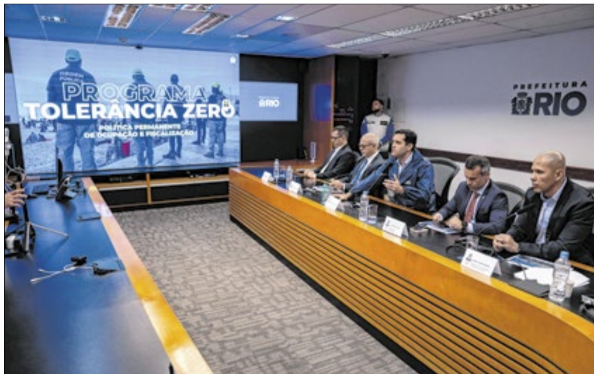
Nova política permanente de ordenamento urbano acontece nas orlas do Leme, Copacabana, Ipanema e Leblon