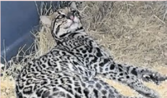
Animal foi atropelado na rodovia no dia 13 de abril