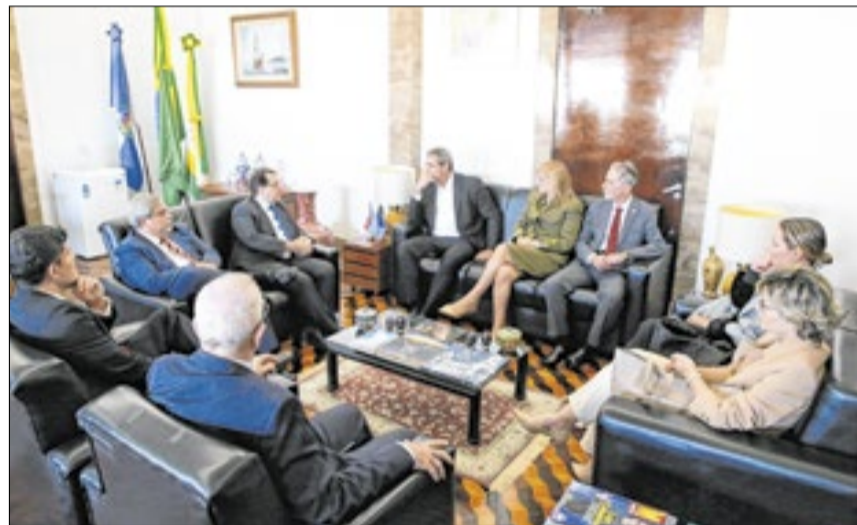
A proposta prevê a criação de novas unidades da Justiça do Trabalho no estado