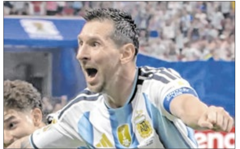
Messi teve 12 minutos faraônicos na classificação da Argentina sobre os egípcios

De olho no restante da temporada, o técnico do Flamengo, Leonardo Jardim, indicou que o elenco precisará de reforços. Para ele, um meio-campista ofensivo seria de grande ajuda, principalmente com a lesão de Lucas Paquetá, e um ponta mais agudo. Porém, a diretoria rubro-negra solicitou que ele procurasse mais opções na base do clube.