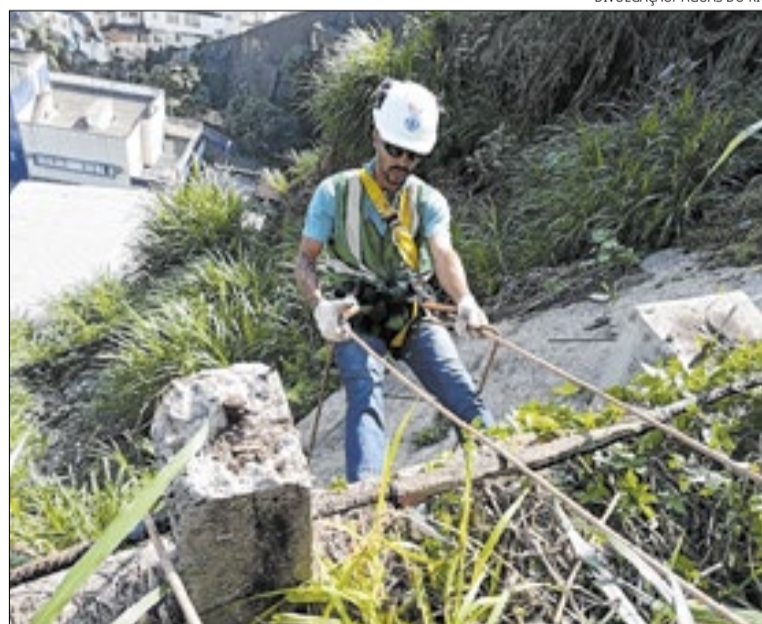
Técnica é utilizada em comunidades íngremes, como a Providência

“Quando falamos em universalizar o saneamento, estamos falando também de encontrar soluções para chegar onde muitas vezes a enge-