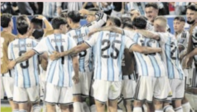
Final da Copa do Mundo será disputada em 19 de julho