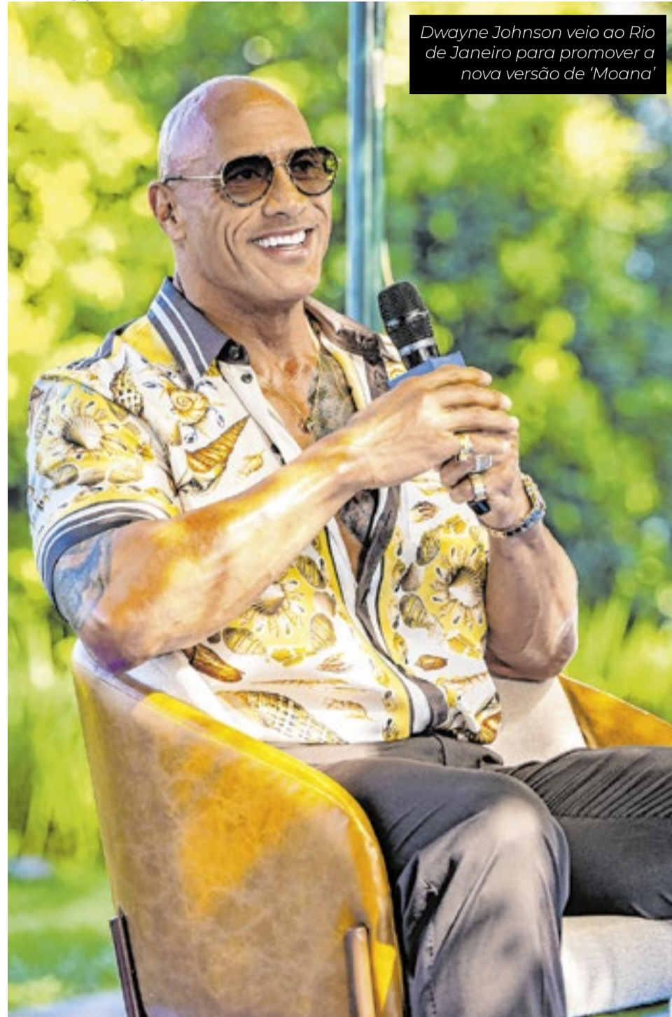
Dwayne Johnson veio ao Rio de Janeiro para promover a nova versão de 'Moana'