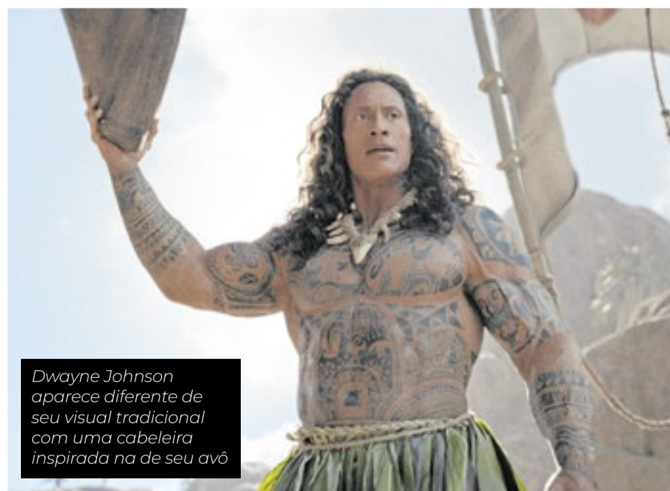
Dwayne Johnson aparece diferente de seu visual tradicional com uma cabeleira inspirada na de seu avô

inspirado em uma figura muito querida para ele: seu avô, Peter Maivia. Ex-lutador profissional, Maivia foi uma estrela do Wrestling da Samoa. Para o ator, dar vida ao Maui é como dar vida a ele. "Talvez algumas pessoas não saibam, mas o Maui foi inspirado no meu avô. E se você comparar uma foto do