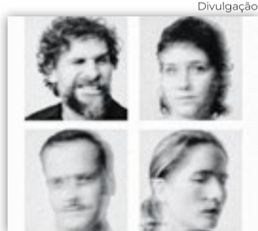
Os escanfandristas cantam Chico Buarque

A vocalização de “A Ostra e o Vento” sinaliza o cuidado que o quarteto tem com tal recurso que os caracteriza; uma flauta pontua acordes, enquanto as vozes femininas se alternam em duos e solos. “Futuros Amantes” inicia com um duo feminino e masculino em cânone; o violão traz a