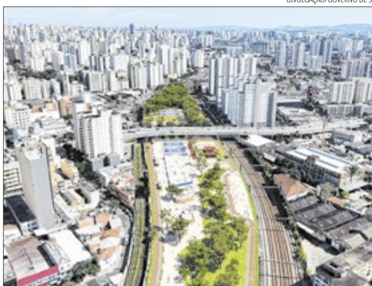
Empreendimento nos Campos Elíseos contará com 61,3 mil m 2 de área

A criação do parque está diretamente ligada ao processo de desocupação da Favela do Moinho, comunidade localizada entre linhas férreas na região central da capital. Nos últimos meses, famílias residentes no local participaram de um programa de reassen-