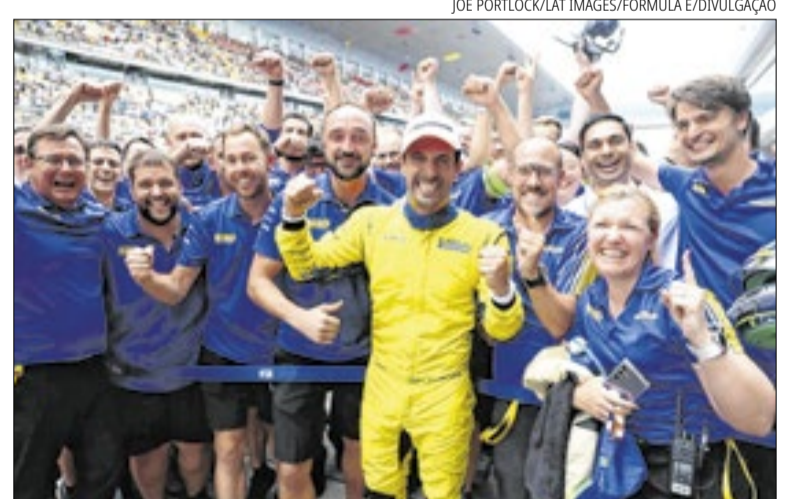
Lucas di Grassi celebra primeira vitória desde 2022 com equipe Lola Yamaha ABT

Pascal Wehrlein (TAG Heuer Porsche) conseguiu apenas o quarto lugar na bandeirada. Foi o suficiente para assumir a liderança no Campeonato de Pilotos, com 141