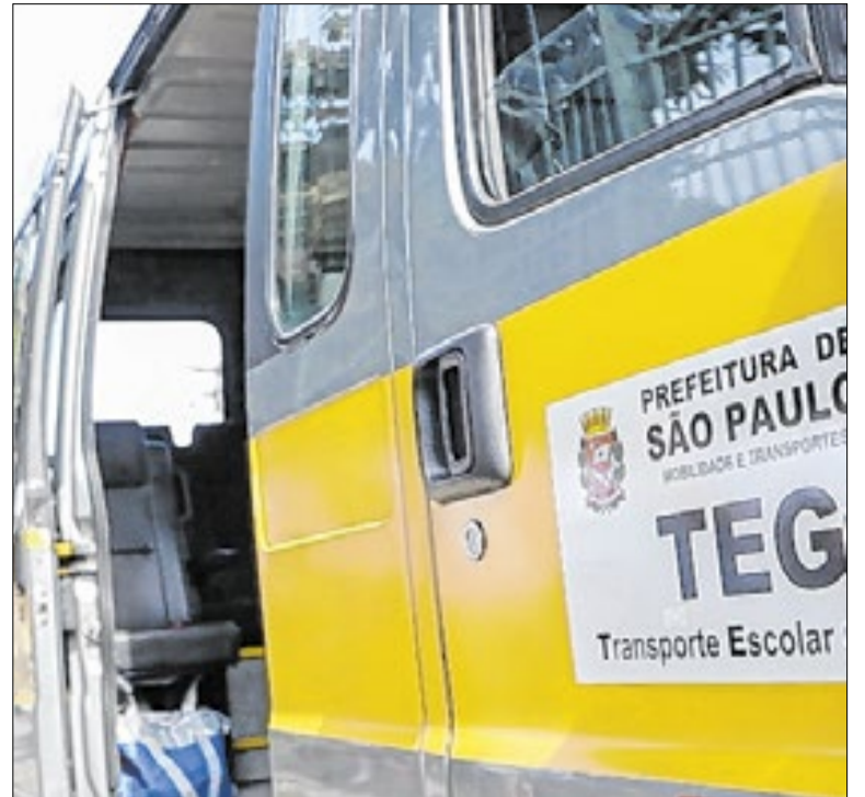
Entre os temas do evento, estarão os critérios para concessão do benefício

O município apresentou ações voltadas à adaptação, resiliência urbana e gestão de riscos climáticos, com destaque para iniciativas previstas no Plano de Ação Climática (PlanClima SP). O encontro promoveu a troca de experiências entre gestores e especialistas sobre medidas para reduzir os impactos climáticos e fortalecer políticas públicas.