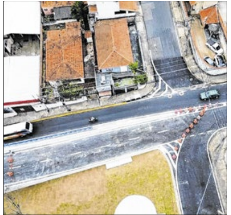
A decisão prevê multa diária de R$ 100 mil à Prefeitura e à empresa responsável

A Câmara de Franca realiza em 24 de julho, às 10h, audiência pública para discutir o Projeto de Lei que estabelece regras para instalação e funcionamento de crematórios públicos e privados no município. A proposta define critérios sanitários, ambientais e urbanísticos, além de normas para licenciamento e controle de emissões.