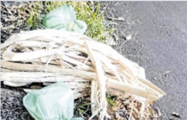
Segundo o Executivo, não houve interrupção do serviço