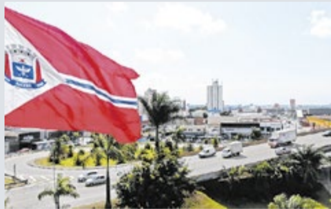
A avaliação mostra que a cidade possui boa saúde fiscal