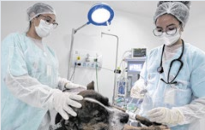
Procedimentos aumentaram entre 2021 e 2025