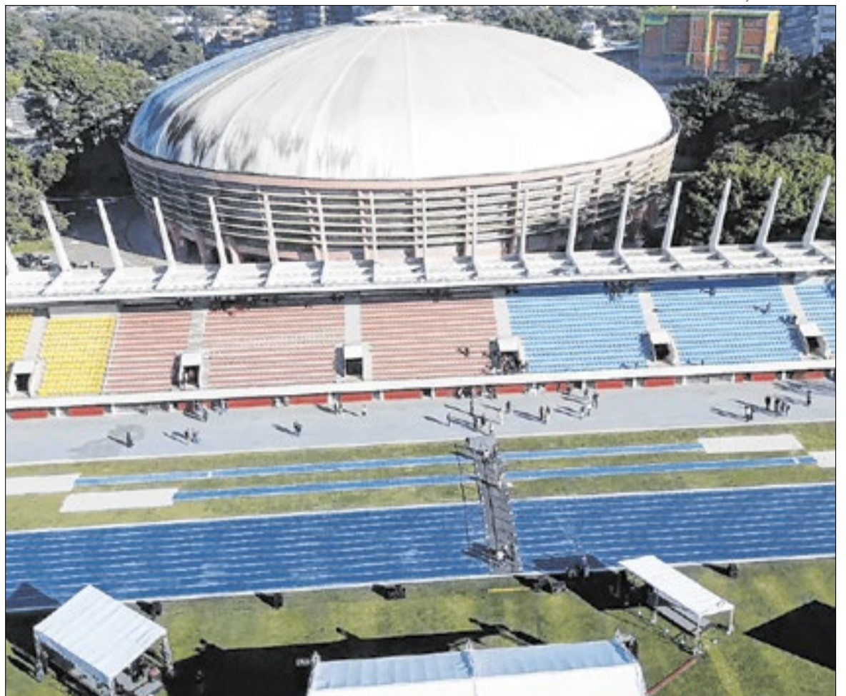
Estádio fica vizinho ao Ginásio do Ibirapuera

As arquibancadas passaram por recuperação estrutural e receberam melhorias voltadas à segurança e ao conforto dos espectadores. O estádio também ganhou novos espaços de apoio para delegações, equipes técnicas e arbitragem, além da renovação das áreas destinadas à preparação e ao atendimento dos atletas durante competi-