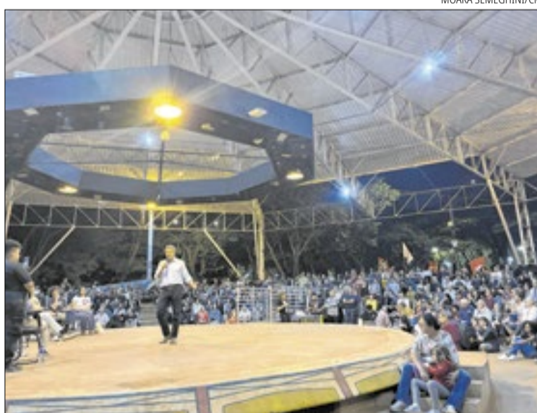
Fernando Haddad ministra aula magna no Teatro de Arena da Unicamp

Segundo o ex-ministro, a atual gestão federal tem atuado de forma paulatina e sob severas restrições orçamentárias para recompor estruturas básicas de Estado. De acordo com o