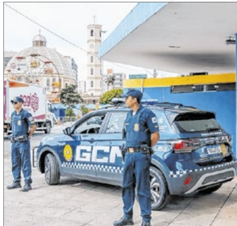
A redução dos roubos se relaciona com a estratégia de presença preventiva

Os novos editais de convocação com os locais de prova para ambos os concursos foram publicados no Diário Oficial de Guarulhos e no site do IBAM. A Secretaria de Gestão orienta que os candidatos acompanhem as atualizações nestes portais oficiais para garantir o acesso a todas as informações necessárias sobre a realização dos exames.