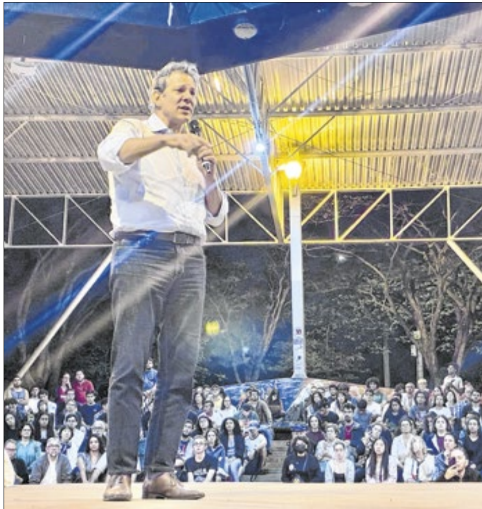
Aula magna ministrada pelo pré-candidato ao governo do Estado de São Paulo e ex-ministro da Fazenda, Fernando Haddad (PT), lotou o Teatro de Arena da Unicamp na última quinta-feira (2)

O ex-ministro reagiu por alguns segundos ao ocorrido antes de retomar a palestra, destacando a falta de disposição do rapaz para o debate. Ao notar a fuga imediata, Haddad lamentou o recuo ao microfone: “Ele já foi? Que pena, porque, se tivesse ficado, eu podia conversar e