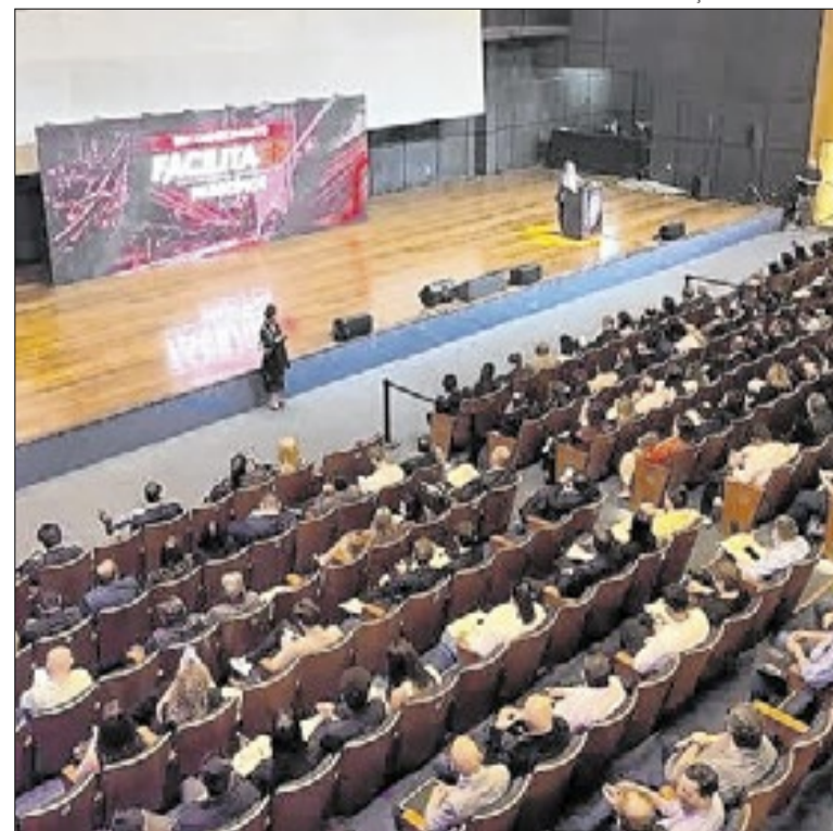
Selo Ouro passou de nove para 111 municípios em 2026

Os selos são concedidos conforme o avanço das prefeituras em seis eixos, entre eles integração tecnológica, modernização de processos e inovação. O Selo Bronze reconhece municípios que oferecem consulta digital de viabilidade do endereço para instalação de empresas, enquanto o Prata amplia os serviços com emissão integrada da inscrição municipal. Já o Ouro contempla cidades que digitalizaram os processos de licenciamento, permitindo maior agilidade na abertura e regularização de negócios.