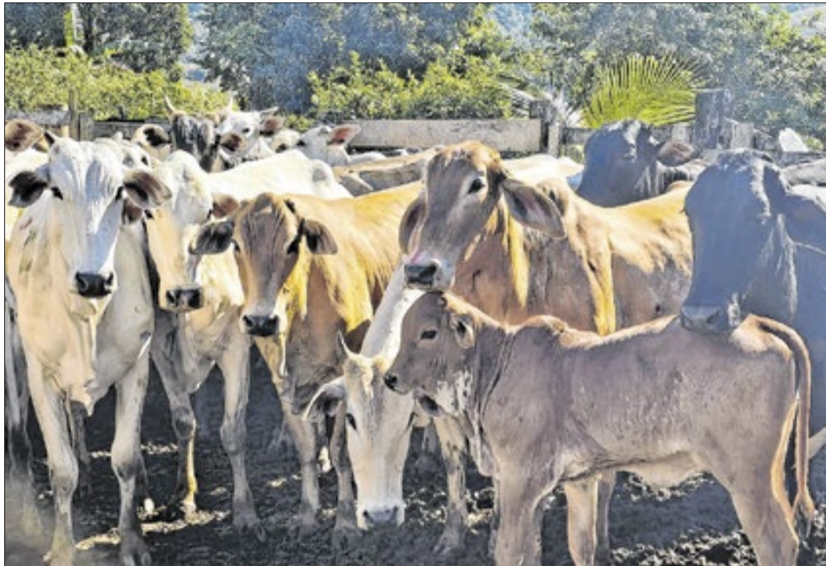
Iniciativa inédita no Rio oferece inseminação artificial gratuita aos produtores rurais e contribui para a qualidade genética do rebanho

Além da inseminação, o diferencial do "Macaé Reproduza+" está no acompanhamento técnico oferecido durante todas as etapas do processo. A