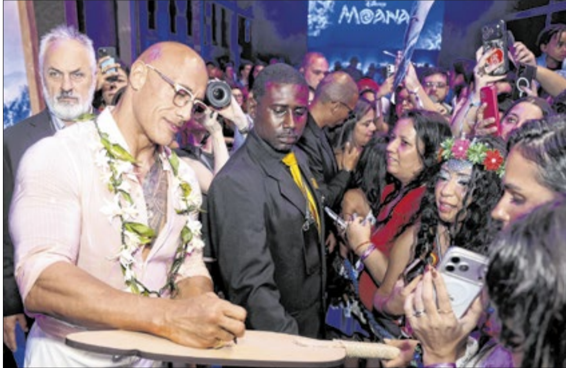
Dwayne 'The Rock' Johnson atendeu os fãs em evento promocional do filme 'Moana' durante sua passagem pelo Rio de Janeiro

"Sabe, eu estava falando sobre isso hoje de manhã e o Brasil é cinco vezes campeão da Copa do Mundo, mais do que qualquer outro. E independentemente do que acon-