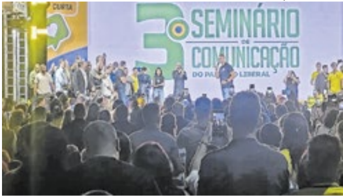
Seminário do PL lotou espaço de eventos no Rio