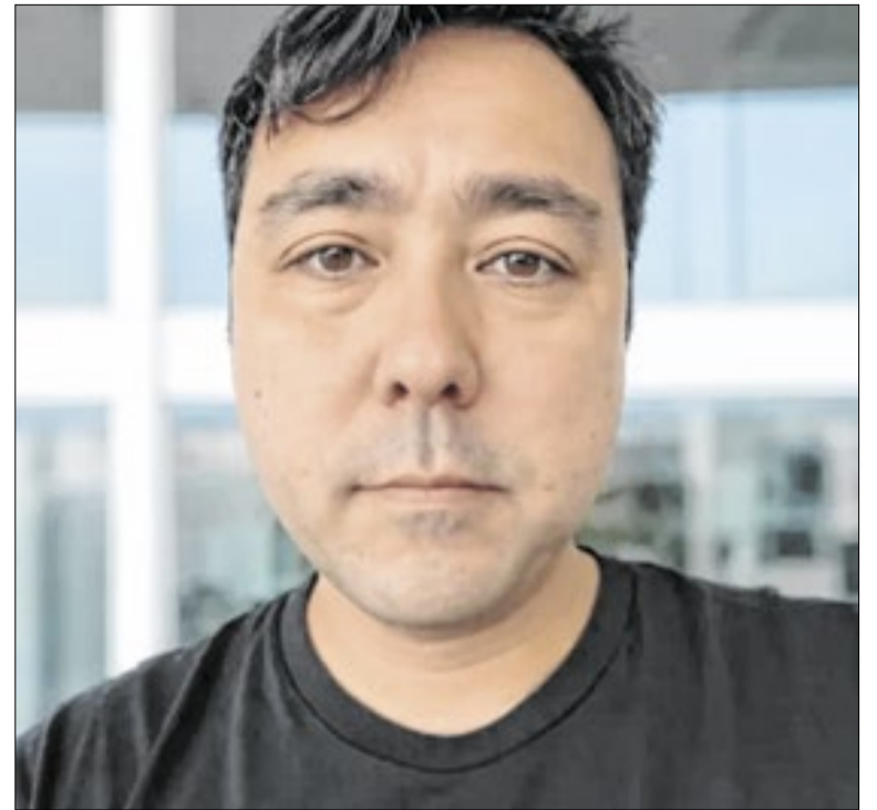
Shimada foi alvo tanto dos EUA quanto da PF

A Globo vai recuperar perdas com a propaganda eleitoral de 2026. Para as eleições de deste ano, a Receita Federal estima um custo total de R$ 996 milhões em renúncia fiscal para todo o setor de rádio e TV. Com base na proporção histórica de edições anteriores, estima-se que a Globo e suas afiliadas absorvam entre R$ 300 milhões e R$ 350 milhões desse total em deduções de impostos.