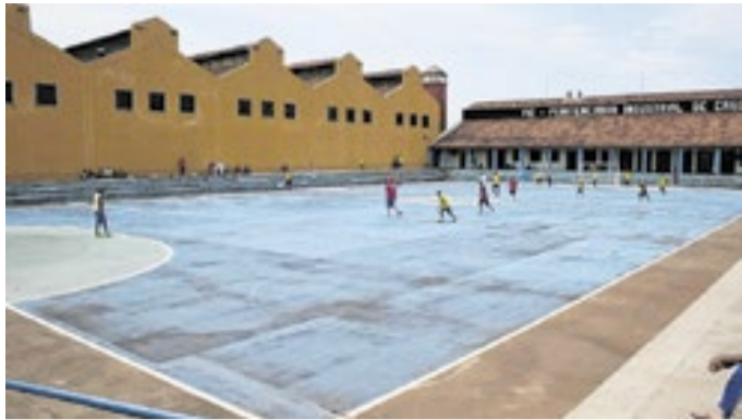
Prática esportiva na Penitenciária Industrial de Cascavel(PR)