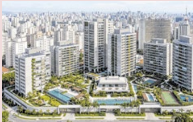
Congresso vai debater mudanças nas leis de condomínios