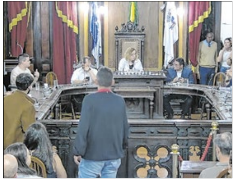
Na sessão foi levantado o questionamento sobre a recorrência dos desastres

Dessa nova frota, duas ambulâncias e uma van foram doadas pelo Ministério da Saúde. Além disso, uma van e um veículo de passeio foram adquiridos com recursos destinados pelo Governo do Estado do Rio de Janeiro, por meio da Alerj, e o segundo veículo de passeio foi comprado com recursos próprios do município, provenientes do leilão.