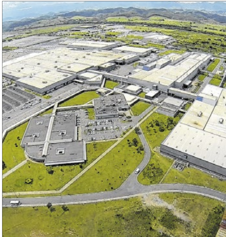
Stellantis investe R$ 3 bilhões na unidade de Porto Real até 2030, com foco na modernização da fábrica e na produção do Jeep Avenger; projeto prevê ainda 100 novas vagas diretas e a chegada de oito empresas fornecedoras ao polo automotivo

A administração municipal atribui esse desempenho à combinação entre investimentos privados e ações voltadas à preparação da cidade para receber novos empreendimentos. Entre elas estão as obras realizadas na Avenida Renato Monteiro, principal acesso ao polo industrial, e os cursos de qualificação profissional oferecidos pelo Centro de Capacitação e Inovação de Porto Real (Ce-