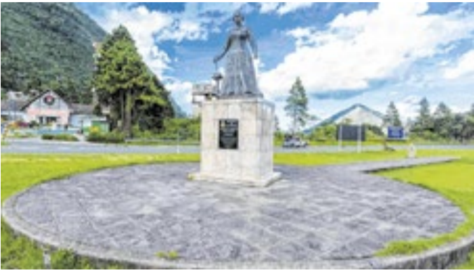
É de Teresa Cristina a origem do nome da cidade