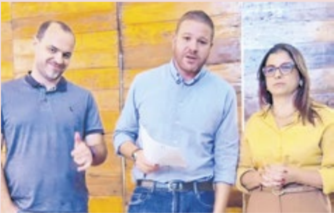
Objetivo do investimento é reduzir a fila da cirurgia