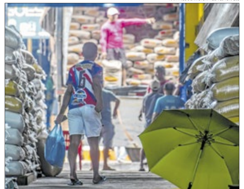
Vendas ao país subiram 3,7% em junho; China e UE ampliam compras

O comércio com a União Europeia também apresentou expansão em junho, embora