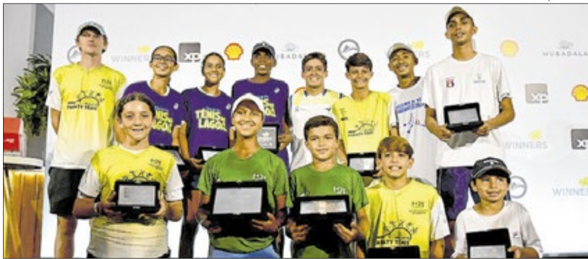
Torneio Winners é a competição anual do Rio Open para crianças e adolescentes atendidos pelos projetos parceiros

“O legado do Rio Open não se encerra quando termina o torneio. Desde a primeira edição construímos uma plataforma social que busca criar oportunida-