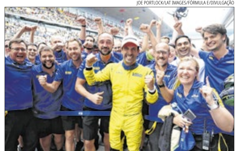
Lucas di Grassi celebra primeira vitória desde 2022 com equipe Lola Yamaha ABT

Pascal Wehrlein (TAG Heuer Porsche) conseguiu apenas o quarto lugar na bandeirada. Foi o suficiente para assumir a liderança no Campeonato de Pilotos, com 141