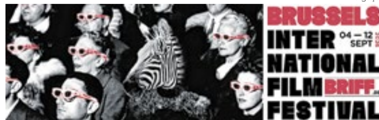
Cartaz do BRIFF, agendado para setembro