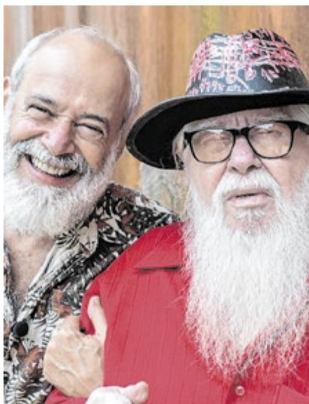
Mentor musical de Carlos Malta, Hermeto Pascoal foi influência marcante na obra do multi-instrumentista

Depoimentos de colaboradores de longa data revelam a dimensão de sua influência. “Carlos Malta o músico de excelência multi-instrumentista compositor arranjador que tanto colaborou e tem colaborado com a minha carreira eu só posso agradecer a convivência com esse artista genial. Ele tem esse reconhecimento por onde ele passa ele deixa a marca dele é um orgulho da música brasileira é um orgulho de ser seu amigo”, destaca Guinga.