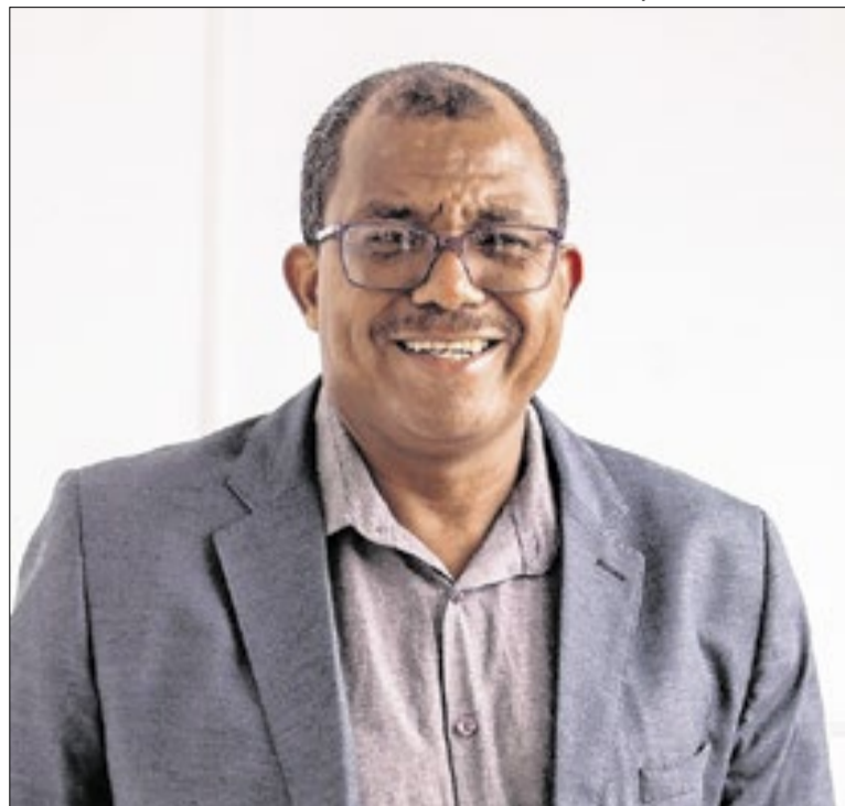
Ele cita o servidor de forma intimidatória e associa o trabalhador a um partido adversário

A Santa Casa de Bragança Paulista informou que não renovará a gestão do SAMU e do Transporte Sanitário Agendado, alegando que os serviços exigem especialização diferente da atuação hospitalar. A Prefeitura iniciou o processo de transição e garantiu que o atendimento segue normalmente pelo telefone 192. A mudança não afeta a administração das UPAs.