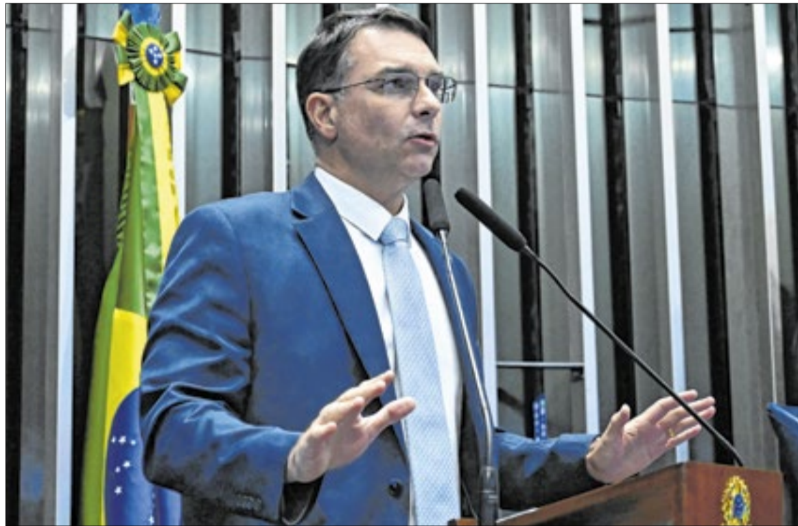
Enquanto governo Lula comunica EUA por meio do Itamaraty, Flávio atua diretamente contra o tarifaço

“A manifestação de Flávio Bolsonaro tem natureza política e não produz efeitos jurídicos diretos na negociação. Trata-se da atuação de um par-