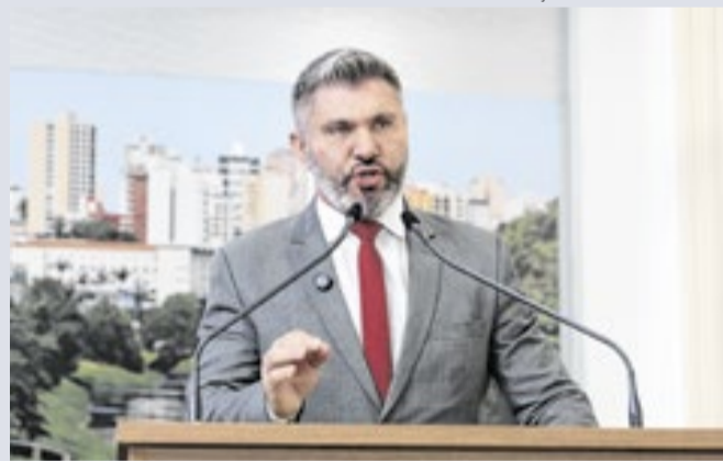
Vereador elenca uma série de medicamentos em falta