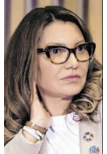
TCU não viu irregularidades em viagem de Janja

O Tribunal de Contas da União (TCU) arquivou a solicitação apresentada pela Comissão de Relações Exteriores e de Defesa Nacional (CREDN) da Câmara dos Deputados para apurar a legalidade da antecipação da viagem oficial da primeira-dama Janja a Nova York, em setembro de 2025. O acórdão foi aprovado pelo Plenário da Corte nesta quarta-feira (1/7).