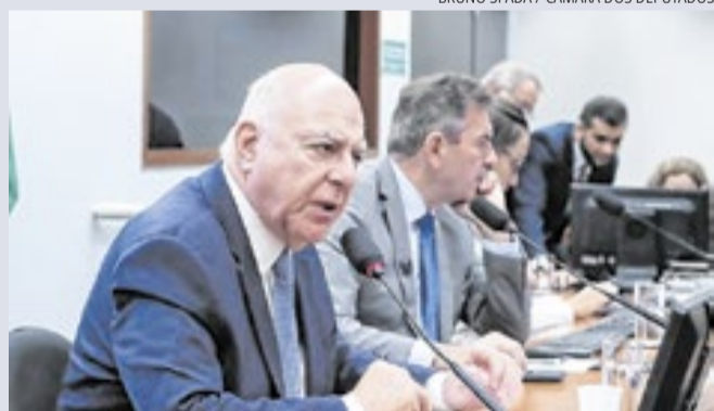
Dep. Federal Arnaldo Jardim (Cidadania-SP) é relator da PEC

Comissão Especial da Câmara aprovou o parecer do deputado federal Arnaldo Jardim (Cidadania-SP) à PEC 231/19, dos deputados Pedro Uczai (PT-SC) e Reginaldo Lopes (PT-MG), que amplia o Fundo de Participação dos Municípios (FPM) em 1% e cria fundos constitucionais para as regiões Sul e Sudeste. A proposta eleva a fatia da União de 50% para 53% e segue ao Plenário em dois turnos antes do Senado. O impacto no Orçamento será de R$ 11,2 bilhões em 2028. Se aprovada, a implementação ocorrerá de forma gradual.