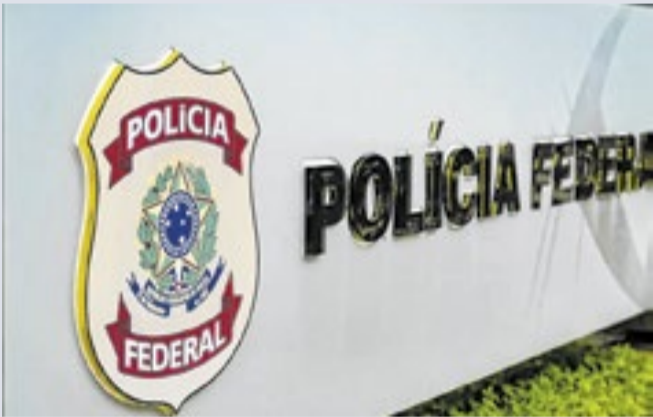
Fachada do Prédio da Polícia Federal, em Brasília.