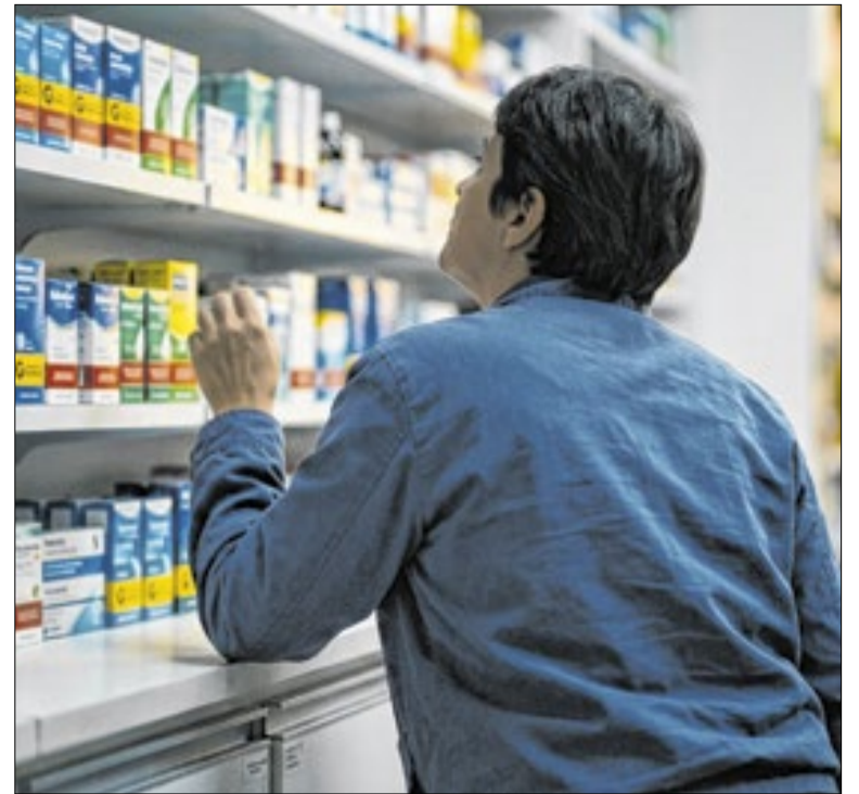
Consulta de preços e o conhecimento do PMC estão previstas na regulação do setor.

A Secretaria de Desenvolvimento Econômico de São Paulo (SDE) prorrogou até domingo (5) as inscrições para 1.871 vagas em cursos gratuitos do programa Qualifica SP, disponíveis na plataforma Trampolim. As formações são presenciais e online em 39 opções de áreas como logística, gestão, informática e serviços, com oferta em diferentes regiões do estado.