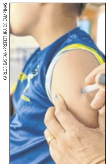
Jovens de 15 a 19 anos podem se vacinar contra o HPV até dezembro

A vacina contra o HPV é indicada em programas nacionais de mais de 100 países e tem resultados comprovados na redução de cânceres de colo do útero, vulva, vagina, região anal, pênis, orofaringe e de verrugas genitais. A vacinação na faixa etária recomendada é mais eficaz porque a produção de anticorpos é maior nessa fase. O HPV é um vírus que tem mais de 100 tipos diferentes. É transmitido pelo contato direto com pele ou mucosas infectadas, principalmente por meio de relação sexual.