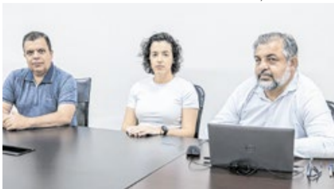
Comissão questiona fechamento de salas de aula pelo Estado