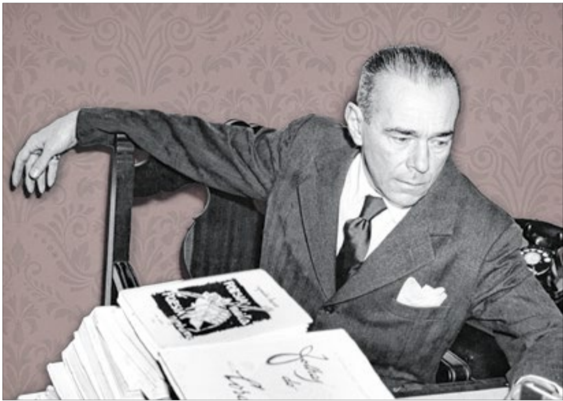
Guilherme de Almeida foi o primeiro escritor modernista a ingressar na ABL