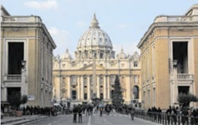
Ato é considerado um cisma dentro da Igreja Católica