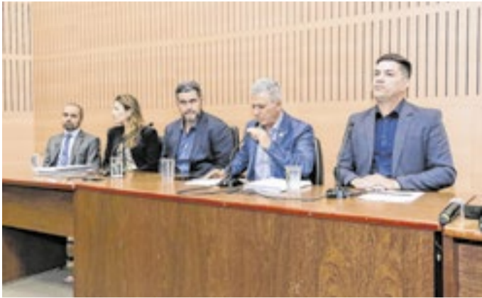
Presidente Haddad com a palavra durante a sessão