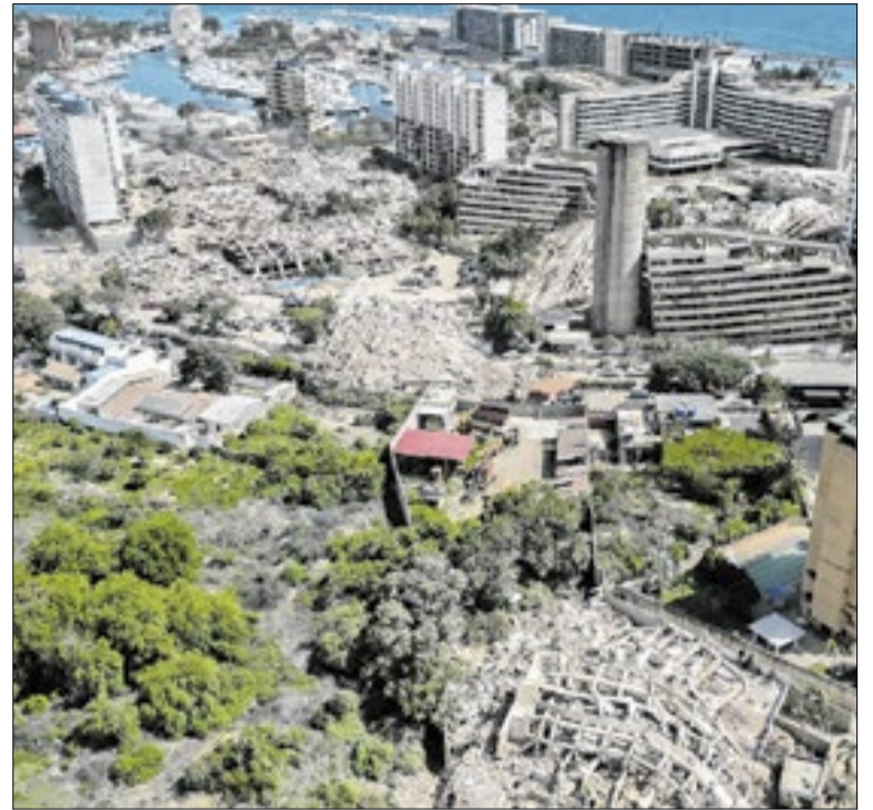
Estado de La Guaria foi o mais afetado do país

Negociadores dos Estados Unidos e do Irã tiveram “avanços positivos” durante uma nova rodada de conversas em Doha. As conversas, porém, vão ser retomadas depois do funeral do ex-líder supremo iraniano, Ali Khamenei, que deverá começar no sábado (4) e durar seis dias. O sepultamento está marcado para a quinta-feira (9) em Mashhad.