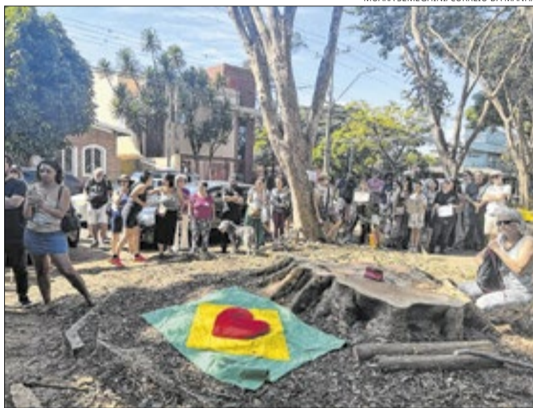
Manifestantes ao redor do que restou de uma das árvores extraídas pela Prefeitura