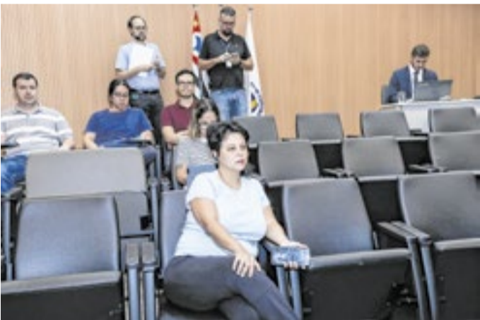
Conti na reunião que informou a continuidade da CP