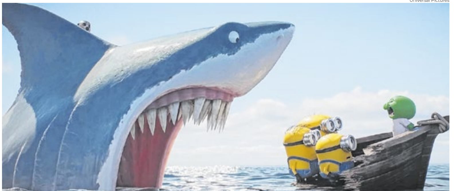
Numa brincadeira com o próprio cinema, o novo Minions pode arrecadar US$ 1 bilhão

A história da Illumination, a empresa que inventou essa turminha, começou em 2007, quando Chris Meledandri deixou a Fox para fundar um estúdio baseado numa ideia simples: produzir animações mais