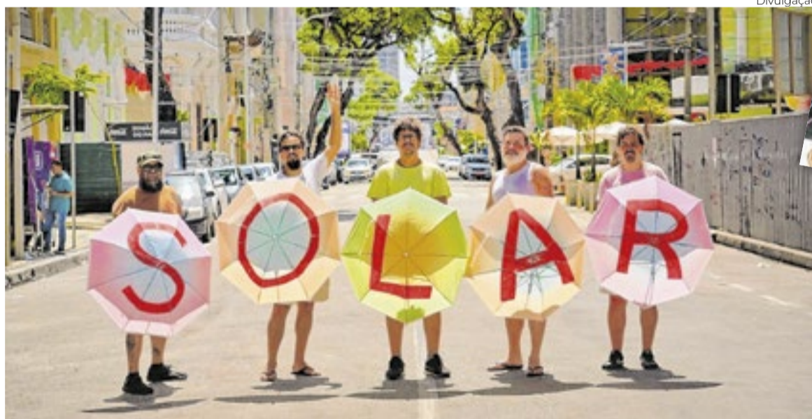
Também de Recife, o Mombojó traz seu álbum 'Solar' aos placos cariocas

É a batida do maracatu e a drum machine, o ritmo ancestral e a experimentação eletrônica, tudo no mesmo tempo e espaço. O disco traz faixas clássicas como "Manguetown", "Macô" e a célebre versão de "Maracatu Atômico", que ganhou novas dimensões com remixes em ragga e trip-hop. A produção de Bid incorporou influências muito além do Nordeste,