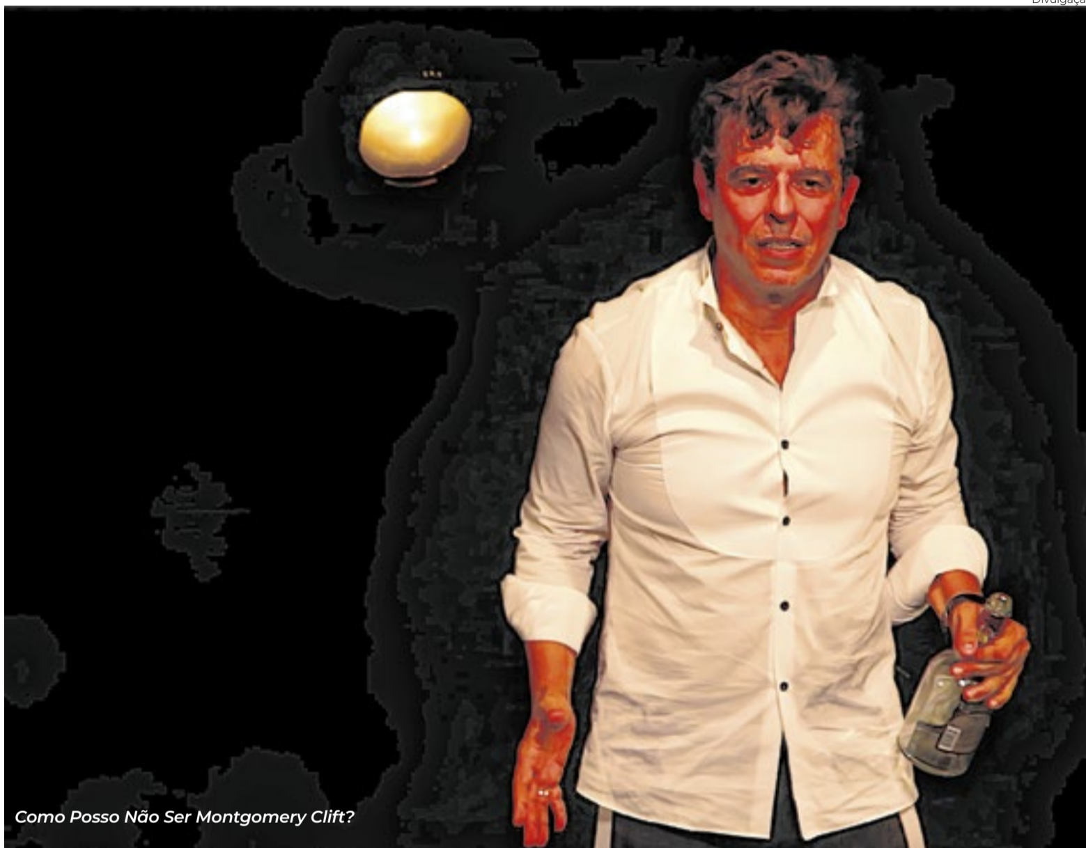
Como Posso Não Ser Montgomery Clift?

*A Orquestra de Gaitas de Foles, de São Gonçalo, e o harpista mexicano Baltazar Juarez apresentam mistura inédita de sons e culturas. Sáb (4), às 15h. CCBB RJ (Rua Primeiro de Março, 66 - Centro). Grátis