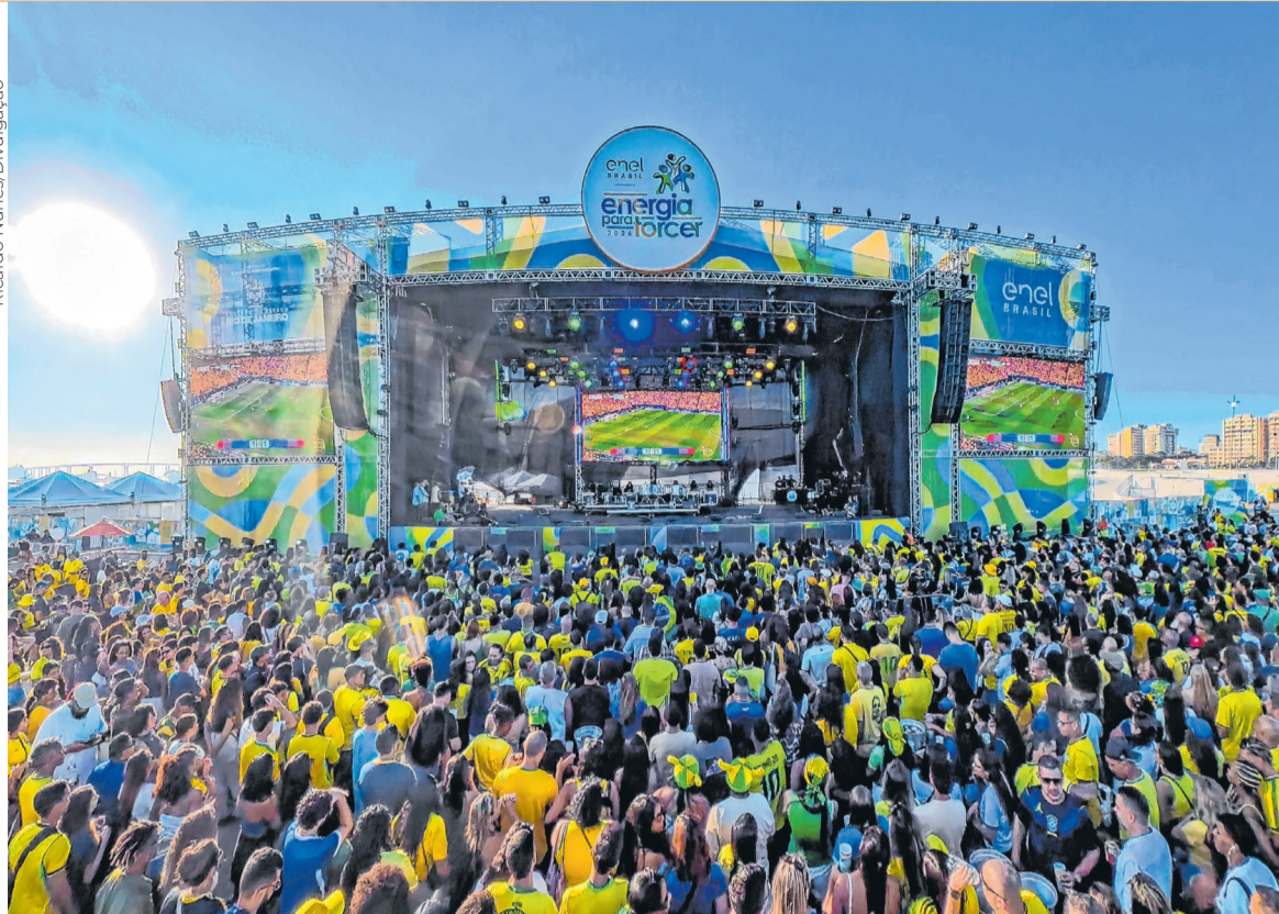
Energia Pra Torcer

SUGESTÕES PARA SEXTOU@CORREIODAMANHA.NET.BR