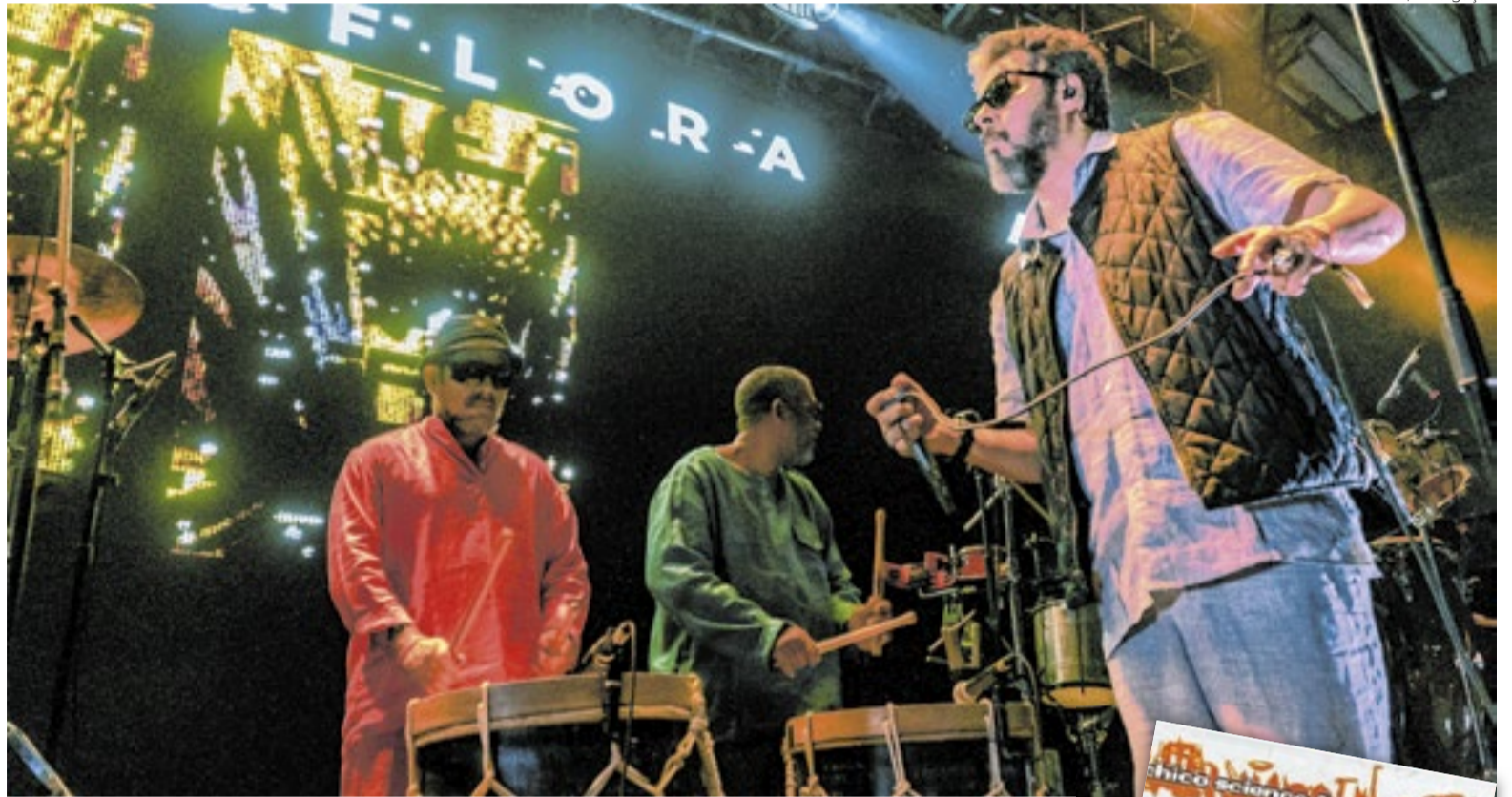
Nação Zumbi no palco do Circo Voador é garantia de casa cheia

Nação Zumbi volta ao Circo Voador com show de 30 anos de 'Afrociberdelia', álbum fundamental do movimento Manguebeat. Mombojó, também recifense, abre a noite