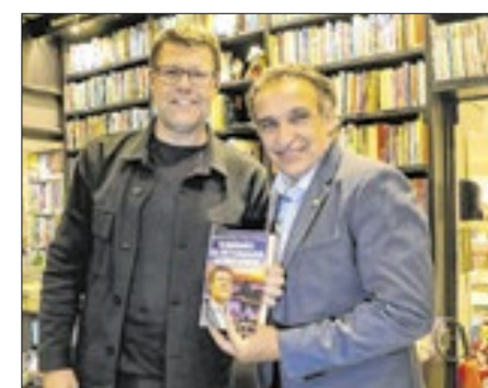
O deputado federal, Hugo Leal, esteve prestigiando a noite de lançamento do livro de Gustavo Tutuca na Travessa do Leblon