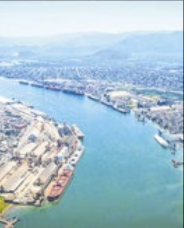
Túnel ligará Santos e Guarujá (SP)

Em março deste ano, o TCU havia determinado, em