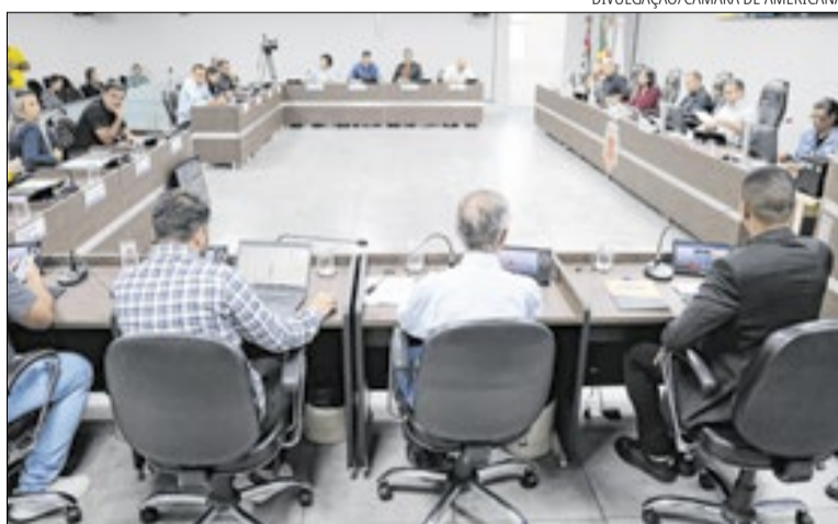
Proposta substitui uma legislação de 2022 para adaptar a cidade às normas federais

A nova lei cria regras para a instalação dos equipamentos das operadoras. A prefeitura terá até 60 dias para analisar os pedidos. Se não responder nesse prazo,