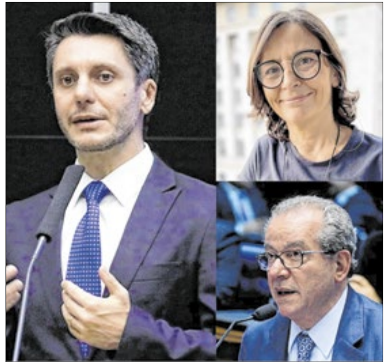
Alex Manente, Soninha Francine e José Aníbal estão entre os cotados pela Federação