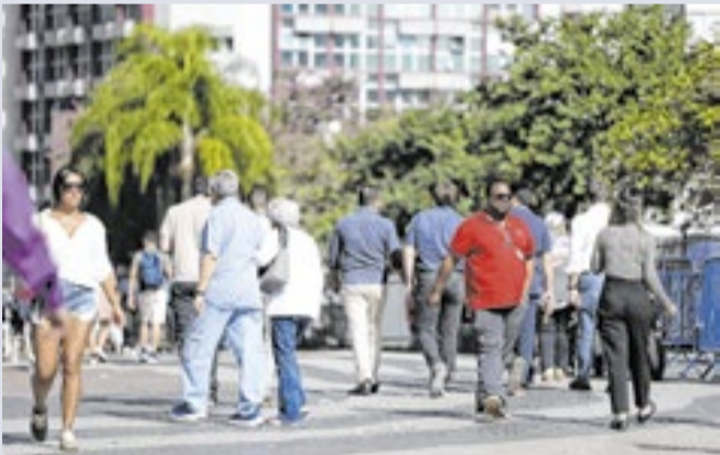
Dados do Caged medem crescimento em 5 setores