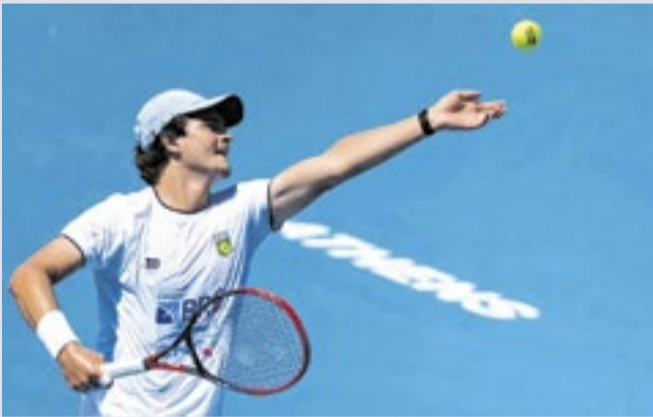
João Fonseca segue se destacando no mundo do Tênis