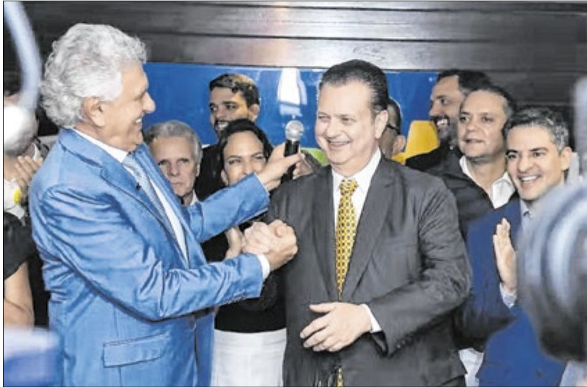
Caiado e Kassab apresentam palanque alternativo à polarização

Finalmente também foi impossível não notar a ausência de alguns expoentes do PSD nas eleições deste ano. Não compareceram à solenidade na qual o presidente do partido, Gilberto Kassab, foi anunciado como candidato a vice-presidente na chapa do ex-governador de Goiás Ronaldo os governadores do partido, como Eduardo Leite, do Rio Grande do Sul, e Ratinho Jr., do Paraná. Também estavam ausentes nomes favoritos a governador que estão mais alinhados a outras candidaturas, como o ex-prefeito do Rio de Janeiro Eduardo Paes.