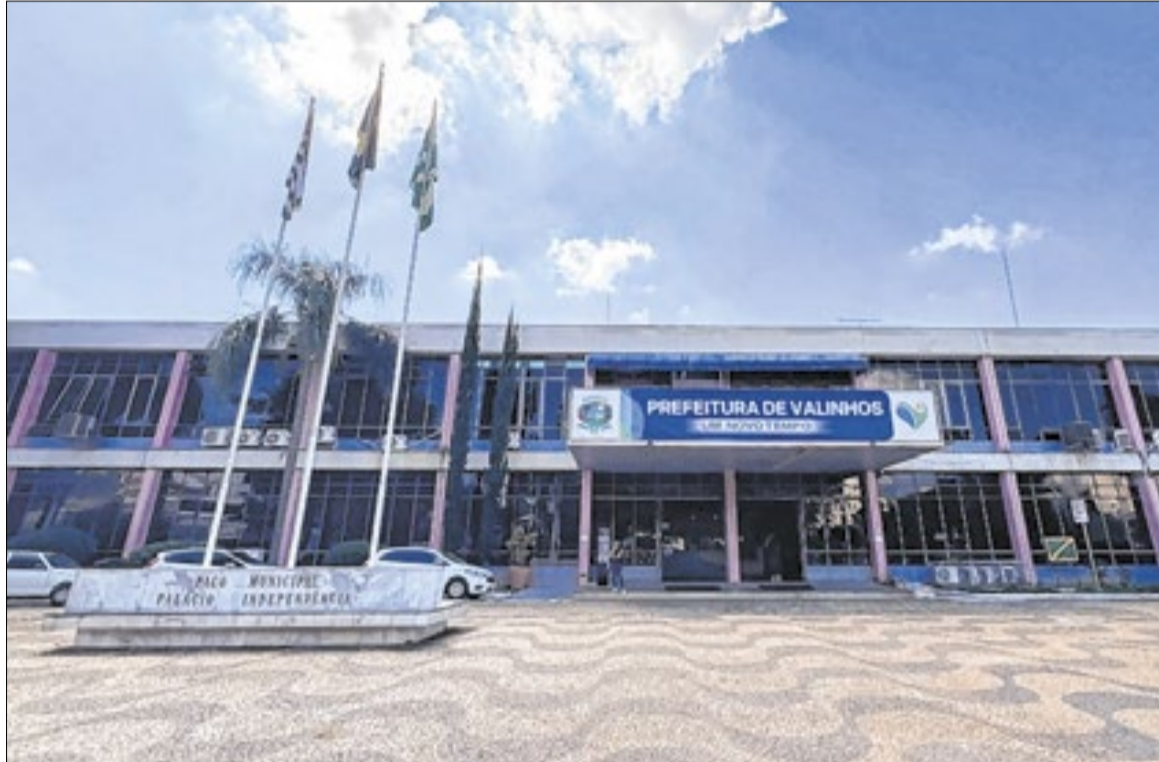
Valinhos figura entre os primeiros municípios da Região Metropolitana de Campinas a efetivar o benefício aos funcionários

O município já havia sinalizado a recomposição dos direitos em janeiro deste ano, quando aprovou a Lei Municipal nº 6.864/2026. A norma estabeleceu o compromisso da administração com a restituição dos direitos dos servidores e definiu que os efeitos financeiros começariam em