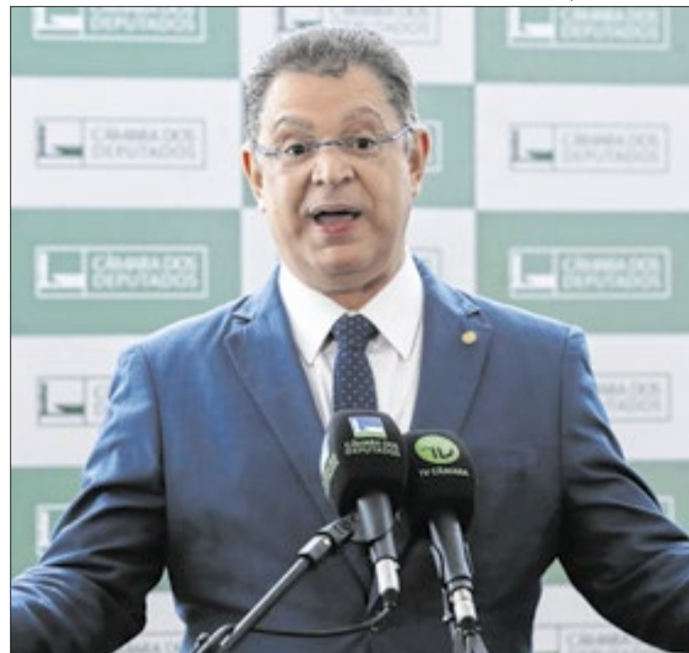
A nova fase da operação atingiu pessoas próximas a Sóstenes

Ao longo de mais de 200 anos de história, a Legião de Honra foi concedida a inúmeras personalidades excepcionais, como Louis Pasteur, cujas descobertas revolucionaram a medicina, Marie Curie, duas vezes ganhadora do Prêmio Nobel e figura de destaque da ciência, e Charles de Gaulle, artífice da Libertação e fundador da Quinta República.