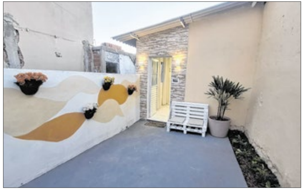
Após a transformação realizada pela equipe, a casa fica irreconhecível