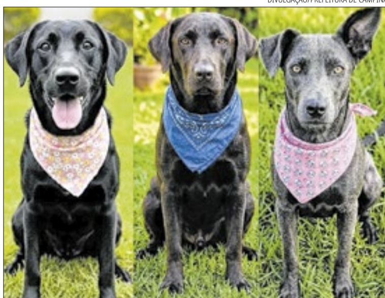
Tobias, Lara e Blue: disponíveis para adoção responsável pelo DPBEA da Prefeitura

Para adotar um cão ou um gato do DPBEA, o interessado deve entrar no site Portal Animal portalanimal.campinas.sp.gov.br/adocao – e clicar na imagem do pet que deseja levar para casa. Após escolher o novo amigo, é preciso clicar