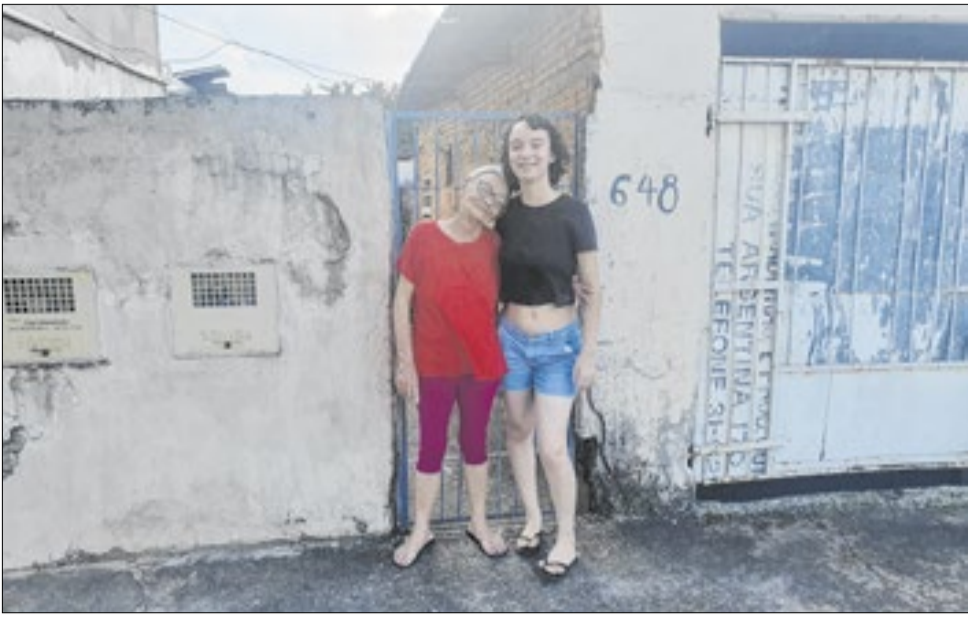
Avó e neta receberam os voluntários com alegria para a reforma