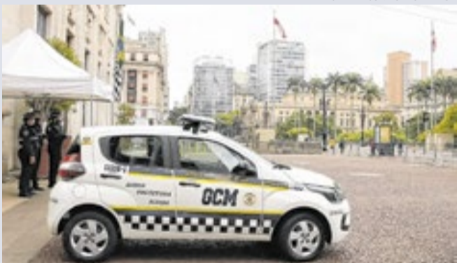
Três dos réus faziam parte da GCM da capital