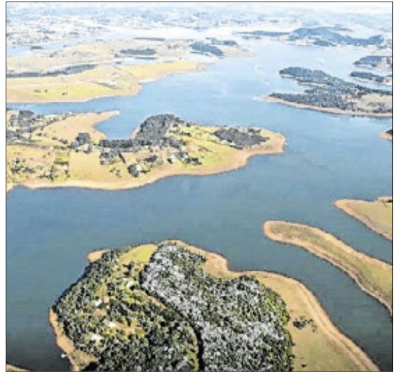
Limite máximo para retirada de água despencou de 31m³ para 27m³ por segundo

A postura da Comissão Processante consolida a relevância da fiscalização rigorosa. Ao antecipar o parecer, o colegiado não apenas cumpre o dever, mas estabelece um marco de eficiência na gestão pública local. Campinas ganha uma política madura, na qual o respeito aos prazos e à sociedade prevalece acima de qualquer pausa regimental.