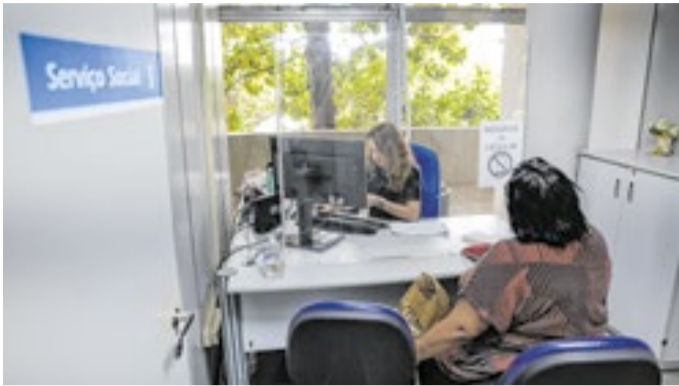
Reclamações por demora recuam 44%