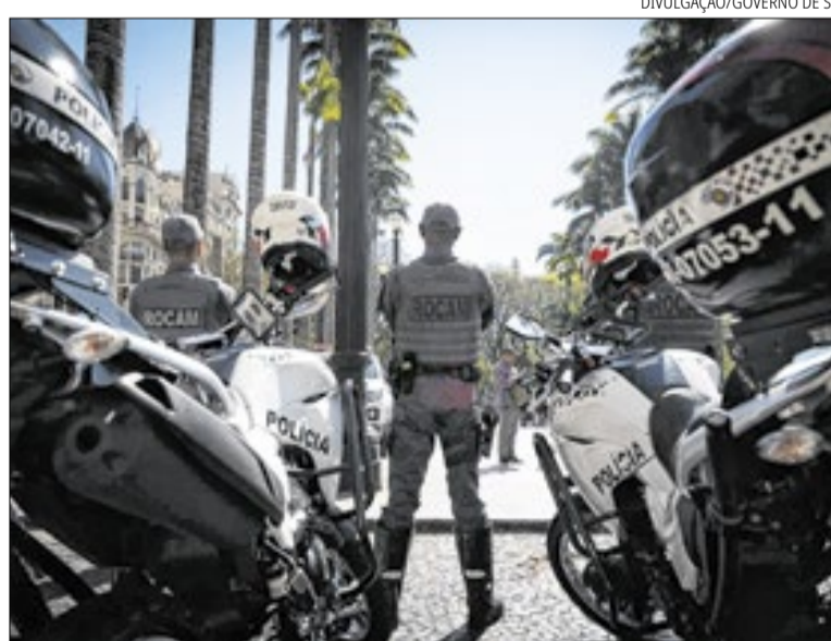
Governo diz que resultados refletem reforço do policiamento em áreas críticas

Os roubos de veículos também diminuíram. Em maio foram contabilizadas