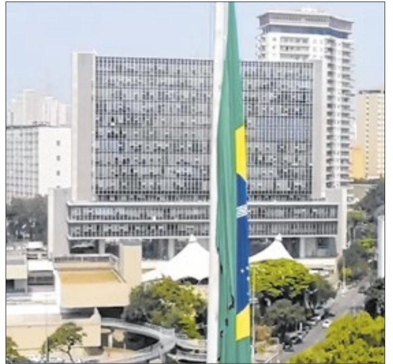
Audiência pública tem objetivo de aperfeiçoar o projeto antes da votação

O atendimento na Zona Oeste será sigiloso, sem necessidade de agendamento, e oferecerá testes rápidos para HIV e sífilis, além de exames para hepatites B e C, clamídia e gonorreia. Pessoas com diagnósticos positivos para HIV poderão iniciar o tratamento imediatamente, com a retirada da primeira dose da terapia antirretroviral imediata.