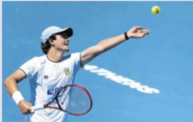
João Fonseca segue se destacando no mundo do Tênis