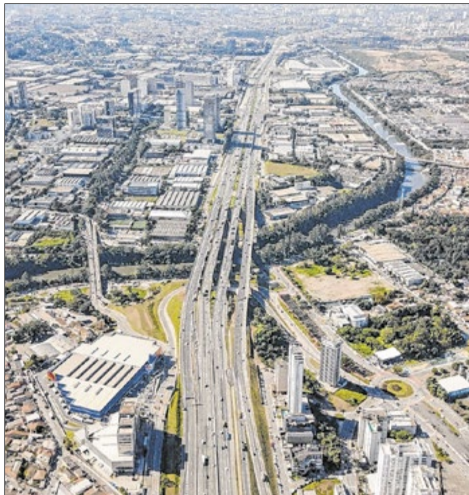
Obra requalifica acessos estratégicos a Barueri, Alphaville e Tamboré

O projeto também incluiu a construção e adequação de viadutos, alças de acesso e novas conexões entre a rodovia e vias urbanas. As mudanças tiveram o objetivo de facilitar os deslocamentos entre bairros da região e reduzir conflitos entre veí-