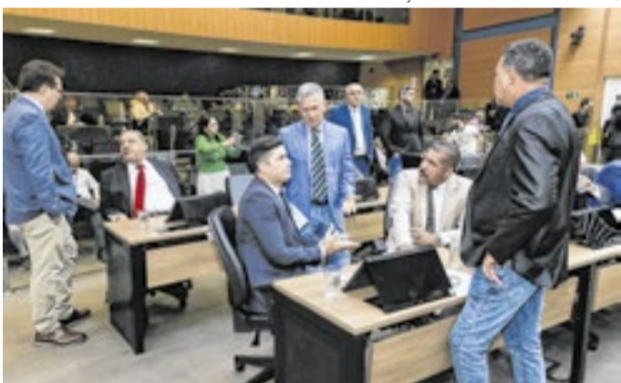
Caso CP aponte arquivamento, decisão vai à votação