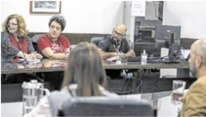
Temas sobre importância de aderir aos planos do município