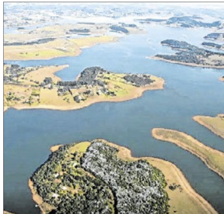
Limite máximo para retirada de água despencou de 31m³ para 27m³ por segundo

A postura da Comissão Processante consolida a relevância da fiscalização rigorosa. Ao antecipar o parecer, o colegiado não apenas cumpre o dever, mas estabelece um marco de eficiência na gestão pública local. Campinas ganha uma política madura, na qual o respeito aos prazos e à sociedade prevalece acima de qualquer pausa regimental.