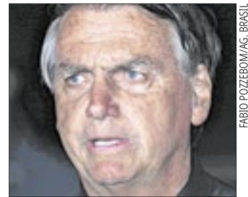
Em depoimento, Jair Bolsonaro afirmou que a pistola havia apresentado problemas

A arma periciada é uma pistola Glock G17 Gen4, calibre 9 mm, acompanhada de um carregador e 30 munições. O material foi apreendido após policiais militares encontrarem o armamento