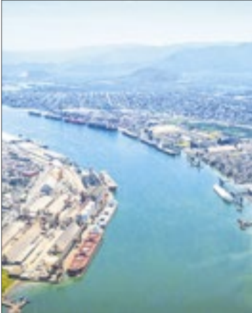
Túnel ligará Santos e Guarujá (SP)

Em março deste ano, o TCU havia determinado, em