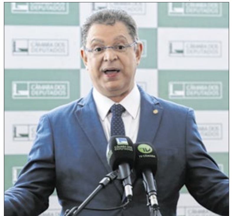
A nova fase da operação atingiu pessoas próximas a Sóstenes

Ao longo de mais de 200 anos de história, a Legião de Honra foi concedida a inúmeras personalidades excepcionais, como Louis Pasteur, cujas descobertas revolucionaram a medicina, Marie Curie, duas vezes ganhadora do Prêmio Nobel e figura de destaque da ciência, e Charles de Gaulle, artífice da Libertação e fundador da Quinta República.