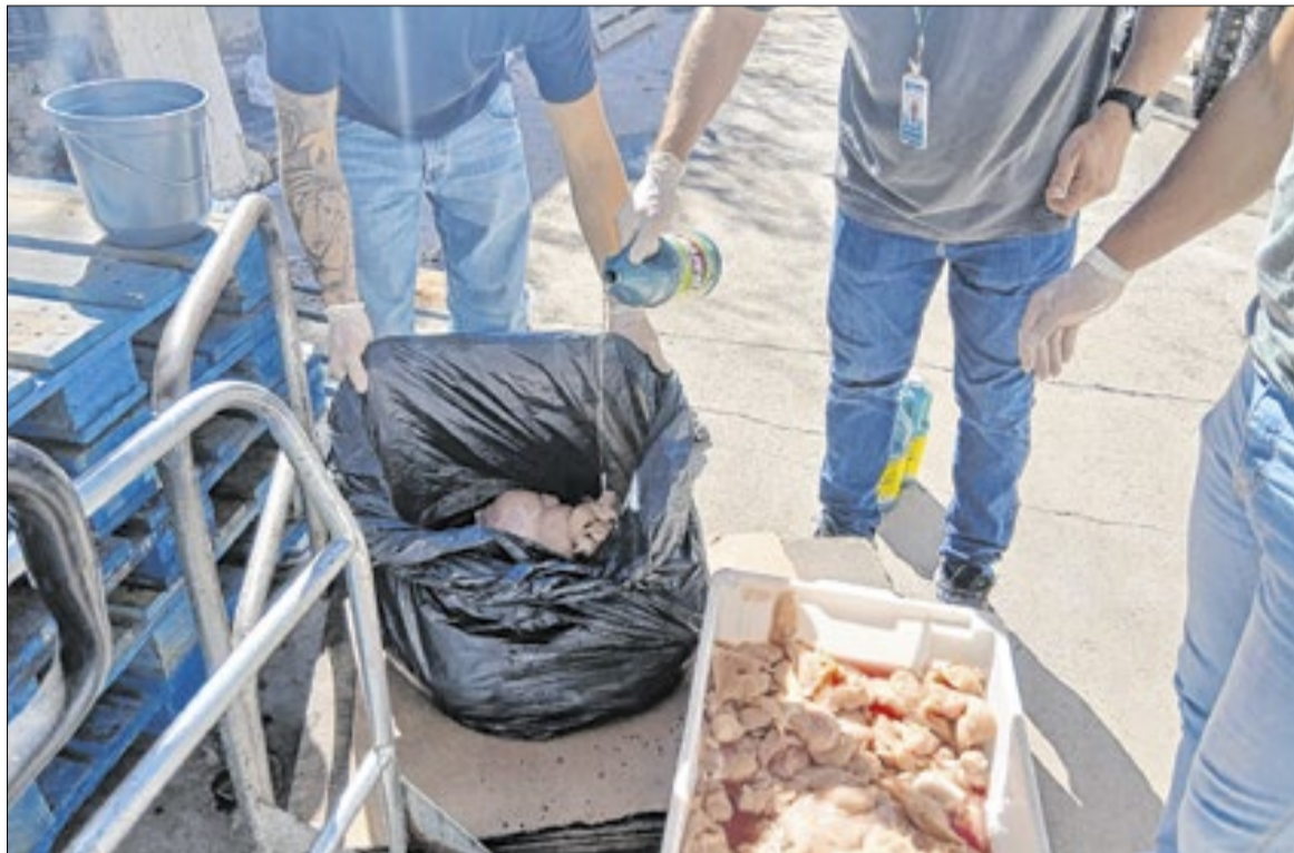
Muitos alimentos foram descartados pelos agentes nas vistorias

Durante as fiscalizações, produtos considerados impróprios para o consumo estão sendo recolhidos e inutilizados. Entre as irregularidades encontradas estão alimentos com prazo de validade vencido e itens que apresentavam alterações em suas características organolépticas — como cor, odor, sabor, aparência e textura — fatores que podem indicar comprometimento da