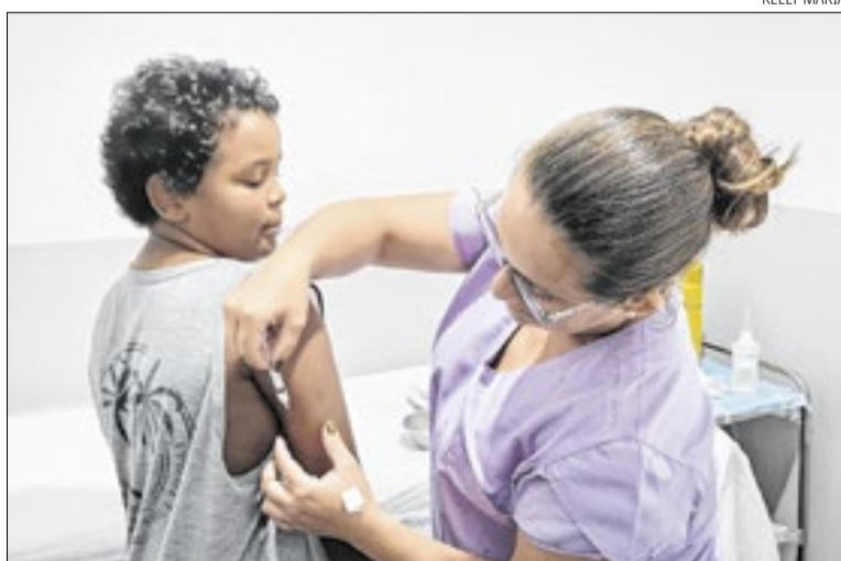
Crianças não vacinadas podem receber dose única

O subsecretário de Vigilância em Saúde, o infectologista Rodrigo Carneiro, destaca a relevância da vacinação contra o HPV e o papel fundamental da imunização na prevenção do câncer de colo