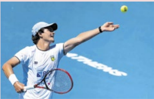
João Fonseca segue se destacando no mundo do Tênis