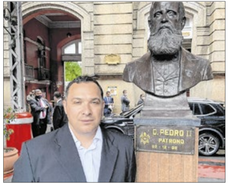
Portal apresenta divergência entre R$ 3.750 e R$ 5.250

A meta do Ministério da Saúde é vacinar 90% do público-alvo contra o HPV. Em Petrópolis, a cobertura vacinal atingiu esse índice nas seguintes faixas etárias: crianças nascidas em 2014, com cobertura de 96,2%; nascidas em 2013, com 93,16%; e nascidas em 2012, com 96,39%. A cobertura para crianças nascidas em 2015 está próxima da meta, com cobertura de 89,13%.