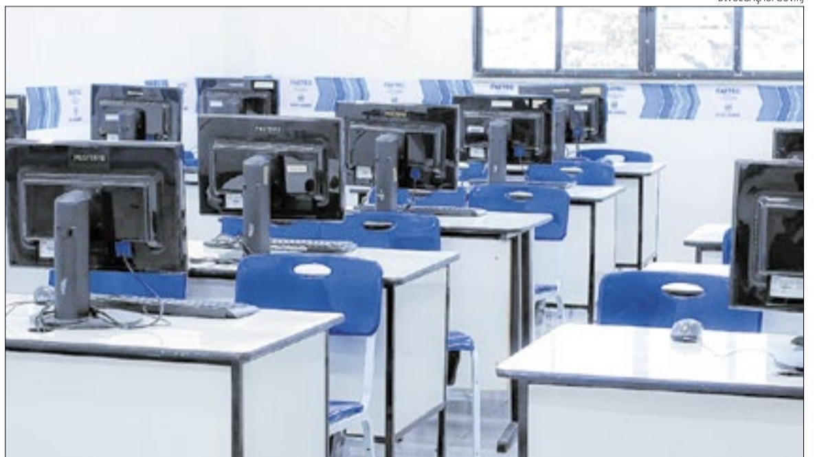
São quase 4 mil vagas gratuitas para cursos de qualificação profissional

A relação completa de cursos, unidades participantes e demais informações sobre o processo de inscrição está disponível no site da Faetec: www.faetec.rj.gov.br .