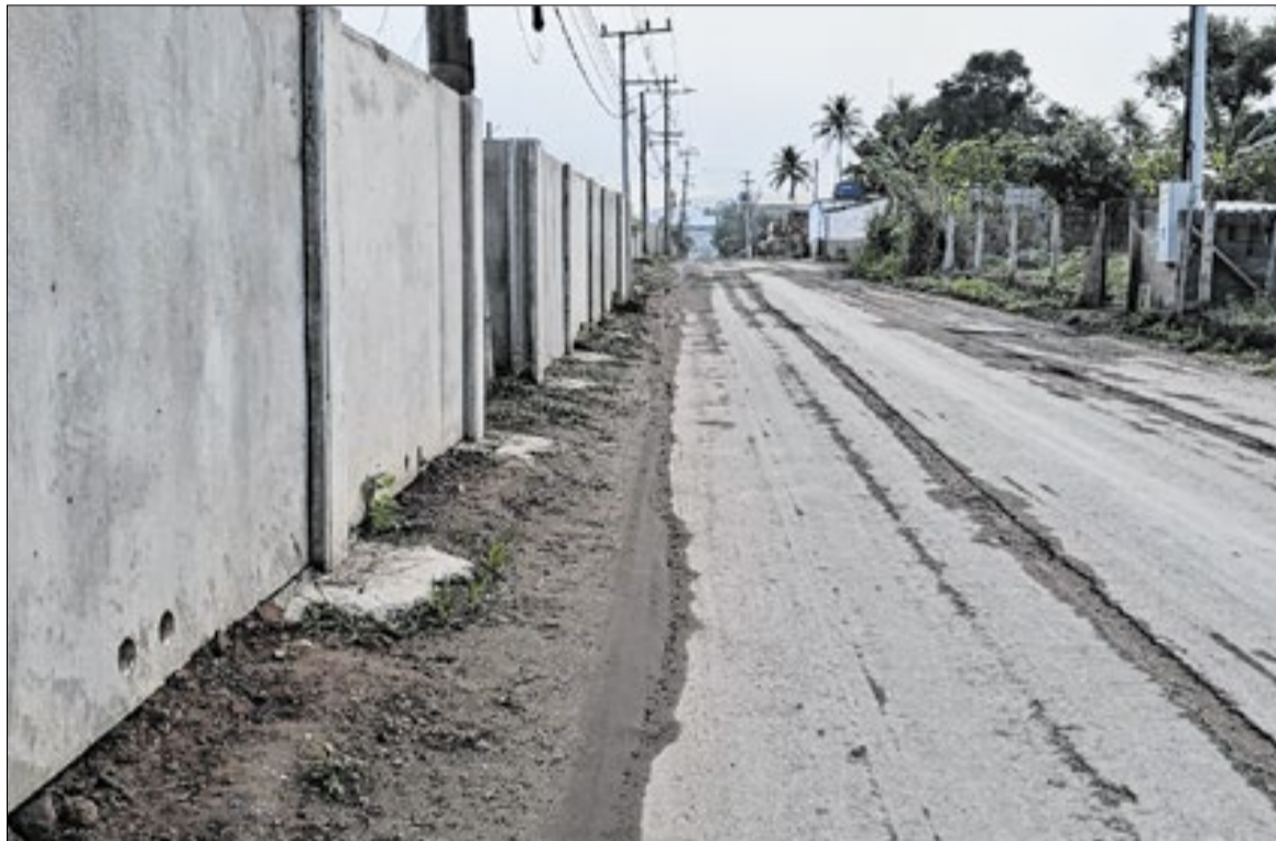
Entre as reivindicações feitas a concessionária está a substituição do muro integral de concreto por modelo misto