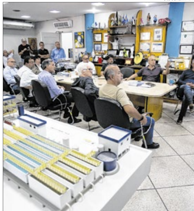
Maquete similar à estação foi apresentada nesta quarta-feira (01)