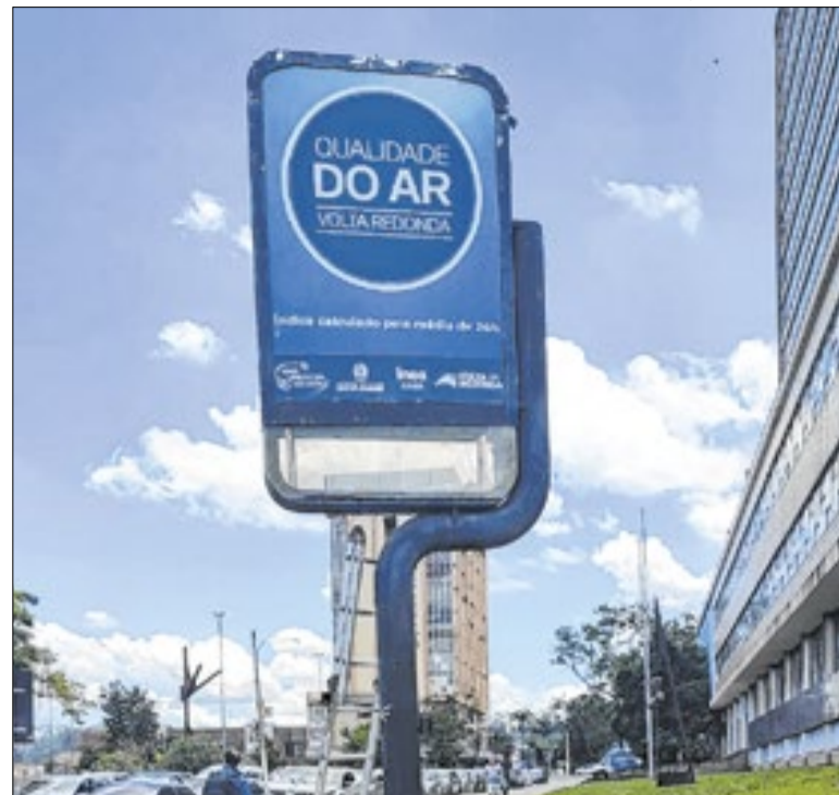
Inea apontou pendências na rede de monitoramento da qualidade do ar