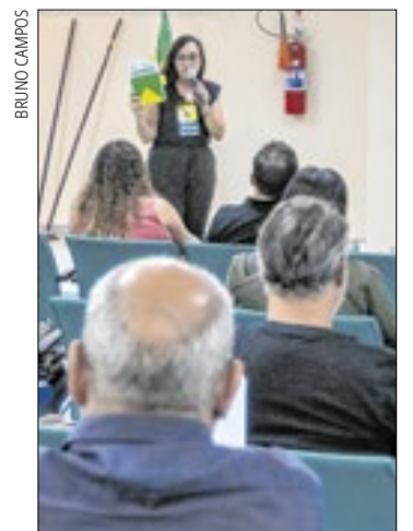
Audiências acontecem com a população em locais públicos

A construção técnica do novo Plano Diretor é respaldada por 12 Câmaras Técnicas, compostas por especialistas da administração pública e representantes da sociedade civil com atuação em áreas estratégicas, como urbanismo, meio ambiente, mobilidade urbana e habitação.