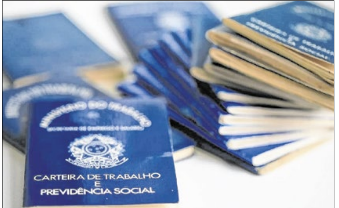
Vagas formais estão distribuídas nas regiões Metropolitana, Serrana e Médio Paraíba

De acordo com o Observatório do Trabalho da Secretaria de Estado de Trabalho e Renda, as vagas de emprego formal disponibilizadas estão distribuídas pelo setor de Serviços (69,8%) e Comér-