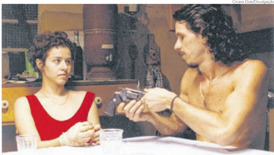
Projeção da versão restaurada de 'Um Céu De Estrelas' reacendeu debates políticos da Retomada

casinha onde ela vive com a mãe. Em poucas horas, explode o ódio, em sua vertente mais sexista. Pavimentada num texto literário de Fernando Bonassi, Tata registra aquele lar como um microcosmos de desajustes que fervem até estourar aos olhos de uma mídia que canibaliza tragédias.