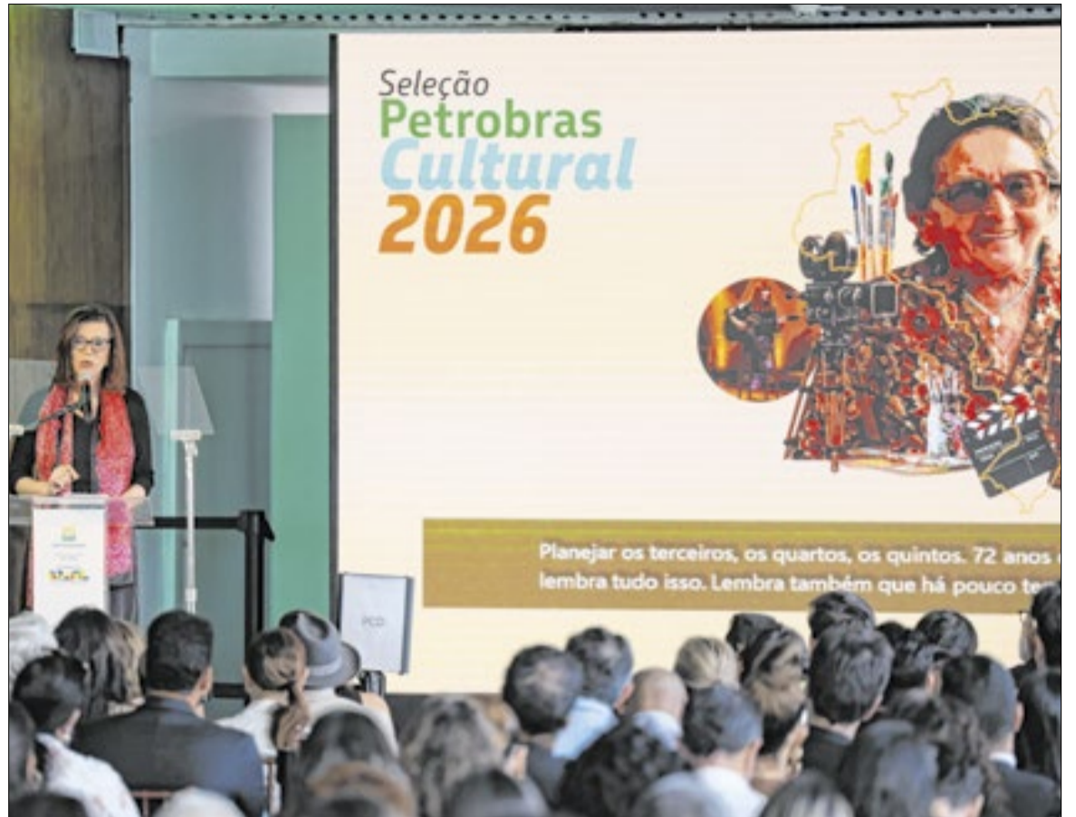
A presidente da Petrobras, Magda Chambriard esteve no lançamento da Seleção Pública Petrobras Cultural 2026

O preço do barril de petróleo tipo Brent (referência internacional) voltou a ser negociado na casa dos US$ 70, cotação em linha com o período pré-conflito. Nos momentos mais críticos da guerra, che-