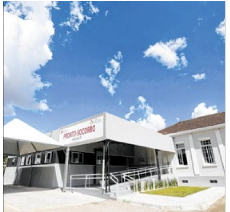
Estado amplia capacidade de atendimento com modernização

O governo do Rio Grande do Sul, por meio da Secretaria de Turismo (Setur), realizou, na quarta-feira (1º), em Capão da Canoa, a liberação da primeira parcela de recursos do Programa Avançar no Turismo para a região do Litoral Norte. O programa está liberando a primeira parcela, de cerca de R$ 6 milhões, de um total de R$ 24,1 milhões.