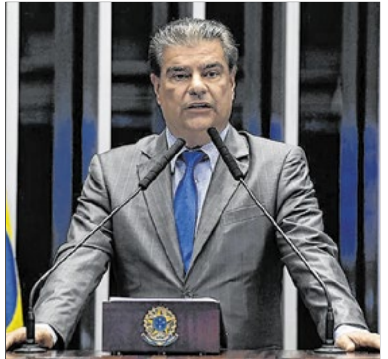
Projeto de Lei é de autoria do senador Nelsinho Trad (PSD-MS)

Os cargos de assessor exonados pela Prefeitura de Palmas estavam distribuídos em áreas como Saúde, Educação e Infraestrutura, após redistribuição da estrutura administrativa deste ano. A medida cumpre recomendação do Ministério Público, que apontou vício de constitucionalidade e pediu a revogação imediata das leis de criação.