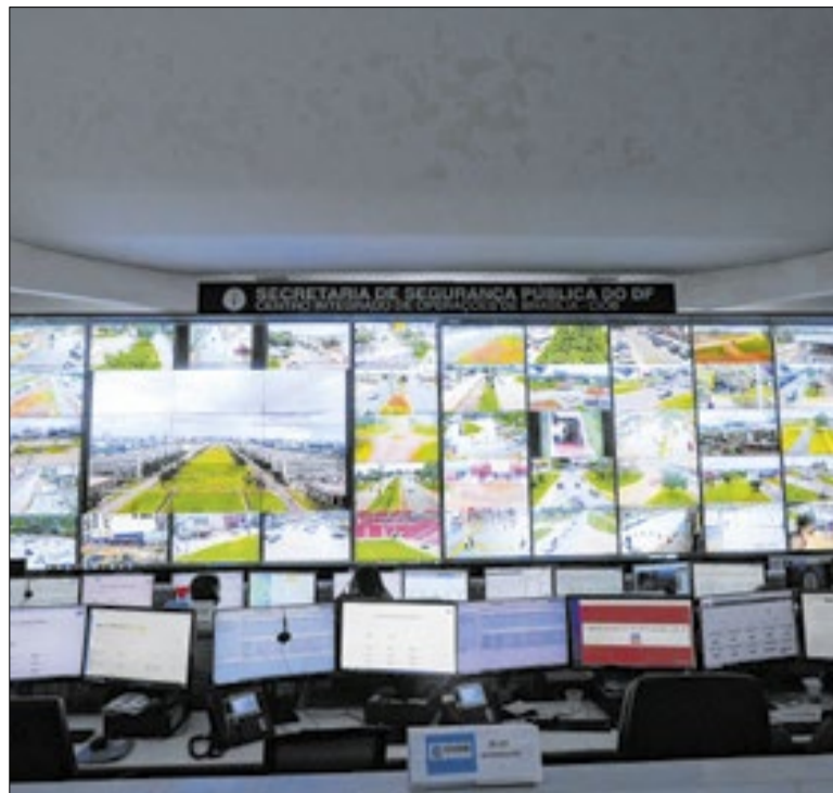
Monitoramento é realizado de forma integrada entre as forças de segurança

A Secretaria de Estado da Cidadania do Mato Grosso do Sul promoverá os workshops “Envelhecer é Legal: Estatuto, Idadismo, Violência e Controle Social”, para fortalecer políticas públicas para a população idosa por meio do ensino por atores diretos na garantia de direitos. A formação ocorrerá entre 7 de julho e 25 de agosto e será online.