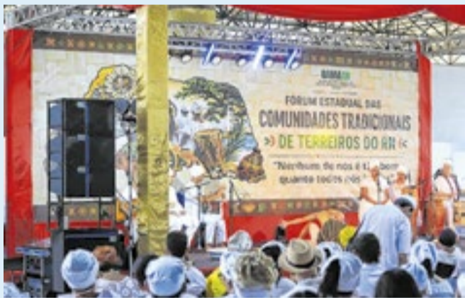
O texto prevê o enfrentamento em ambientes escolares