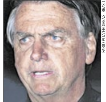
Em depoimento, Jair Bolsonaro afirmou que a pistola havia apresentado problemas

A arma periciada é uma pistola Glock G17 Gen4, calibre 9 mm, acompanhada de um carregador e 30 munições. O material foi apreendido após policiais militares encontrarem o armamento no interior do