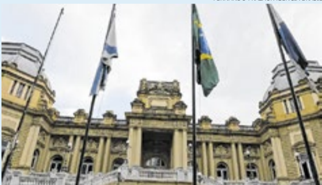
Palácio Guanabara, sede do governo do Rio de Janeiro