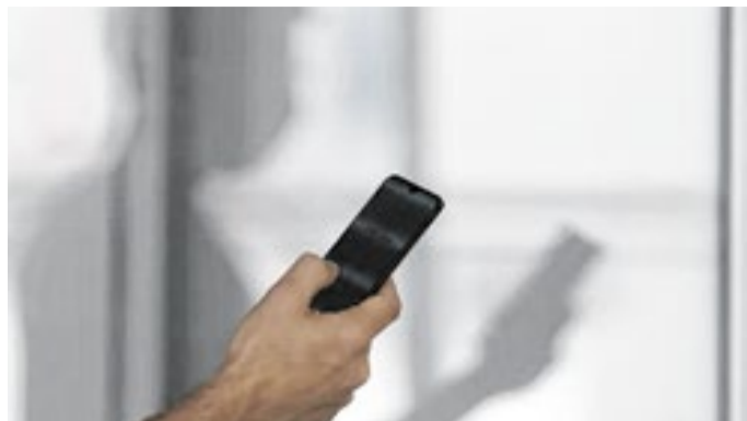
Sistema deve oferecer mecanismos de auto exclusão