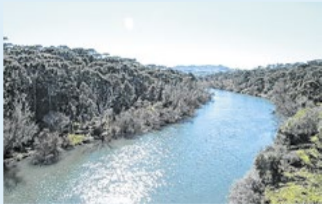
Todos os dados de recursos hídricos estão na plataforma