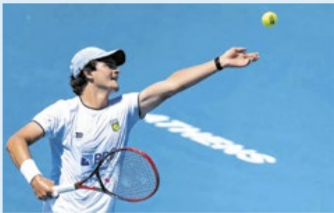
João Fonseca segue se destacando no mundo do Tênis