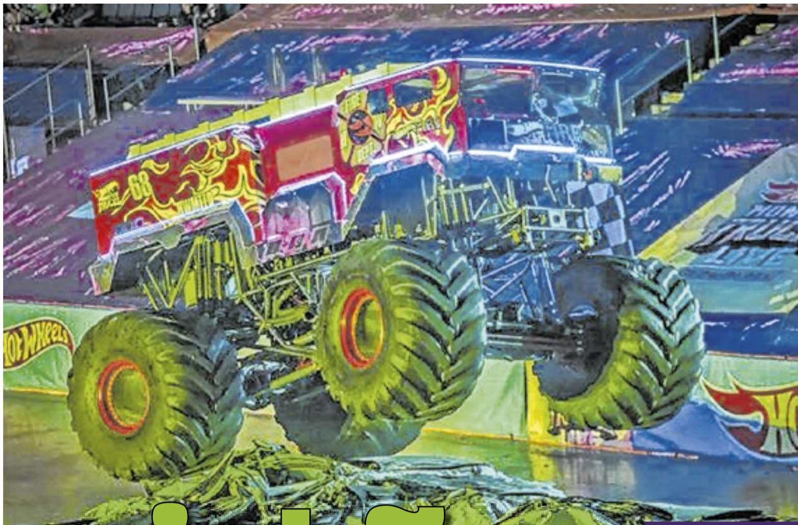
Procura foi tão alta que a Hot Wheels precisou abrir uma nova data. Vendas começam nesta quinta-feira (2).

Intitulado Hot Wheels Monster Trucks Live™: Glow-N-Fire, o evento reúne alguns dos mais famosos e icônicos caminhões monstros da história da categoria, como Mega Wrex, Tiger Shark, Gunkster, Bone Shaker, Bigfoot e Skelesaurus. A etapa do Rio de Janeiro marcará a