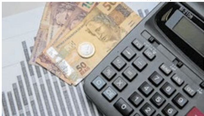
Medida garante manutenção de incentivos tributários até 2026