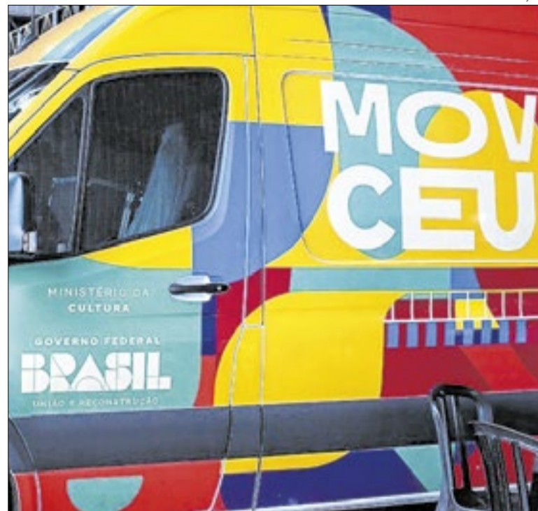
Investimentos implementam também equipamentos culturais itinerantes

A Prefeitura de Niterói iniciou as obras da primeira Unidade Básica de Saúde de Icaraí, instalada em um imóvel desapropriado na Rua Álvares de Azevedo. Com foco na população idosa, a UBS oferecerá geriatria, clínica médica, vacinas e o Programa de Atenção Domiciliar (PAD). O posto deve ser entregue no 2º semestre, atendendo uma região de 100 mil habitantes.