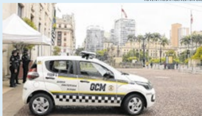
Três dos réus faziam parte da GCM da capital

O MP-SP, por meio do GAECO, obteve a condenação de quatro integrantes de uma organização criminosa que abastecia o mercado ilegal de armas, munições e equipamentos ilícitos na região da cracolândia, na capital paulista. Três dos condenados eram guardas civís metropolitanos e perderam a função pública. As penas variam de 11 a 16 anos de prisão, em regime fechado. Segundo a investigação da Operação Sallus et Dignitas, o grupo atuou entre 2019 e 2023 e também negociava dispositivos para dificultar ações das forças de segurança.