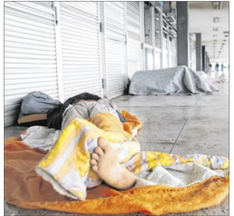
Projeto foi votado antes do recesso parlamentar e gerou uma série de críticas

A unidade, referência nacional no atendimento de fauna silvestre, utiliza procedimentos como cirurgias odontológicas, transfusões e monitoramento comportamental antes da soltura. Casos semelhantes ocorreram em junho de 2024 e dezembro de 2025, quando lobos-guará resgatados foram tratados e liberados em áreas de preservação após longos períodos de recuperação. O processo envolve triagem, tratamento veterinário, readaptação e escolha de local adequado para soltura, garantindo condições de sobrevivência no habitat natural. Com a liberação, o animal encerra o ciclo de atendimento e retorna ao ambiente de origem.