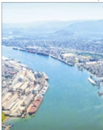
Túnel ligará Santos e Guarujá (SP)

Em março deste ano, o TCU havia determinado, em