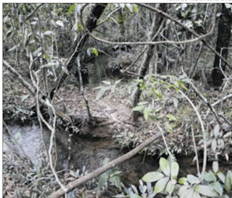
Setor da sociobioeconomia movimenta R$ 2,7 trilhões no Brasil

Para a gestora, embora o setor tenha se expandido e venha se estruturando na forma