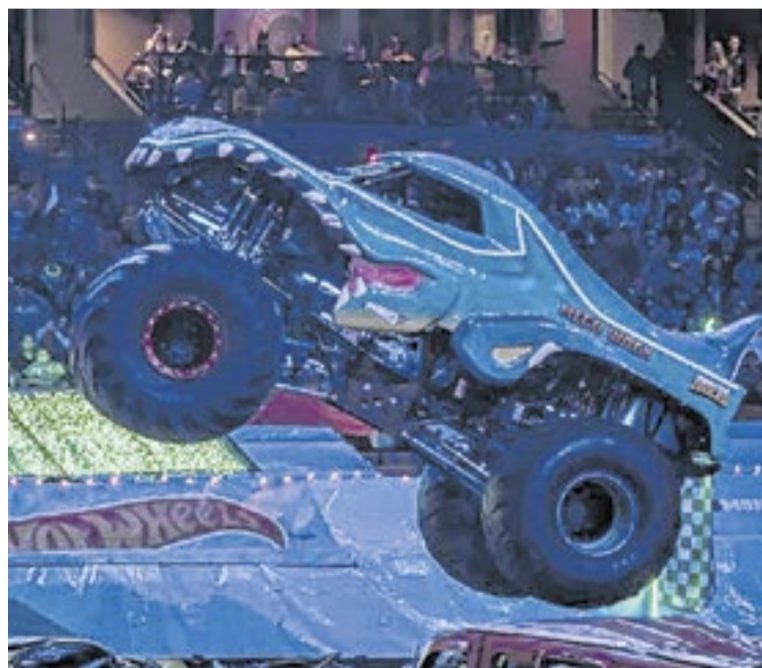
Fenômenos de vendas, as miniaturas da Hot Wheels ganham vida em um espetáculo automobilístico tipicamente americano que agora desembarca no Rio

chega ao Rio de Janeiro em evento oficial da Hot Wheels