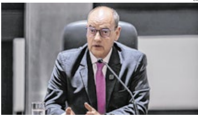
Couto deverá continuar em dupla função até o pleito