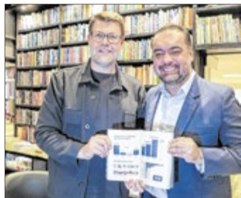
O ex-governador do Rio de Janeiro, Cláudio Castro, ao lado do seu ex-secretário e anfitrião da noite, Gustavo Tutuca