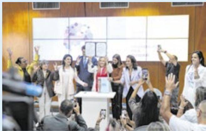
Decretos tornam permanente a ajuda governamental