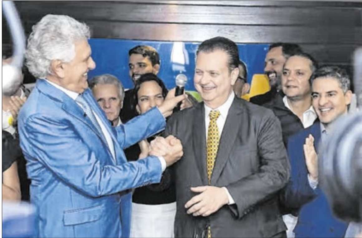
Caiado e Kassab apresentam palanque alternativo à polarização

Finalmente também foi impossível não notar a ausência de alguns expoentes do PSD nas eleições deste ano. Não compareceram à solenidade na qual o presidente do partido, Gilberto Kassab, foi anunciado como candidato a vice-presidente na chapa do ex-governador de Goiás Ronaldo os governadores do partido, como Eduardo Leite, do Rio Grande do Sul, e Ratinho Jr., do Paraná. Também estavam ausentes nomes favoritos a governador que estão mais alinhados a outras candidaturas, como o ex-prefeito do Rio de Janeiro Eduardo Paes.