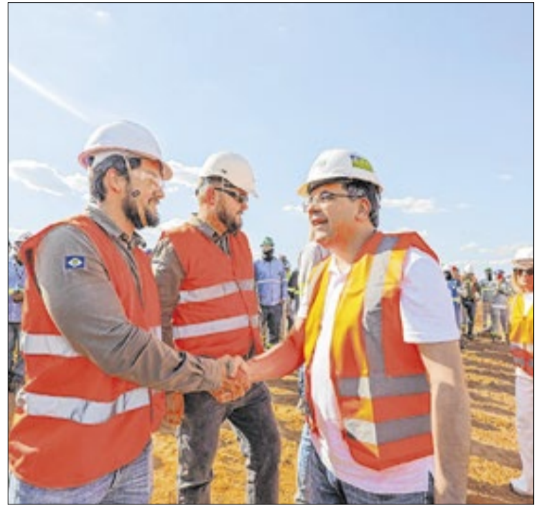
O projeto foi concebido para expansão gradual

O Corpo de Bombeiros Militar de Alagoas participou do 2º Congresso Nacional de Emergências e Segurança Viária. O evento reuniu profissionais para discutir prevenção de acidentes, atendimento de ocorrências e ações voltadas ao trânsito. A participação da corporação teve foco na troca de informações sobre protocolos de resposta.