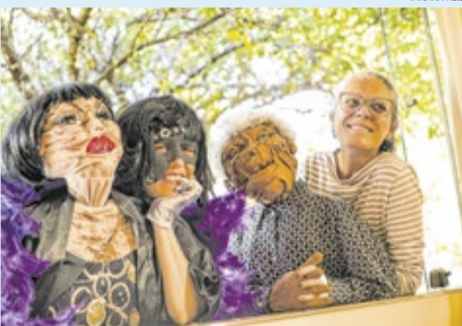
A residência reuniu dez artistas em encontros e imersões