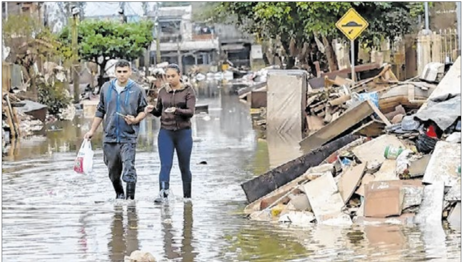
Enchentes provocadas pelo aquecimento e fenômenos como o El Niño aumentam o risco de doenças infecciosas, como a leptospirose

A epidemiologista Ethel Maciel, que acompanhou as discussões sobre saúde na COP30, em