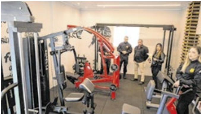
A academia foi entregue nesta quarta-feira