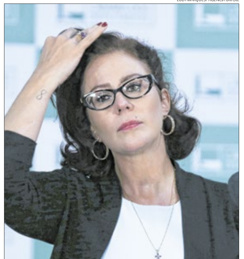
Defesa acredita que Zambelli não será extraditada

Carla Zambelli foi condenada pelo Supremo Tribunal Federal (STF) em dois episódios diferentes. Ela também foi condenada a dez anos de prisão por ser mandante da invasão do sistema do Conselho Nacional de Justiça (CNJ) e ter contratado para isso o hacker Walter Delgatti Neto.