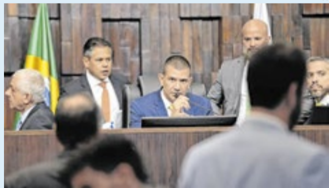
PL cria adicional vinculado ao desempenho de servidores