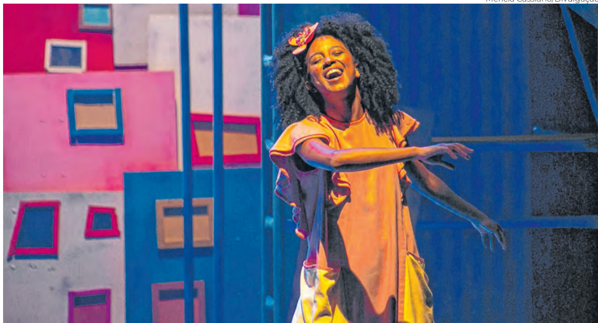
A Menina do Fim do Mundo