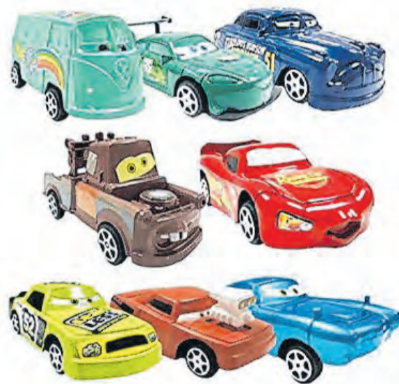
Piloto da Racing Bulls na Fórmula 1, Liam Lawson conta que assistia o filme 'dia sim, dia não'