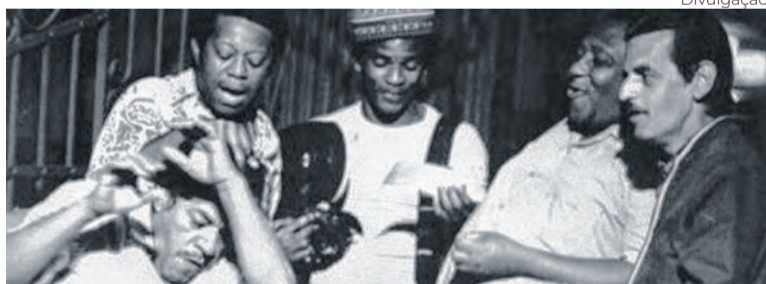
‘Ladrões de Cinema’ (1977), um dos mais exibidos pela TV Brasil