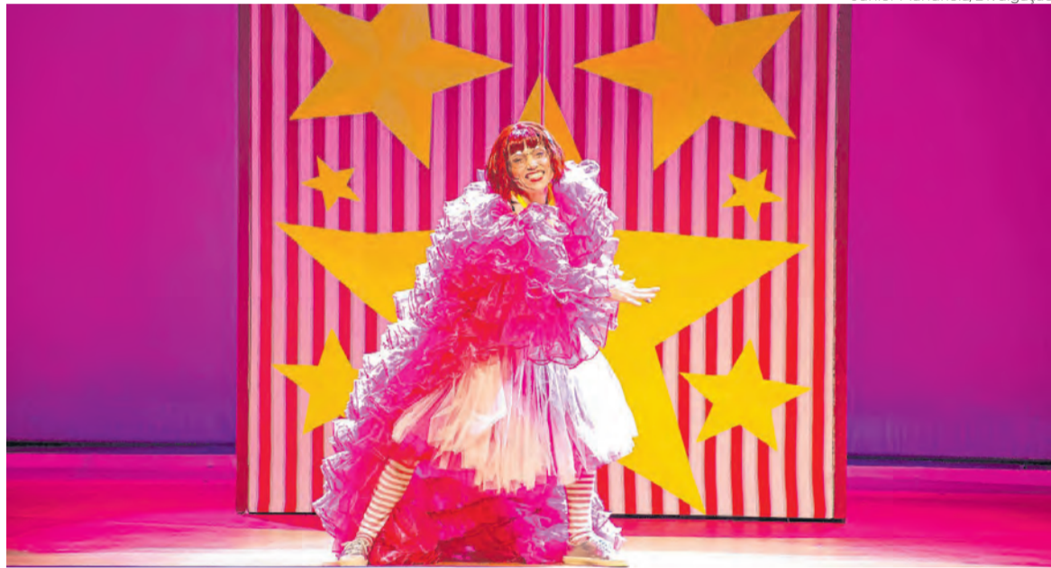
Ritinha Rock Roll