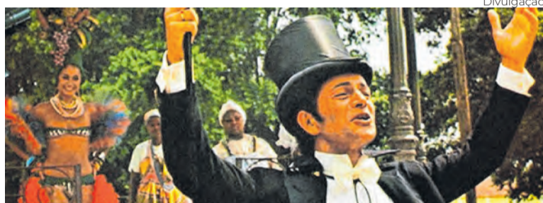
‘O Mágico e o Delegado’ vence o Festival de Brasília de 1983