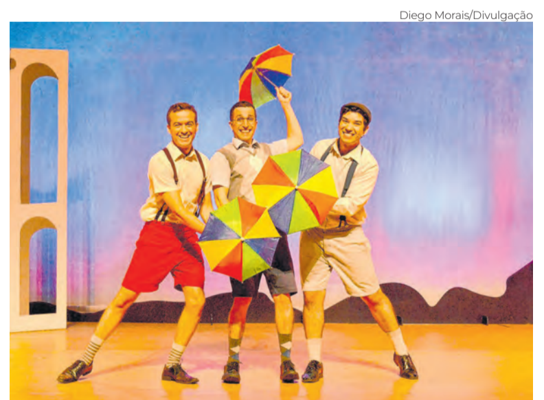
O Menino das Marchinhas