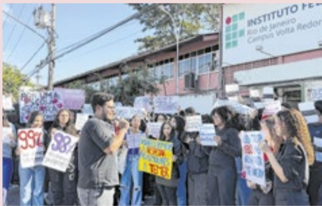
Foi encontrado conteúdo sexual com imagem de alunas

O Grêmio Estudantil informou à redação que, até o momento, foi aplicada uma suspensão preventiva de cinco dias ao acusado, e o caso seguirá em avaliação pela comissão disciplinar da instituição. A equipe do grêmio defende que a atitude do estudante deveria ser passível de expulsão. “Não podemos manter o aluno na mesma sala das vítimas, não é seguro para elas conviver no mesmo ambiente de uma pessoa que tenha cometido tais atos”.