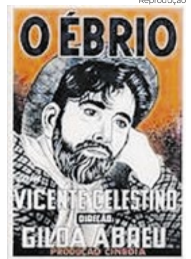
O cartaz original de 'O Ébrio' (1946)