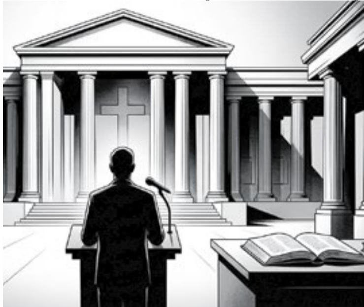
Imagem criada com a IA Gemini Flash Image