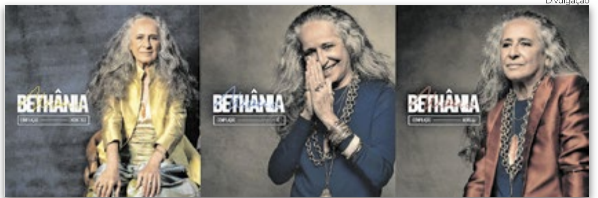
Capas das três coletâneas de Maria Bethânia