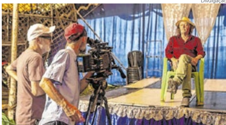
‘Vivo 76’ abriu a edição carioca do É Tudo Verdade e faz sucesso em Minas com olhar de Lírio Ferreira sobre Alceu Valença

ra. Uma série de canções compostas por ele, inspiradas em histórias reais, revelam o soul romântico de um dos maiores compositores da nossa música popular. A formação e o trajeto