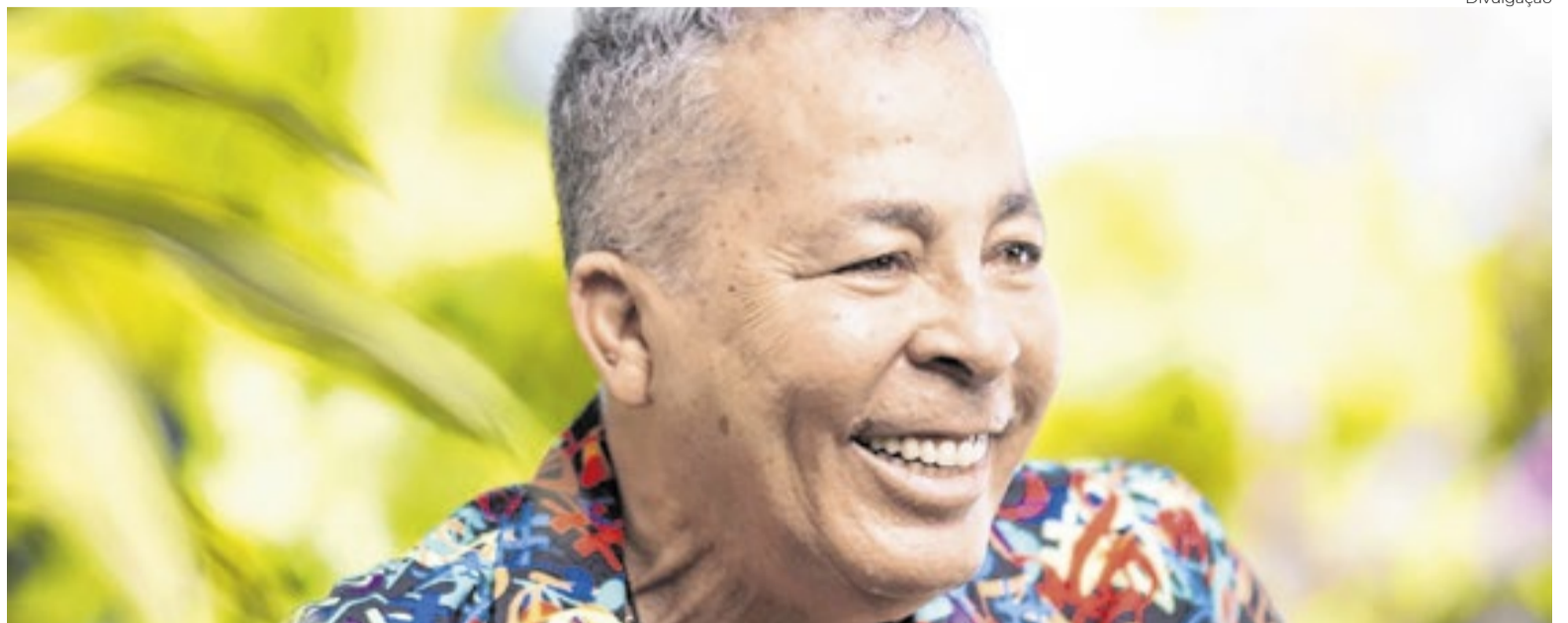
Os 50 anos de carreira de Hyldon inspiram uma investigação documental musical

A frequência alta (e autoral) de documentários musicais do Brasil segue viva na programação da CineOP, que escala produção sobre Hyldon em sua reta final, nas Gerais