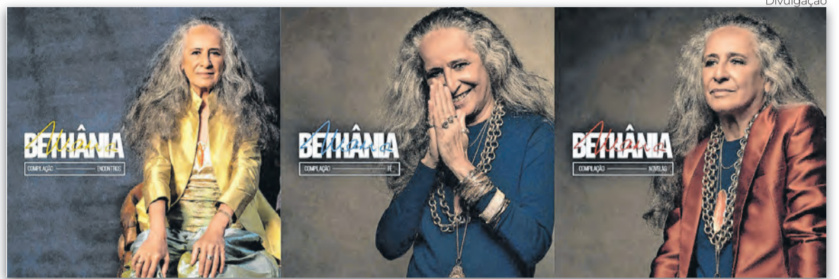
Capas das três coletâneas de Maria Bethânia