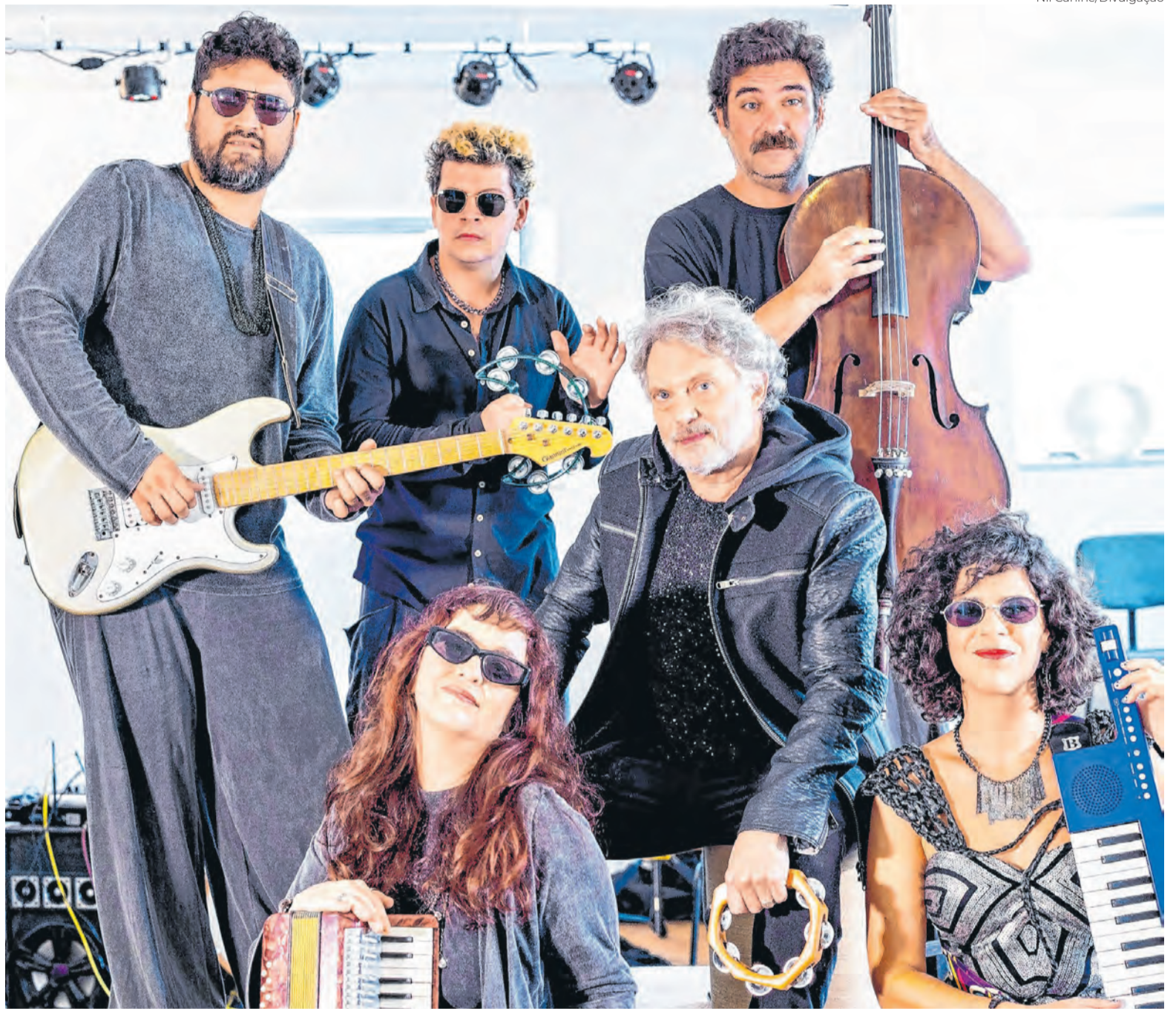
‘Apocalip-se’ propõe uma reflexão sobre o preço da hiperconectividade e a necessidade de reconstruir vínculos reais

A dramaturgia nasceu durante o período mais crítico da pandemia e amadureceu ao longo dos últimos anos. “A IA acaba ocupando o lugar