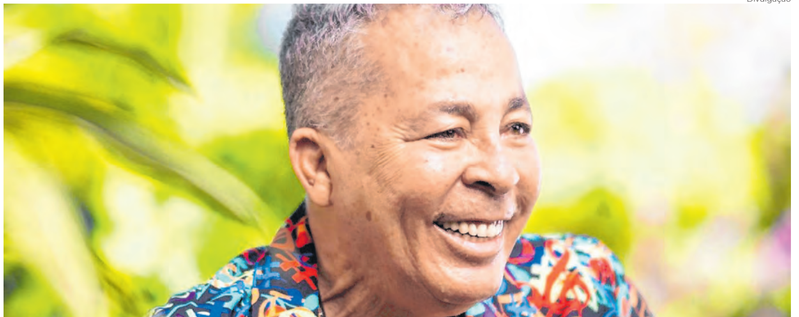
Os 50 anos de carreira de Hyldon inspiram uma investigação documental musical

A frequência alta (e autoral) de documentários musicais do Brasil segue viva na programação da CineOP, que escala produção sobre Hyldon em sua reta final, nas Gerais