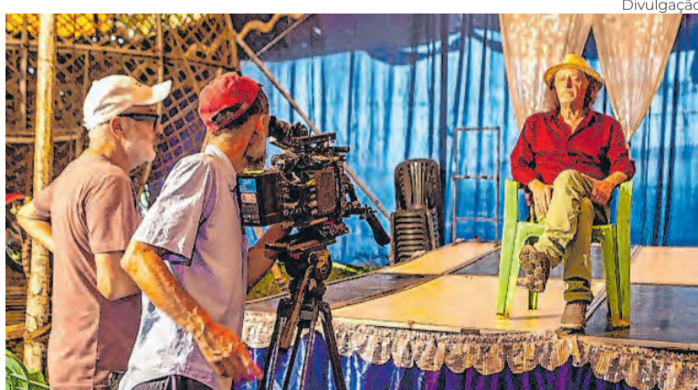
‘Vivo 76’ abriu a edição carioca do É Tudo Verdade e faz sucesso em Minas com olhar de Lírio Ferreira sobre Alceu Valença

ra. Uma série de canções compostas por ele, inspiradas em histórias reais, revelam o soul romântico de um dos maiores compositores da nossa música popular. A formação e o trajeto