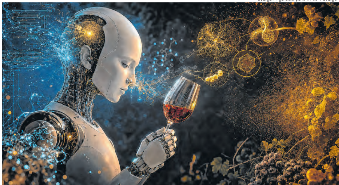
Imagem gerada pela IA GPT Image 2

Especialista britânico Jamie Goode reflete sobre a capacidade (ou não) de agentes de inteligência artificial degustarem um vinho