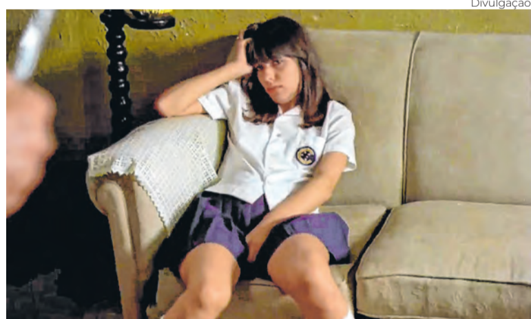
Os Sete Gatinhos