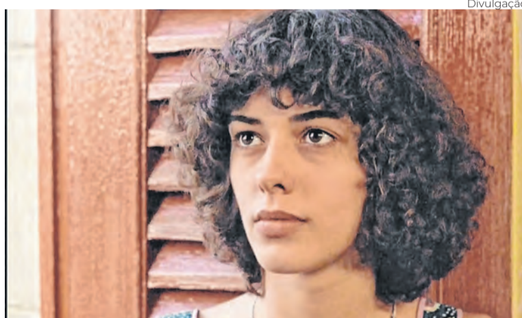
Chuvas de Verão

“Sinto que essas mulheres todas que eu interpretei refletem tanto os diretores com quem trabalhei quanto aspectos meus. Essa é a beleza da atuação. Você vive alguém que não é você, mas empresta parte de si para aquela personagem”