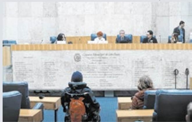
Subcomissão de Calçadas da Câmara ouviu Smul