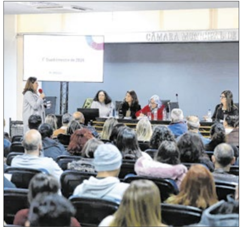
Reunião foi marcada por balanço orçamentário e cobranças na Câmara

A medida prevê cerca de 100 horas de assessoramento, que podem ser ampliadas mediante necessidade, com o objetivo de avaliar o cenário atual do município, identificar oportunidades, organizar informações, aperfeiçoar a gestão e definir ações que sejam capazes de impulsionar o turismo como vetor de desenvolvimento econômico e social.