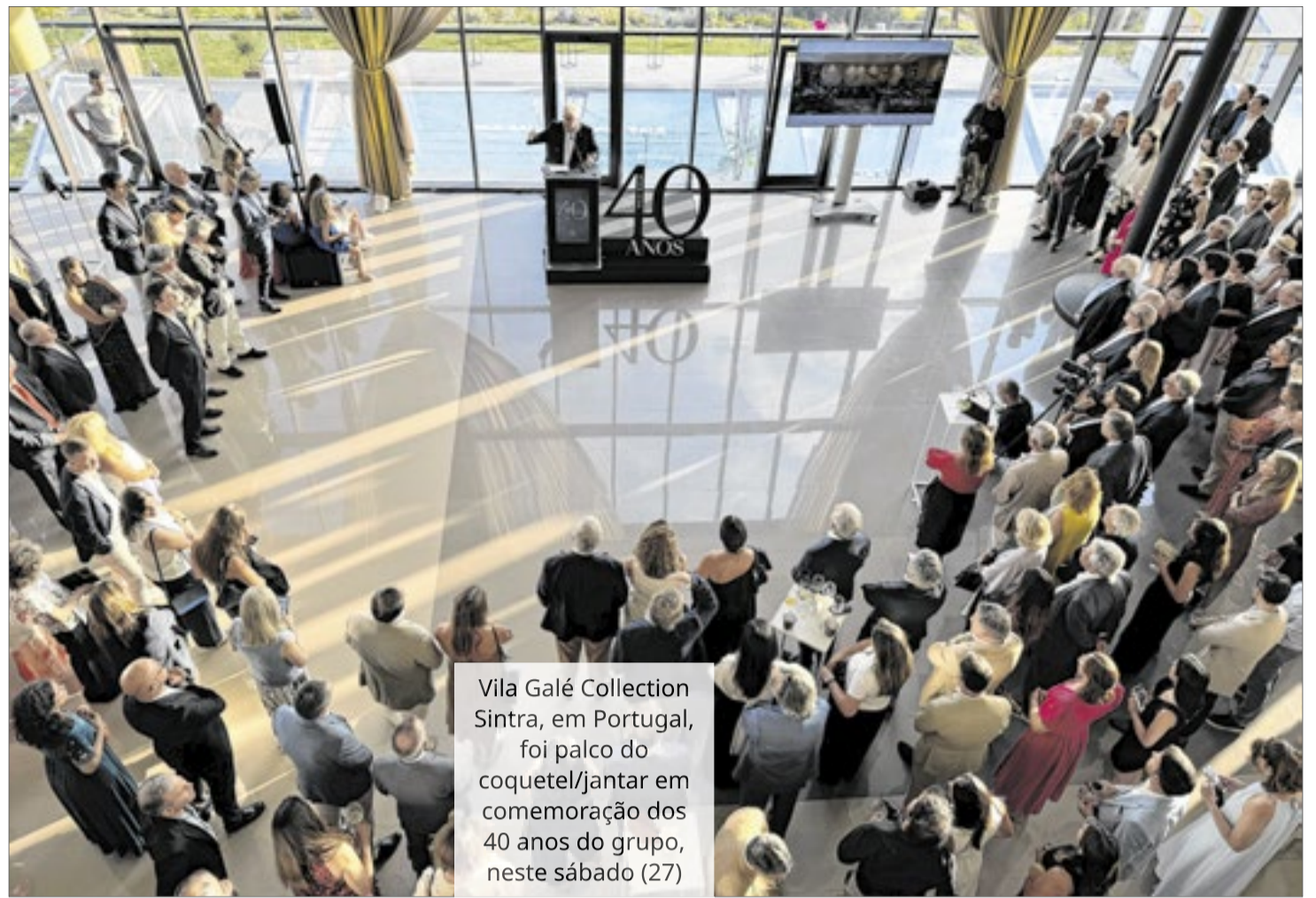
Vila Galé Collection Sintra, em Portugal, foi palco do coquetel/jantar em comemoração dos 40 anos do grupo, neste sábado (27)