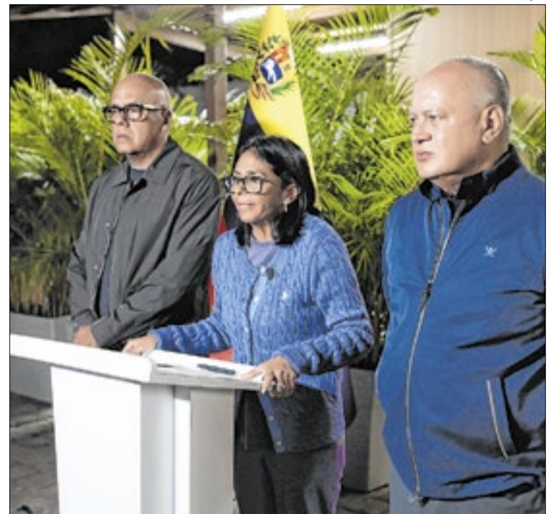
Presidenta Delcy Rodríguez durante coletiva de imprensa

Subiu para 51 o número de portugueses e lusodescendentes mortos nos sismos na Venezuela, segundo o Ministério dos Negócios Estrangeiros. O órgão confirma ainda que não foi possível contactar 84 pessoas. Com o fim da janela de 72 horas de resgate, cresce a preocupação com as vítimas. Cerca de 50 mil seguem desaparecidas.