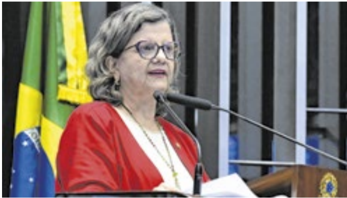
Senadora deverá se reunir com Alcolumbre na quarta