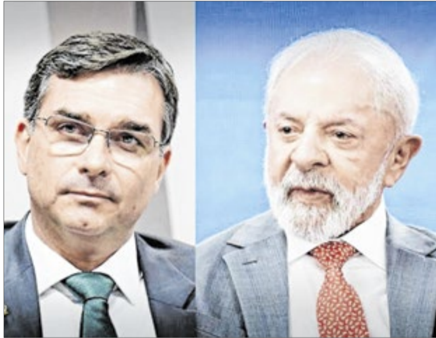
PF acusa Flávio Bolsonaro de cometer crime contra Lula

Os advogados do parlamentar não queriam que apenas Lula fosse ouvido. A estratégia da defesa mirava uma espécie de “internacionalização” do caso, exigindo que a PF colhesse os depoimentos da líder opositora venezuelana María Corina