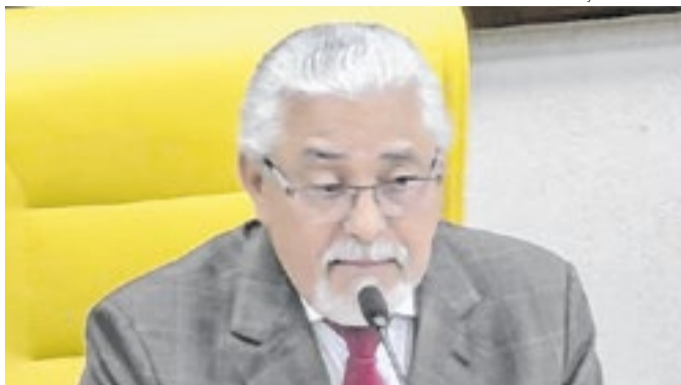
Vereador teve prisão mantida em audiência de custódia