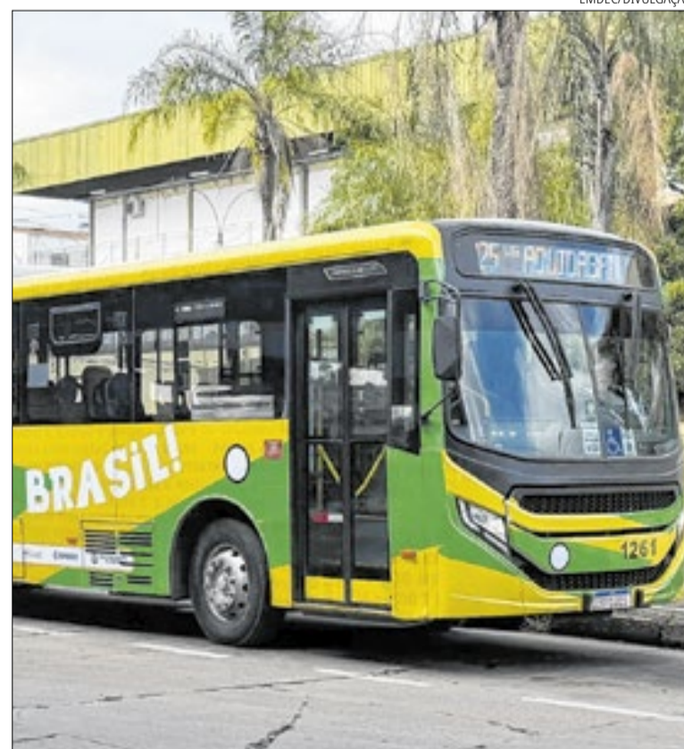
Torcida pelo Hexa: ônibus temáticos conectam usuários à Arena do Torcedor

Os ônibus temáticos receberam identidade alusiva à Seleção: as cores verde e amarela da bandeira brasileira e a torcida pelo Hexa estão presentes.