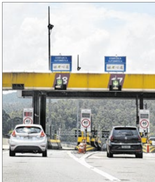
Governo informou que algumas praças no interior terão redução

As tarifas de pedágio nas rodovias concedidas de São Paulo terão reajuste médio de 4,77%, autorizado pela Artesp com base na variação do IPCA. O aumento será aplicado nas principais concessionárias. O Sistema Anchieta-Imigrantes seguirá com a tarifa mais alta do país.