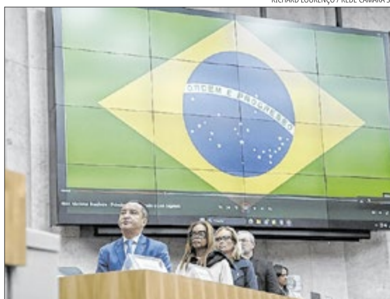
Evento reuniu parlamentares e representantes de organizações da sociedade civil

Os homenageados na cerimônia receberam certificados de reconhecimento pelo engajamento na cidade em projetos que buscam melhorar a qualidade de vida de moradores da capital.