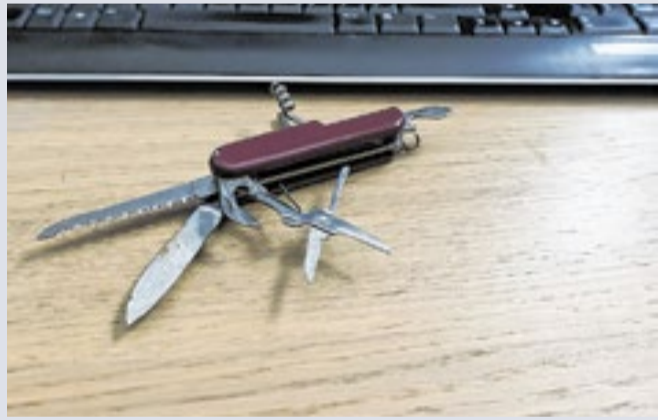
Colega de trabalho ficou revoltado com salários atrasados