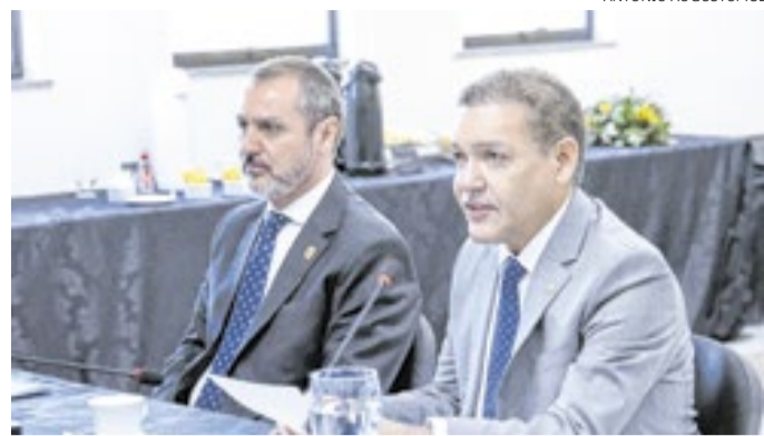
Diretor-geral da PF, Andrei Rodrigues com Presidente do TSE