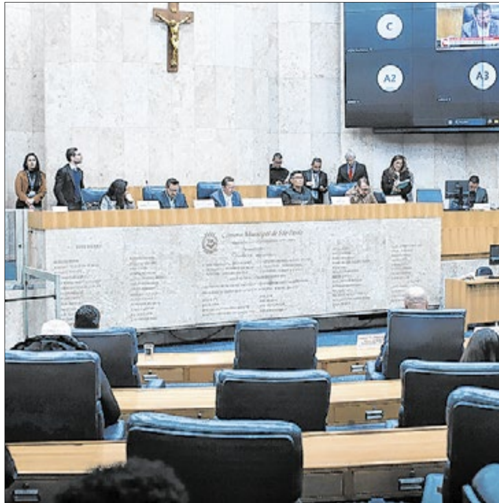
A comissão deverá retomar as oitavas após o recesso parlamentar

Sem a presença dos convidados previstos, a reunião concentrou-se na avaliação do andamento dos trabalhos da comissão e na definição dos próximos passos da investigação. Os parlamentares reafirmaram que a intenção é convocar representantes das empresas com os maiores débitos inscritos