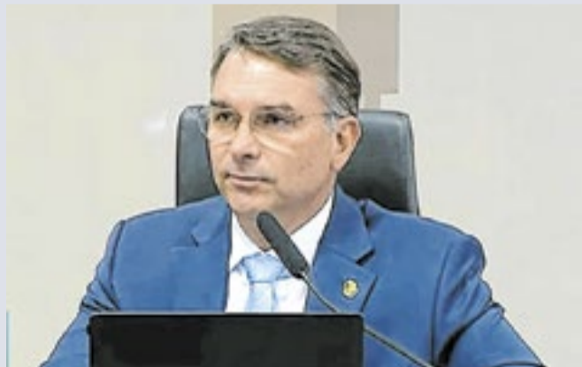
O pré-candidato à Presidência, Flávio Bolsonaro (PL/RJ)