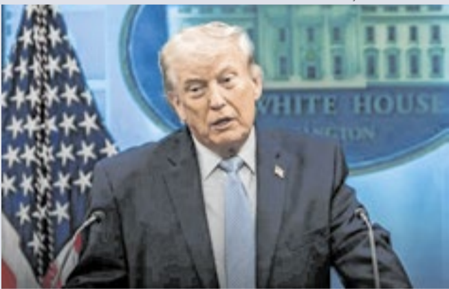
Governo Trump e a política migratória mais rígida nos EUA