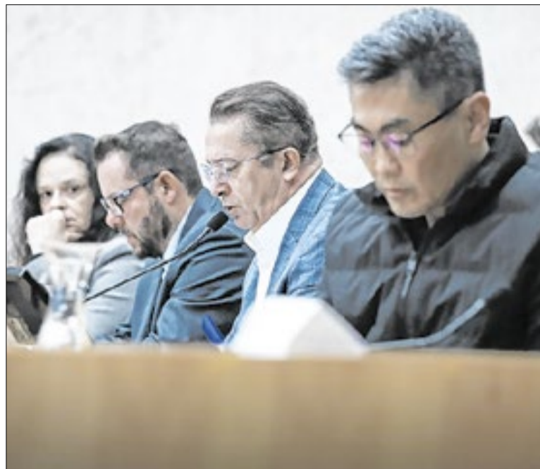
Presidente da CPI, disse que comissão será prorrogada por mais 120 dias

Porém, equipes da companhia acompanharão a movimentação de passageiros em tempo real. Os postos de atendimento da SPTrans nos terminais e no Expresso Tiradentes terão horário diferenciado, enquanto a recarga do Bilhete Único poderá ser feita pelos aplicativos credenciados e validada nas máquinas automáticas ou nos ônibus.