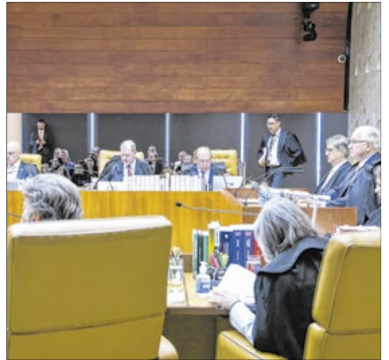
Decisão do STF define o que poderá ou não haver de adicionais

Coordenador de análise fiscal do Centro Celso Furtado, o economista cita, como outro ponto positivo do Propag, o fato de o Estado trocar o pagamento de 1% da dívida por investimento do valor correspondente em educação. Ele critica, porém, a necessidade de contribuir para um fundo de equalização destinado a outros estados.