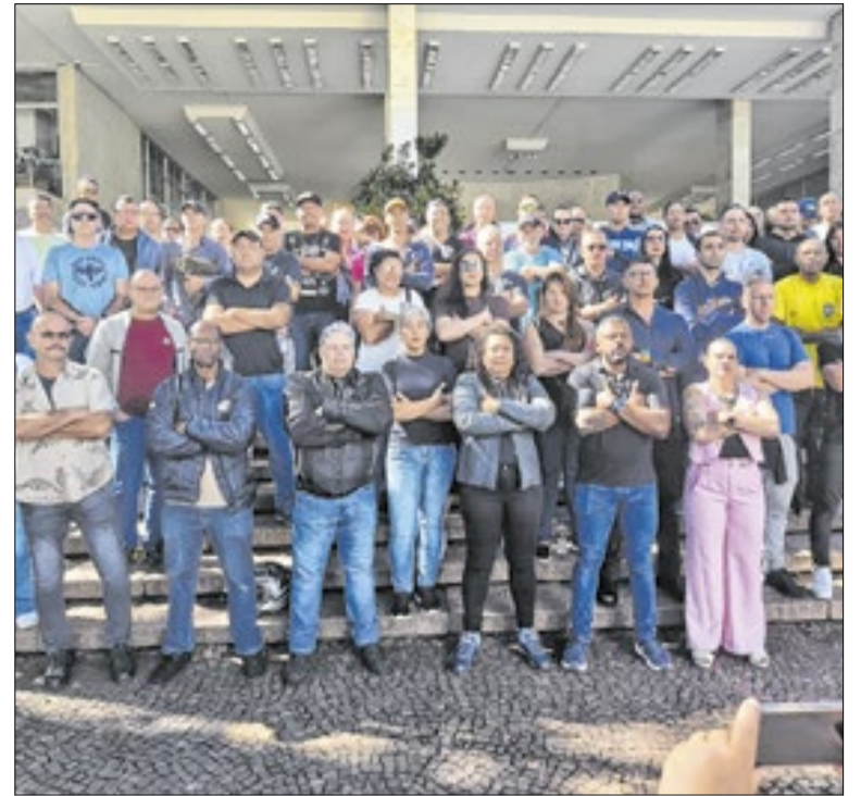
Agentes fizeram um novo protesto pacífico no sábado (27) no Paço Municipal

Espera-se, senhores, que esse tipo de política perdure e se consolide, não sendo apenas um projeto pontual e ‘para inglês ver’. Espera-se que essa gestão de custos eficiente seja de fato efetivada, transformando-se em cultura administrativa real para evitar o desperdício crônico e garantir que cada centavo à ponta do sistema.