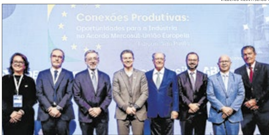
Ferramenta foi lançada pela ApexBrasil em evento em São Paulo

lificação da indústria na exportação direta para mercados de países do bloco. Houve destaque para ferramentas e programas de apoio às empresas exportadoras.