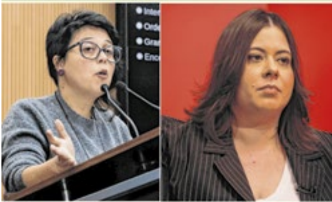
Vereadora e Deputada, ambas do PSOL, apresentaram petição