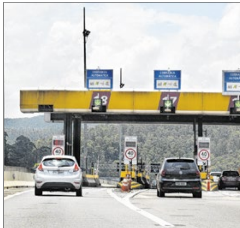
Governo informou que algumas praças no interior do Estado terão redução no valor