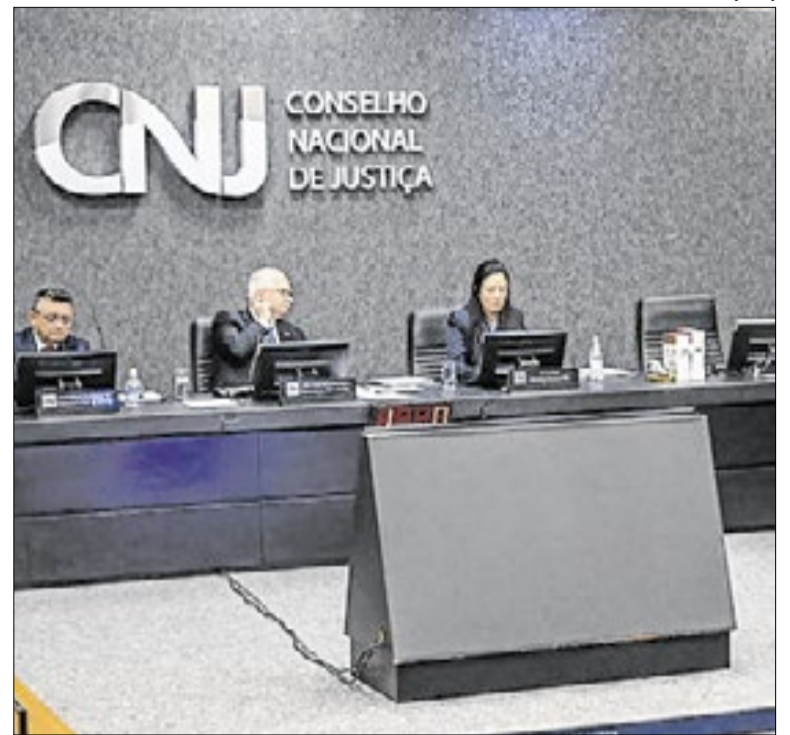
Levantamento é do Conselho Nacional de Justiça (CNJ)

As atividades serão desenvolvidas por uma equipe multidisciplinar da UnB. A iniciativa também inclui capacitação de servidores e estudantes em preservação documental e gestão da memória. Ao fim do projeto, o acervo recuperado ficará disponível ao público, ampliando o acesso a documentos históricos da Justiça do Trabalho e apoiando pesquisas acadêmicas.