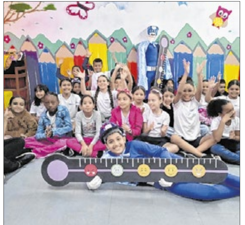
A comemoração foi geral quando a escola foi anunciada como uma das finalistas