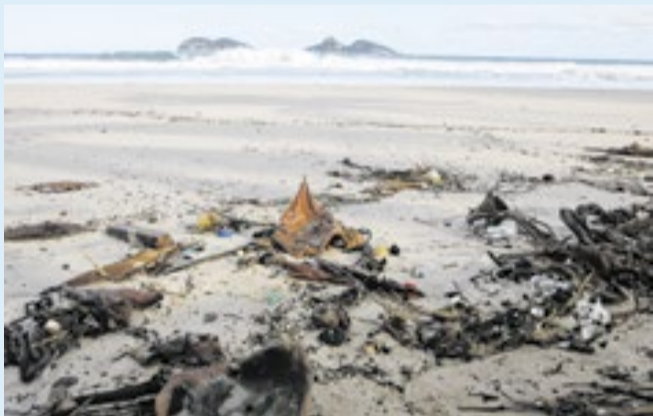
Massa polar irá reduzir temperaturas no Sul do país