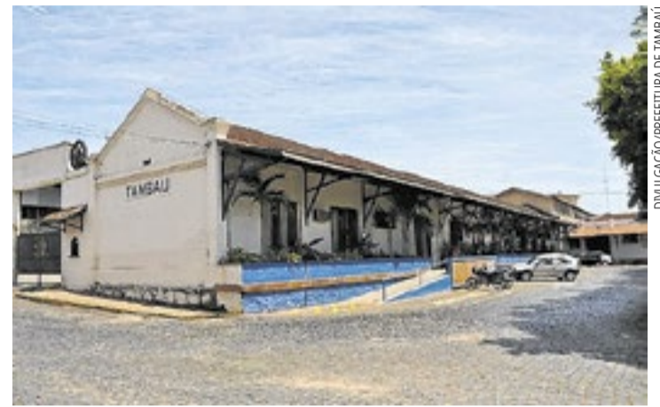
Cidades de São Sebastião, São Roque, São José do Rio Preto e Tambaú credenciaram o Banco Digimais como possibilidade de empréstimos consignados