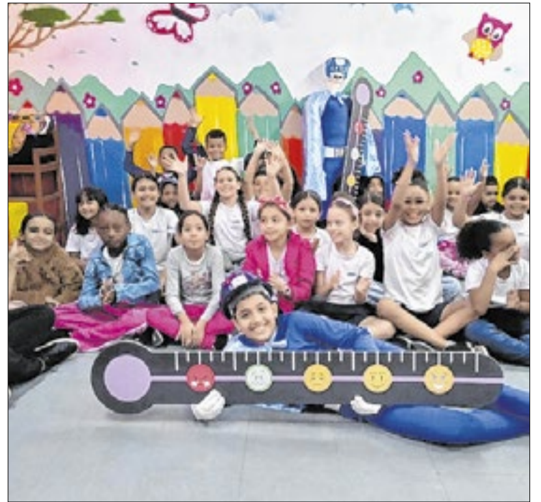
A comemoração foi geral quando a escola foi anunciada como uma das finalistas