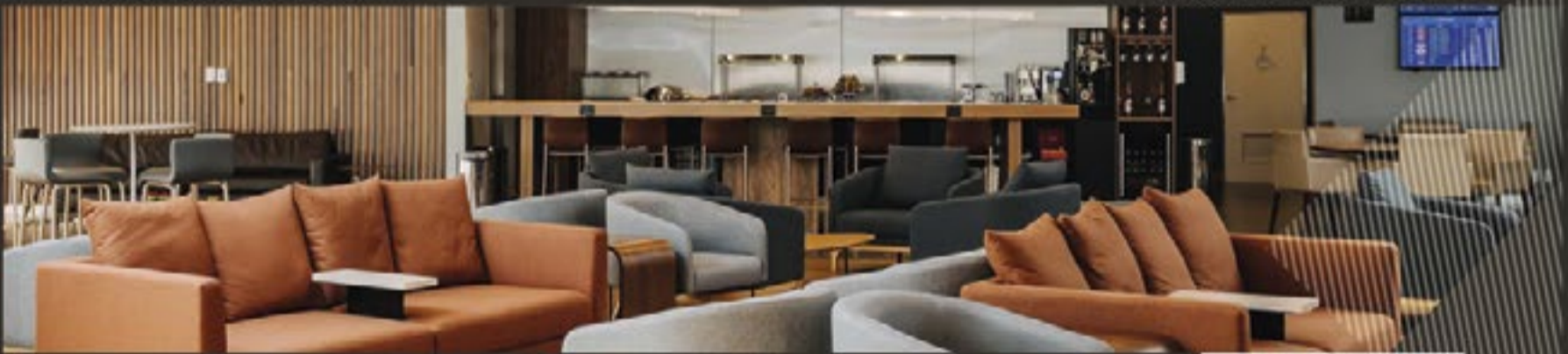
SALA VIP INTERNACIONAL