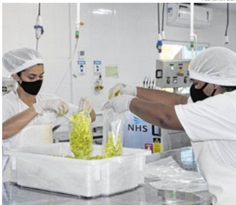
No DF, a fabricação de produtos alimentícios é o maior segmento