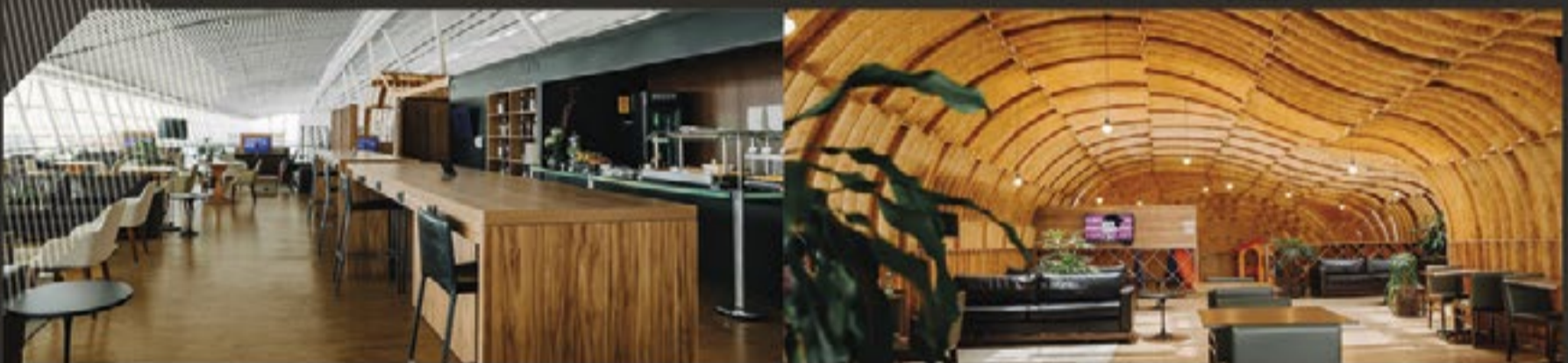
SALA VIP EXPRESS SUL