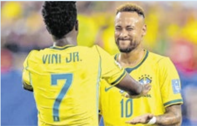
Neymar e Vini Jr., em jogo contra a Escócia