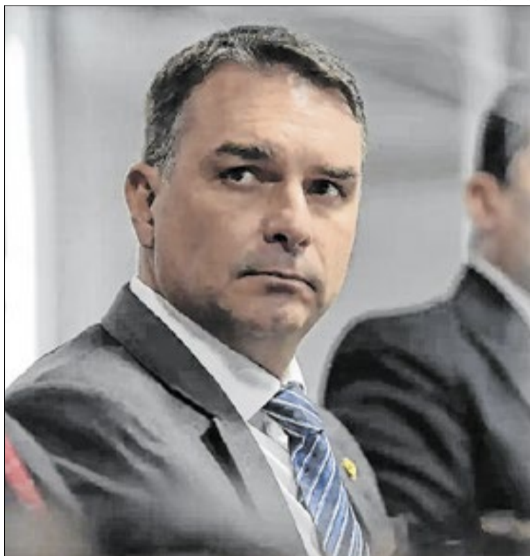
Em declarações nas redes, Flávio e Michele tentam amenizar desentendimentos, mas desgaste foi percebido

A ideia é reforçada diversas vezes. Michelle relata que Bolsonaro lhe pediu para continuar representando o grupo político enquanto permanecia impossibilitado de participar da agenda partidária, afirma que recebeu dele a missão de viajar pelo país e sustenta que decisões tomadas durante esse período tinham sua autorização. Em outro momento, diz