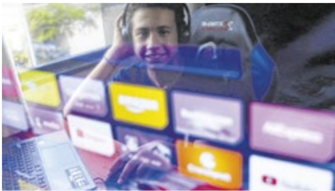
Especialistas elogiam nova regulamentação do ECA Digital