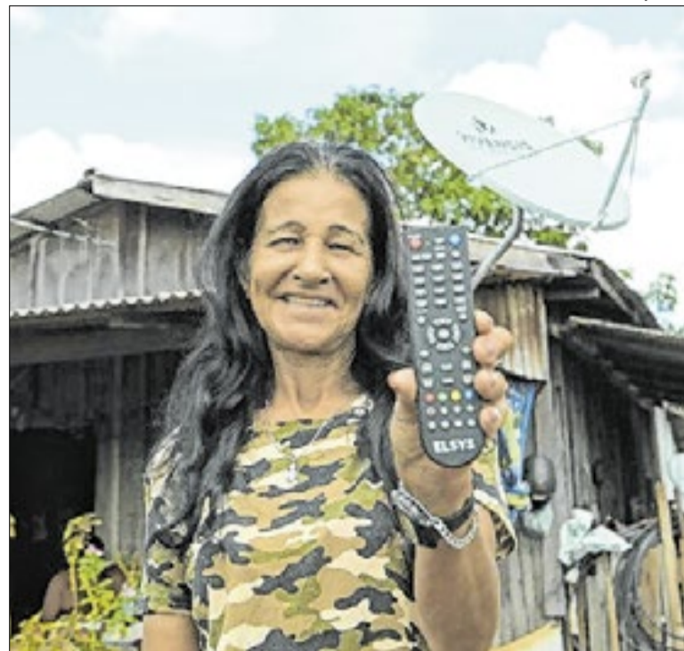
O sinal será liberado em quatro cidades da região Nordeste

A Secretaria da Saúde do Estado da Bahia realizou testes para Infecções Sexualmente Transmissíveis durante ações do São João. Os atendimentos ocorreram em postos montados para oferecer diagnóstico, orientações e encaminhamentos. A iniciativa também incluiu medidas de prevenção e distribuição de insumos.