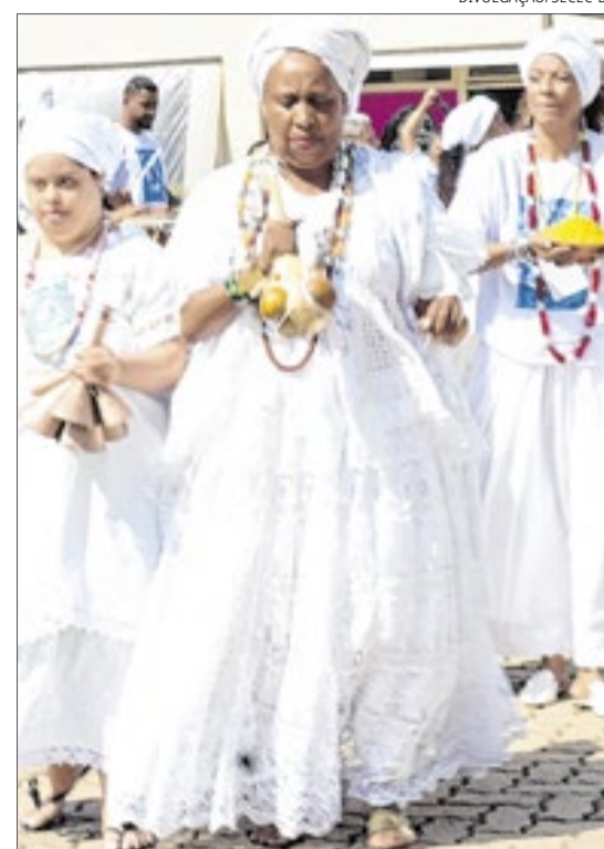
A iniciativa percorreu diferentes regiões do DF; Iniciativa reforça tradições afro-brasileiras e combate à intolerância