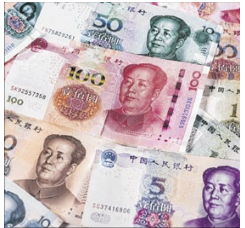
Ministro da Fazenda assinou protocolo em viagem oficial

A corporação informou que estão sendo cumpridos nove mandados de busca e apreensão, incluindo buscas pessoais, nas cidades do Rio de Janeiro e São Paulo. A 10ª Vara Federal Criminal do Rio de Janeiro também determinou o sequestro de bens e valores em nome dos investidos até o limite de R$ 54 bi.