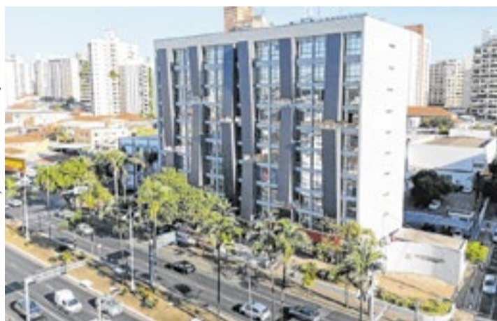
Cidades de São Sebastião, São Roque, São José do Rio Preto e Tambaú credenciaram o Banco Digimais como possibilidade de empréstimos consignados