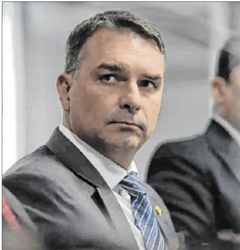
Em declarações nas redes, Flávio e Michele tentam amenizar desentendimentos, mas desgaste foi percebido

A ideia é reforçada diversas vezes. Michelle relata que Bolsonaro lhe pediu para continuar representando o grupo político enquanto permanecia impossibilitado de participar da agenda partidária, afirma que recebeu dele a missão de viajar pelo país e sustenta que decisões tomadas durante esse período tinham sua autorização. Em outro momento, diz