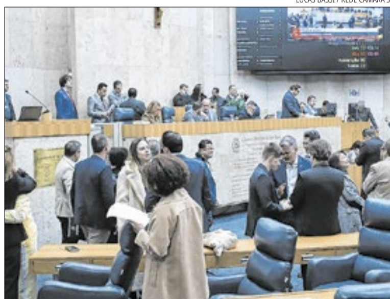
Na votação, bancadas do PSOL e do PT se posicionaram contra o projeto

A LDO é uma das principais peças do planejamento orçamentário do município. A legislação estabelece as diretrizes que deverão orientar a elabo-