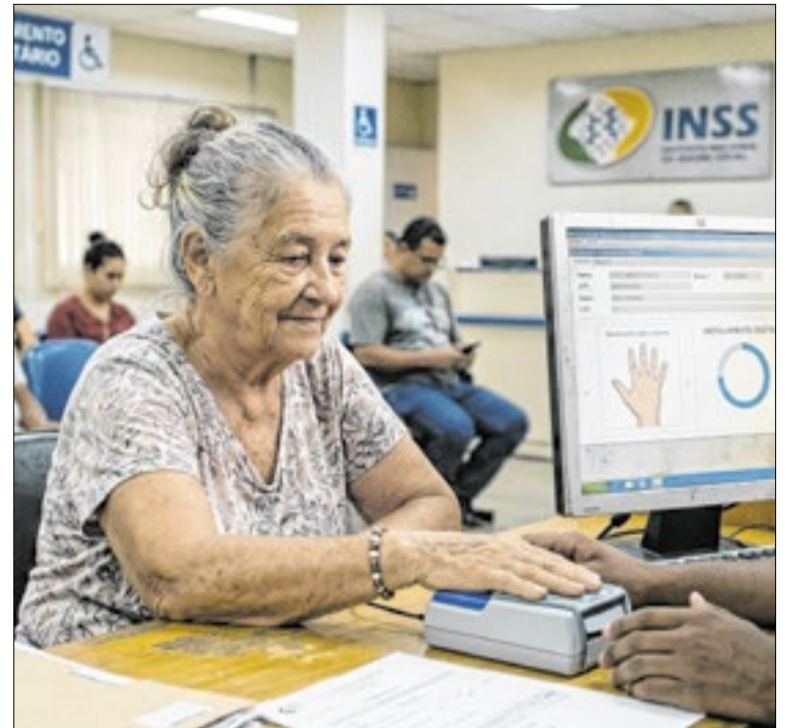
INSS poderá usar dados da CNH, do CIN e da Justiça Eleitoral

O recurso foi movido por uma docente após o Tribunal de Justiça do Distrito Federal vetar o redutor em sua aposentadoria por invalidez. O presidente do STF, ministro Edson Fachin, ressaltou que a decisão regional violou a jurisprudência da Corte ao tentar validar a proibição por meio de uma lei distrital