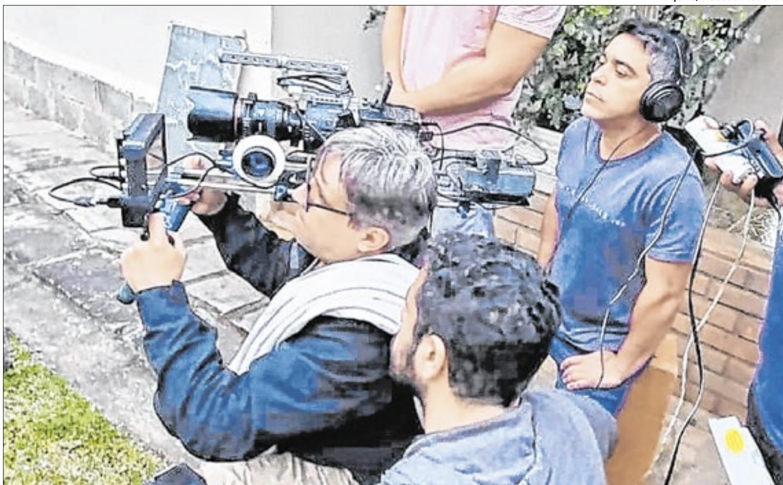
O Brasil registrou, em 2024, o segundo maior crescimento de público nas salas de cinema entre 21 países

Há um ditado que diz a seguinte frase: ‘um povo sem cultura perde a identidade’. E é exatamente isso que o audiovisual nacional quer mostrar ao público. Em 2025, segundo a Agência Nacional do Cinema (Ancine), o setor cinematográfico comemorou não só a trajetória, mas também uma forte recuperação.