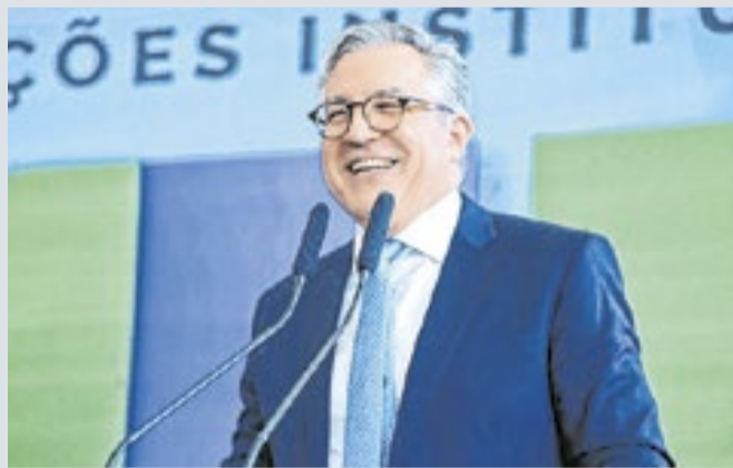
Padilha anunciou assistência para outras áreas

O ministro da Saúde, Alexandre Padilha, lançou em São Paulo a Política Nacional de Atenção Integral à Saúde da População em Situação de Rua. A iniciativa estabelece diretrizes para ampliar o acesso dessa população aos serviços do SUS e prevê a expansão do atendimento por equipes especializadas e unidades móveis. Durante o evento, o governo anunciou o envio de assistência para centenas de municípios.