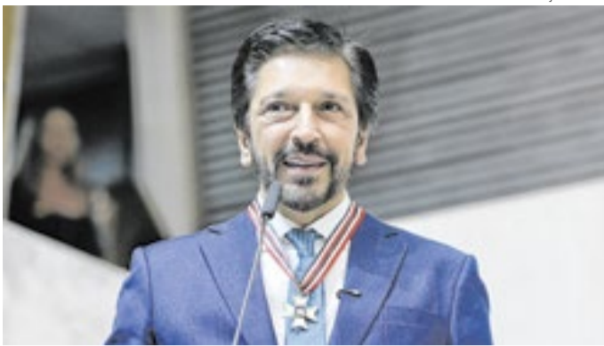
Medida de Nunes é para garantir a continuidade do serviço