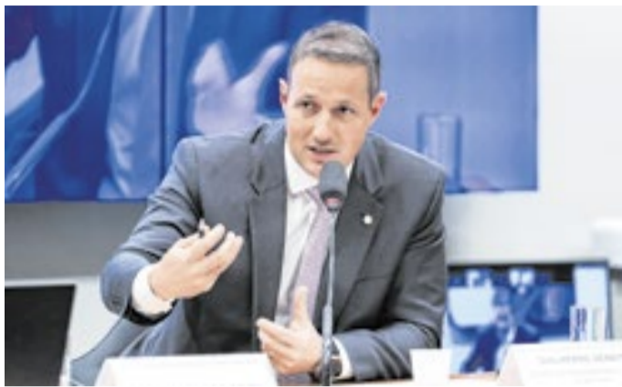
Derrite no debate da Câmara sobre a PEC da Segurança