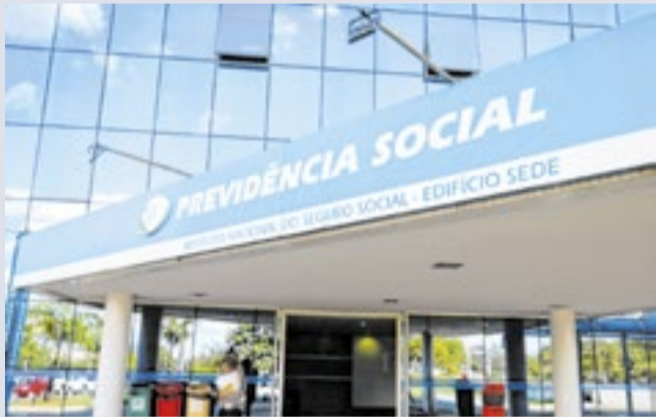
O valor de R$33.763 é pago para três aposentados