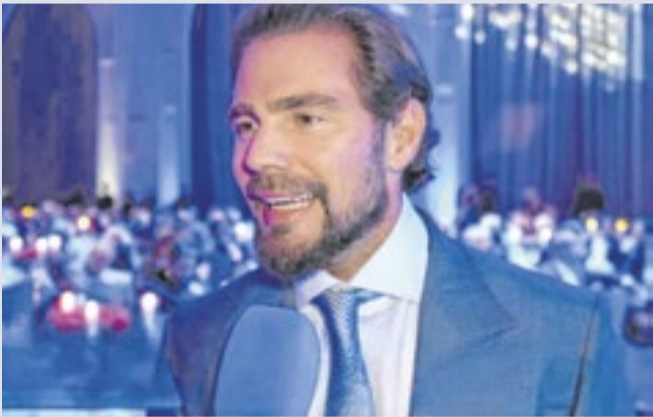
Vorcaro: conversas negadas pelo senador