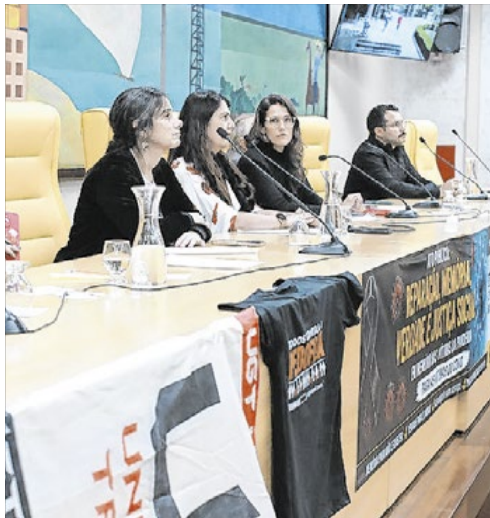
O encontro reuniu integrantes de movimentos ligados à memória das vítimas da pandemia

Durante o ato, foram mencionadas experiências internacionais e discussões em andamento em diferentes esferas do poder público sobre formas de reparação a grupos afetados por eventos de grande impacto social. Os