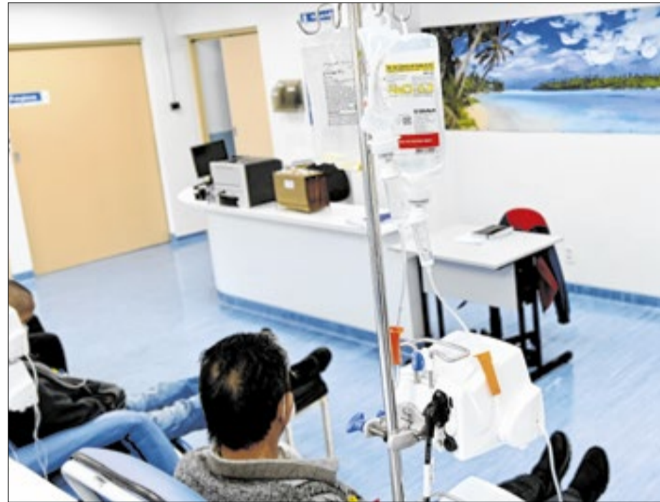
Interior do Hospital Mário Gatti: MP ingressou na Justiça com uma ação civil pública por medidas urgentes para reduzir a fila de cirurgias ortopédicas no SUS

Em reação à iniciativa do Ministério Público, a Prefeitura de Campinas anunciou que vai ingressar com uma ação na Justiça contra o Governo Federal para exigir a atualização da Tabela SUS Nacional. Conduzida pelo prefeito Dário Saadi, a administração municipal alega que Campinas arca sozinha com 71,27% dos recursos aplicados na saúde pública local, enquanto a União contribuiria com apenas 22,04%. O Contraponto: O argumento de subfinanciamento por parte da União é fortemente contestado por dados oficiais. Conforme reportagem do Correio da Manhã, o Ministério da Saúde rebateu as declarações da administração municipal e garantiu que não houve qualquer redução na participação federal.