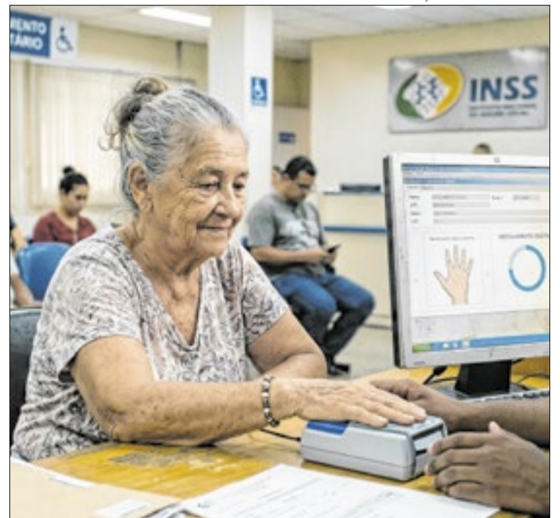
INSS poderá usar dados da CNH, do CIN e da Justiça Eleitoral

O recurso foi movido por uma docente após o Tribunal de Justiça do Distrito Federal vetar o redutor em sua aposentadoria por invalidez. O presidente do STF, ministro Edson Fachin, ressaltou que a decisão regional violou a jurisprudência da Corte ao tentar validar a proibição por meio de uma lei distrital