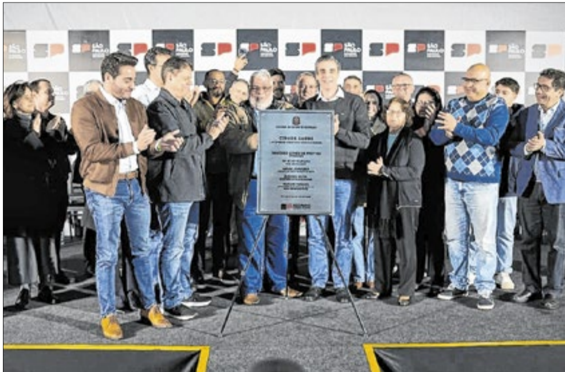
Equipamento passará de 8,6 mil para 13 mil atendimentos mensais, alcançando moradores de 19 municípios

Segundo o governador Tarcísio de Freitas, a proposta do Cidade Saúde é concentrar em um único espaço os principais serviços de saúde do municí-