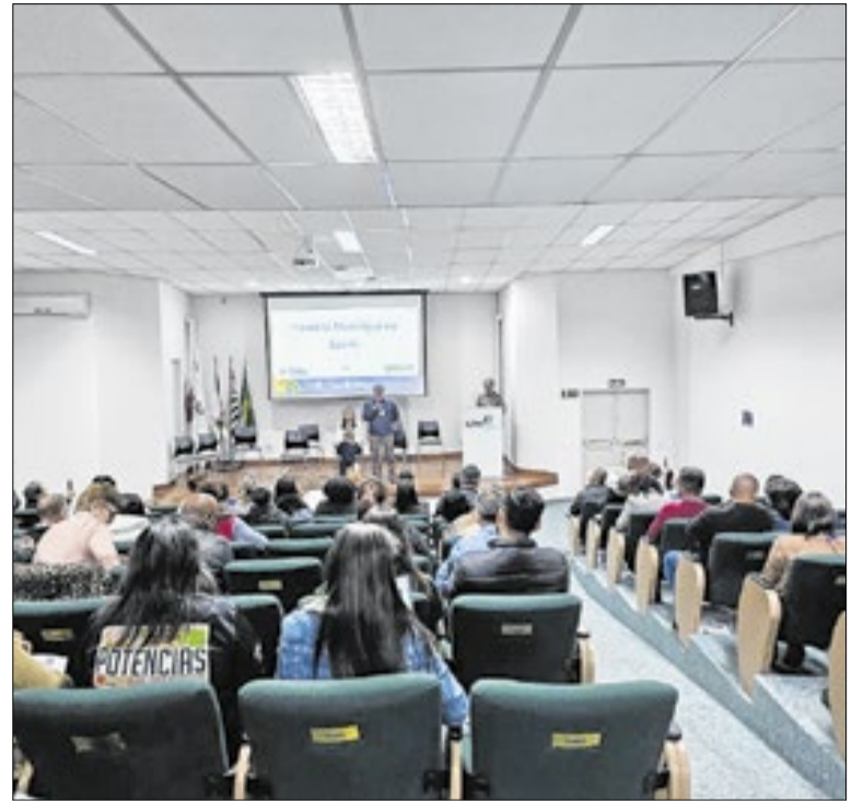
A cidade amplia debate de políticas públicas na saúde nacional e estadual

A renegociação ocorre de forma online ou presencialmente nas Centrais Atende do Centro e Pirajuçara, de segunda a sexta-feira. O abatimento de juros varia de 15% a 100% conforme as parcelas, que têm valor mínimo de R$ 117,90. O acordo é validado após a quitação da primeira cota até 10 de agosto.