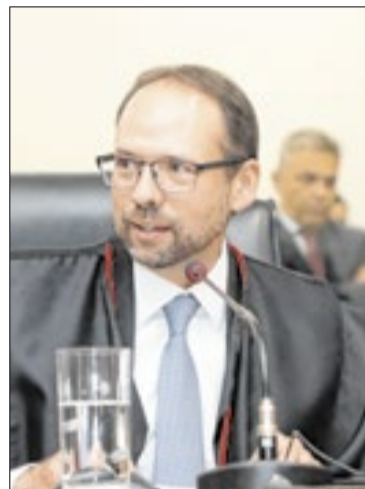
O desembargador eleitoral empossado agradeceu as boas-vindas recebidas