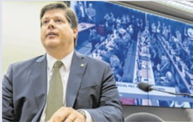
Presidente nacional do MDB na luta contra as bets