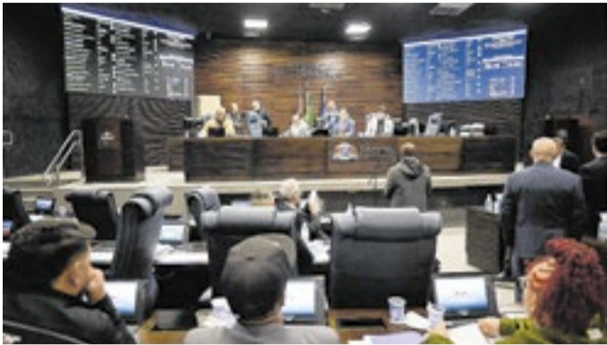
Dois projetos da Prefeitura tiveram parecer favorável