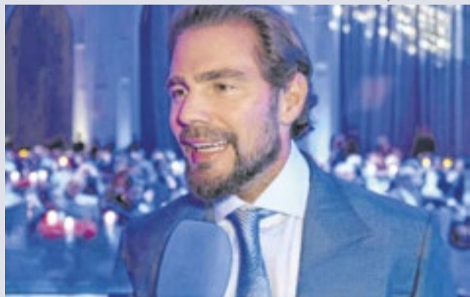
Vorcaro: conversas negadas pelo senador