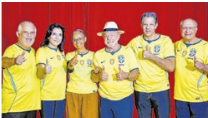
Pré-candidatos posaram com uniforme da Seleção Brasileira