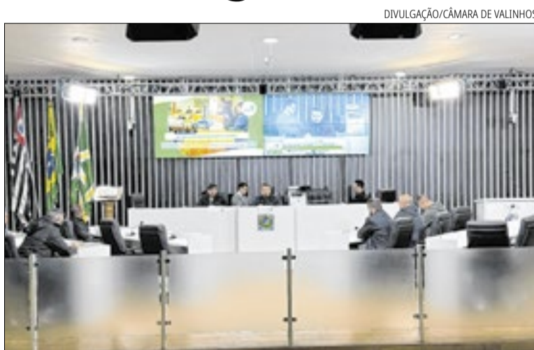
CPI foi aberta com base na suspeita da operação irregular da cooperativa