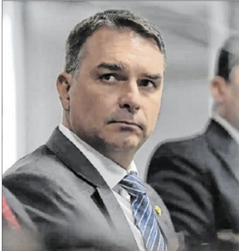
Em declarações nas redes, Flávio e Michele tentam amenizar desentendimentos, mas desgaste foi percebido

A ideia é reforçada diversas vezes. Michelle relata que Bolsonaro lhe pediu para continuar representando o grupo político enquanto permanecia impossibilitado de participar da agenda partidária, afirma que recebeu dele a missão de viajar pelo país e sustenta que decisões tomadas durante esse período tinham sua autorização. Em outro momento, diz