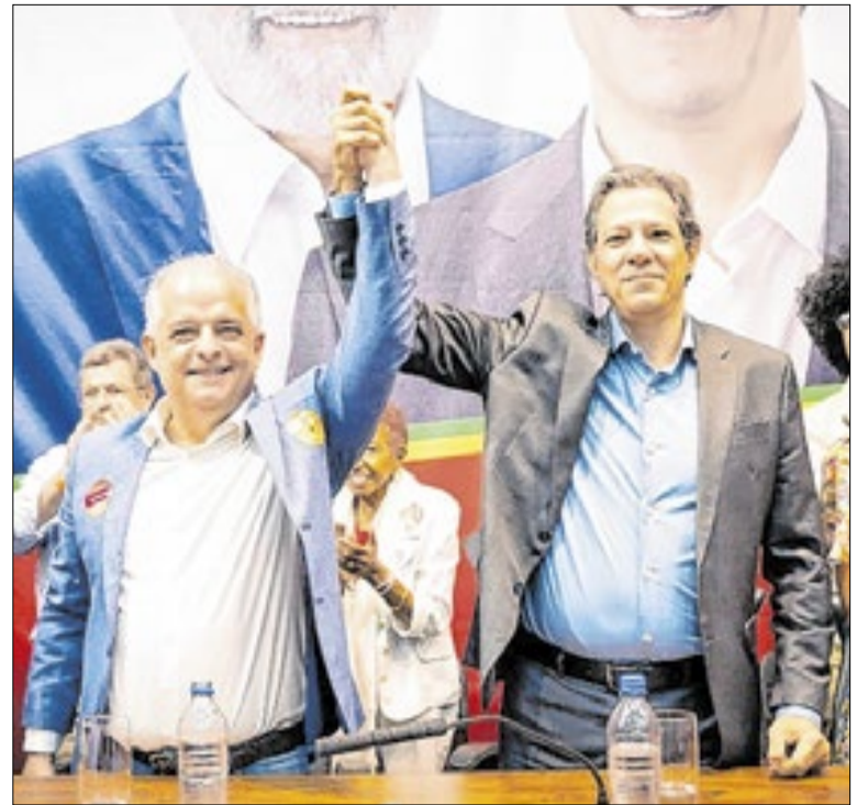
Márcio França e Fernando Haddad juntos em covenção na Alesp, em 2022

As investigações do MP-SP apontam que o grupo utilizava comércio de produtos piratas, empresas de fachada e laranjas para lavar dinheiro obtido com agiotagem. Entre os bens rastreados está um Porsche 911 registrado em nome de uma cozinheira. O foco agora é identificar os financiadores do esquema.