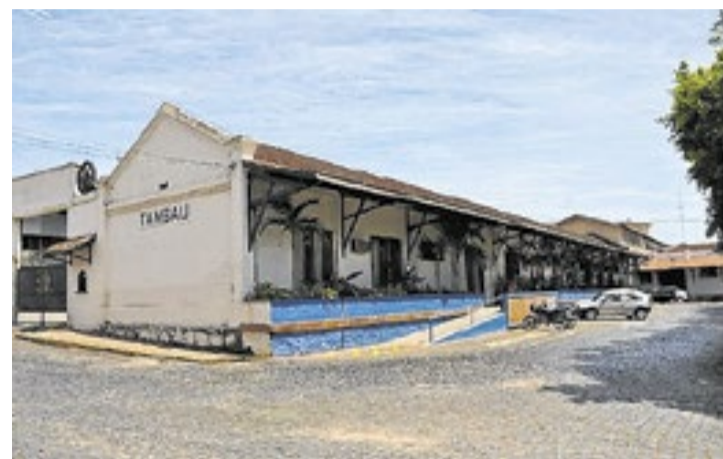
Cidades de São Sebastião, São Roque, São José do Rio Preto e Tambaú credenciaram o Banco Digimais como possibilidade de empréstimos consignados