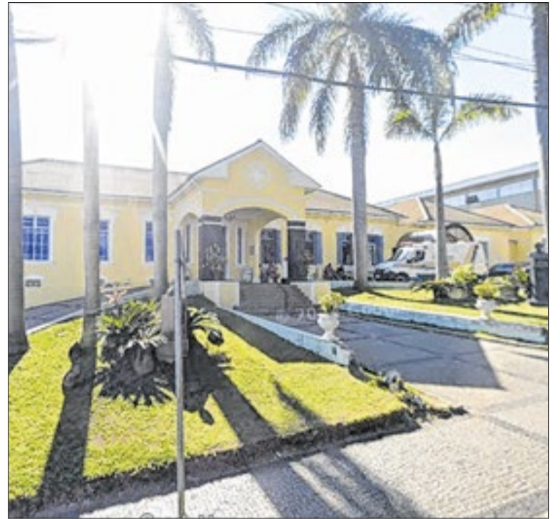
Também são apuradas irregularidades na aplicação de recursos públicos

Indaiatuba informou que as ruas Chile e Guianas, no Jardim América, serão interditadas das 15h às 23h59 desta sexta-feira (26) e sábado (27) para evento da ACENBI. Segundo as informações, o trânsito será sinalizado, e motoristas devem utilizar rotas alternativas e consultar Waze e Google Maps.