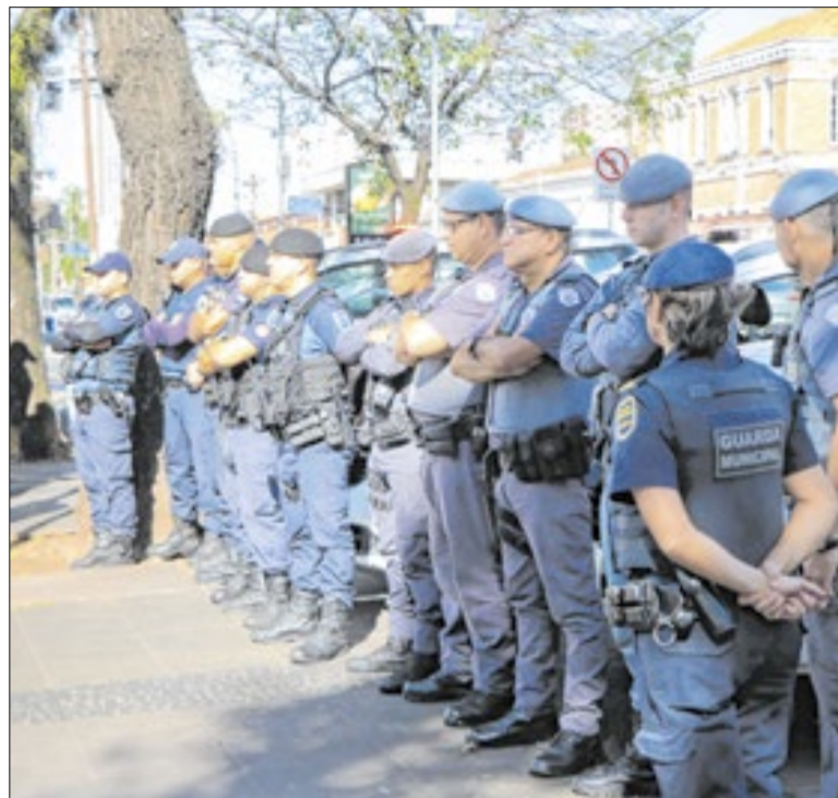
Guardas Municipais e Policiais Militares durante operação no Centro da cidade

É urgente a reflexão sobre a postura que deve nortear o ambiente parlamentar. A Câmara não pode ser tratada como um picadeiro de vaidades ou um espaço para a busca de simpatia fácil por meio de propostas inócuas, a fim de gerar votos de analfabetos políticos. É preciso, senhores, rejeitar o populismo.