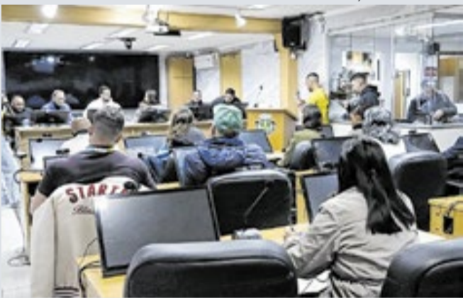
Uma ação para resolver demandas ocorrerá no dia 27/6