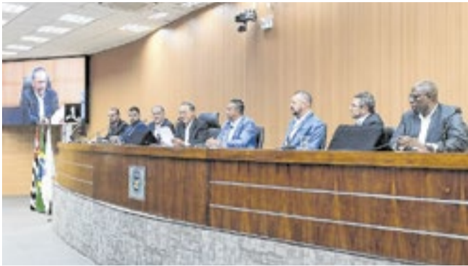
Bloco reúne vereadores de 20 Câmaras municipais