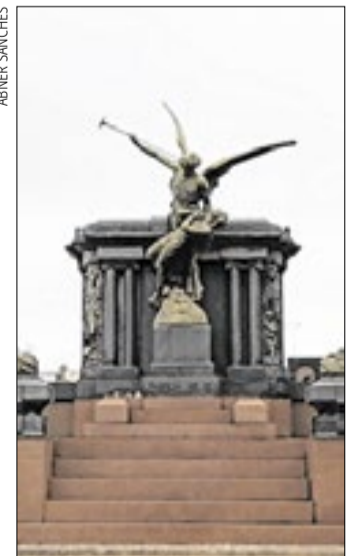
Livro possui mais de 80 páginas com fotografias e curiosidades

O Cemitério da Saudade reflete transformações sociais e econômicas de Campinas, especialmente no auge do ciclo do café. O e-book destaca estilos como o neoclassicismo, o realismo, o ecletismo, o art déco e o modernismo. A obra também aborda a trajetória de artistas que marcaram a arte tumular local, como Lélío Coluccini, Patrício Vélez e Giuseppe Tomagnini.