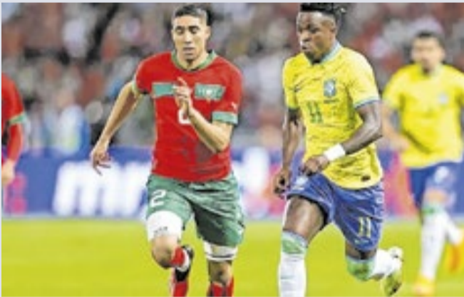
Marrocos foi a primeira seleção africana a se classificar