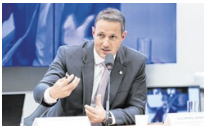
Derrite no debate da Câmara sobre a PEC da Segurança