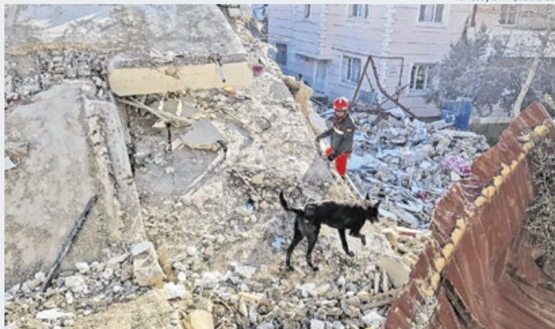
Terremotos de magnitudes 7,2 e 7,5 atingiram a Venezuela e deixaram um verdadeiro rastro de destruição