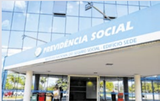
O valor de R$33.763 é pago para três aposentados