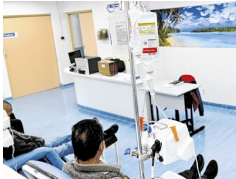
Interior do Hospital Mário Gatti: MP ingressou na Justiça com uma ação civil pública por medidas urgentes para reduzir a fila de cirurgias ortopédicas no SUS