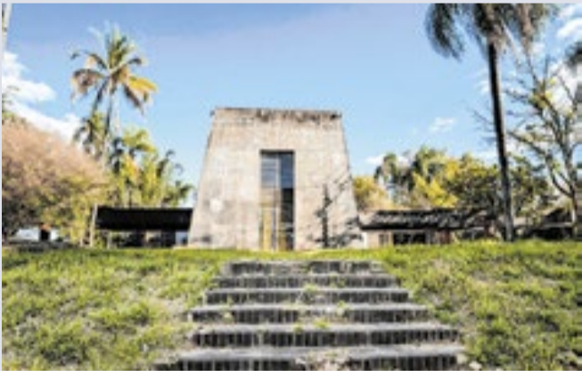
Imóvel recebeu R$ 2 milhões de investimentos