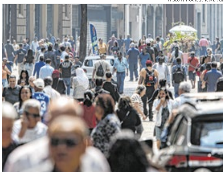
Inflação pode subir no fim deste ano e cair até 2028

O relatório do BC apresenta as diretrizes das políticas adotadas pelo Comitê de Política Monetária (Copom) para a definição da taxa básica de