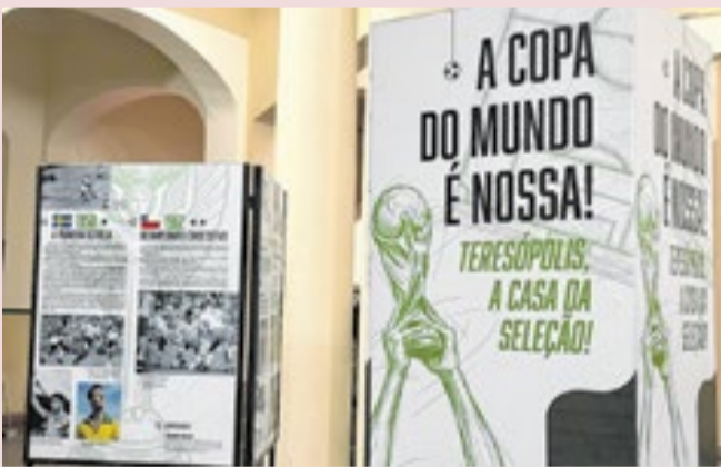
O público pode conferir desde a criação da antiga CBD