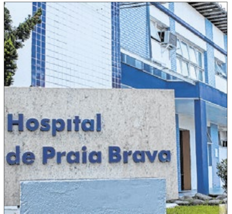
Unidade presta atendimentos para moradores de Angra e também de Paraty

A prefeitura de Barra Mansa informou que o resultado do Concurso Rua da Copa 2026, inicialmente previsto para ser divulgado nesta sexta-feira, dia 26, foi adiado para a sexta-feira da próxima semana, dia 03 de julho. A alteração no cronograma ocorreu em razão das chuvas registradas nos últimos dias.