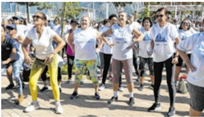
EDU KAPPS / SMS

Programa reúne mais de 203 mil participantes