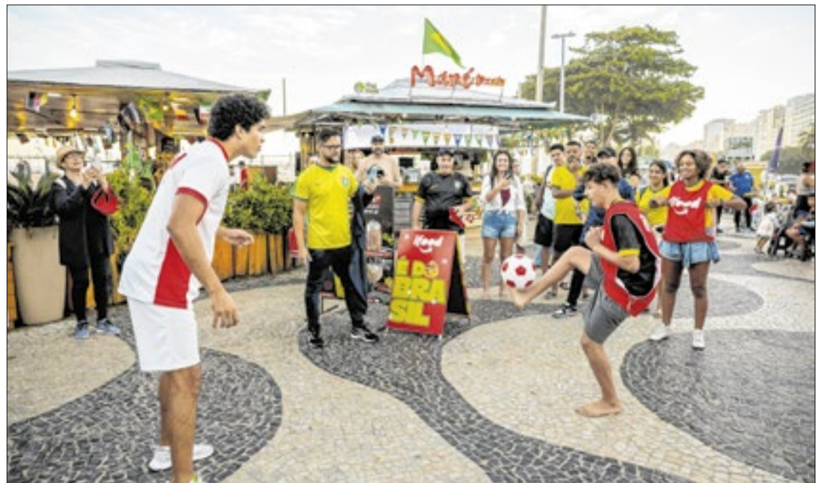
Marca ajudou a tornar a temporada de jogos ainda mais animada na orla

Entre os destaques esteve o desafio de chute ao gol, que reuniu amigos, famílias e frequentadores da praia em disputas descontraídas. A dinâmica rapidamente chamou atenção de quem passava pelos quiosques e ajudou a espalhar o clima de torcida pela areia.