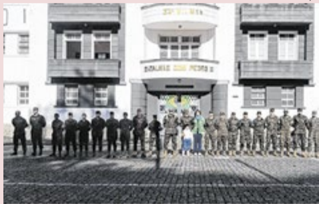
Alterações foram publicadas no D.O da União