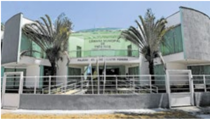
Verbas permitem aquisição de materiais para a UPA