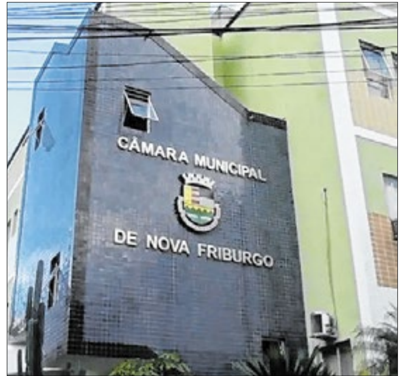
Câmara de vereadores avaliará se derruba ou mantém o veto do prefeito

A concessionária Águas de Nova Friburgo iniciou a fase de testes da Estação de Tratamento de Esgoto (ETE) Cônego. A inauguração está prevista para os próximos meses. O emissário que fará parte do sistema de coleta e tratamento de esgoto da nova unidade, começou a ser instalada na localidade.