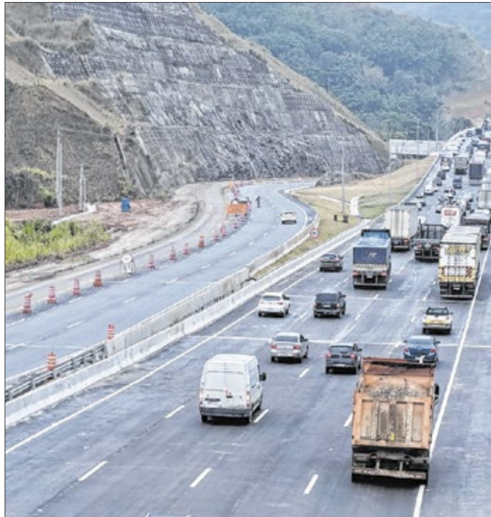
Primeira fase conta com 8 novos viadutos e 4 km de novas pistas de subida (sentido São Paulo)

Quando concluída, a Nova Serra das Araras contará com uma infraestrutura moderna e preparada para atender às demandas atuais e futuras do país. O projeto prevê quatro faixas de rolamento e acostamento em cada sentido, 24 novos viadutos, duas rampas de escape e iluminação em