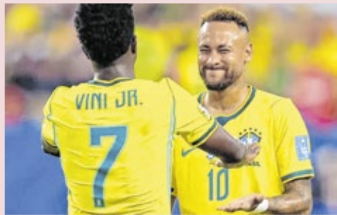
Neymar e Vini Jr., em jogo contra a Escócia