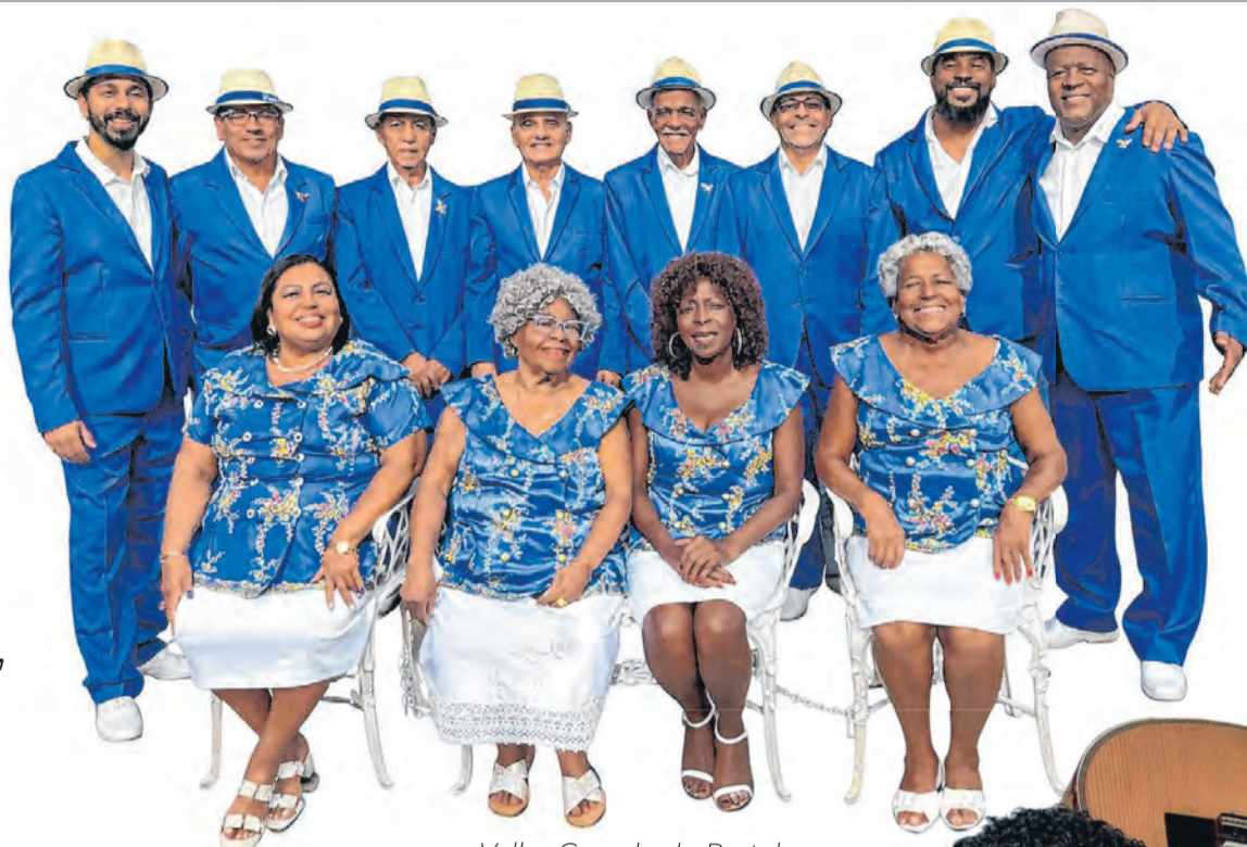
Velha Guarda da Portela