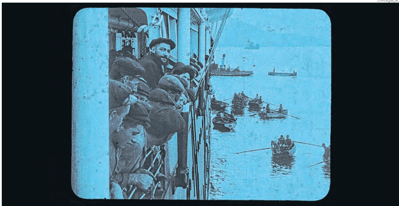
Divulgação 'I Fratelli Segreto' celebra a gênese italo-brasileira de nosso cinema, com sessões na 8 e Meio Festa e na CineOP

Convidado especial desta edição do evento, Ferrone desembarca no Brasil para uma série de debates e encontros com o público. A agenda começou em Brasília, na quarta, em uma sessão especial promovida pela Embaixada da Itália. Em São Paulo, o cineasta apresenta o filme no Espaço Petróbras de Cinema e participa do