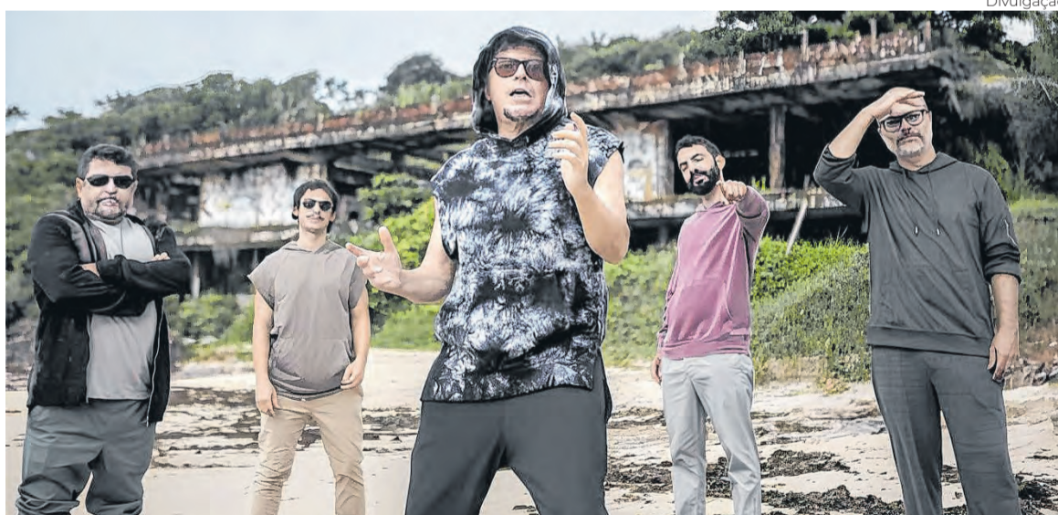
Mundo Livre S/A, a banda mais roqueira da cena Manguebeat

Produzido por Apollo 9, "Condom Black" surgiu como um passo adiante em relação à estreia solo de Otto, "Samba Pra Burro" (1998). Se o disco de estreia ainda carregava a energia crua e experimental dos primeiros anos pós-Chico Science &