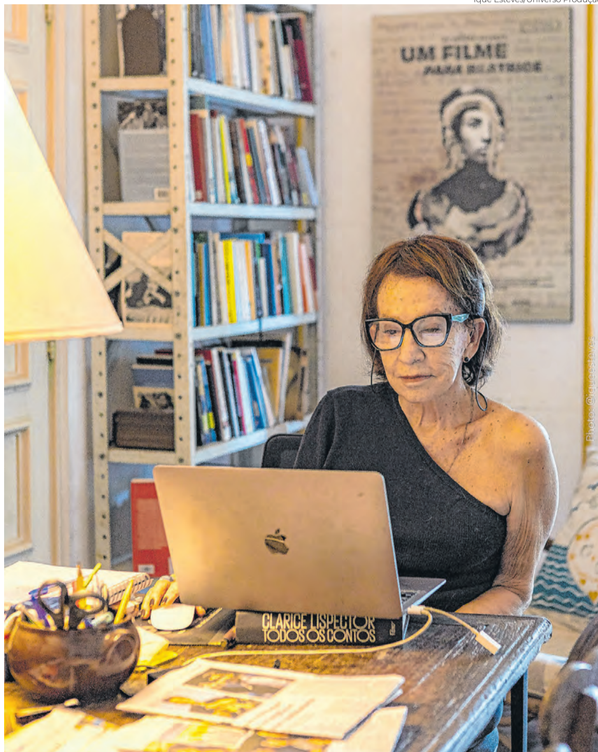
Ique Esteves/Universo Produção

Na triagem das justificativas (acertadas) da direção artística da CineOP em celebrar os feitos de