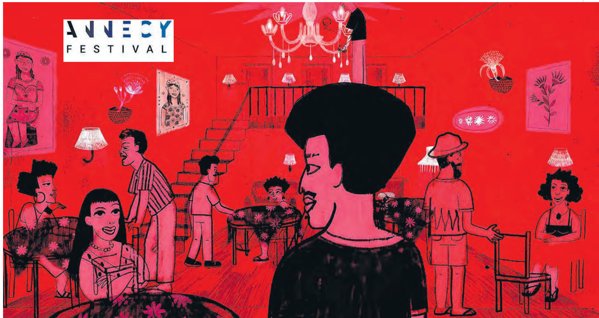
Premiada na Croácia, a animação 'O Filho da Puta' está em concurso numa das mostras competitivas do Festival de Annecy