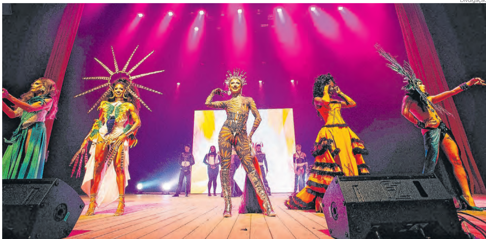
Com entrada gratuita, festival celebra a cultura Drag com música, arte, performances e palestras

Na sexta-feira (26), a programação começa às 14h com o bate-papo “Nem Tudo que Viraliza é Verdade: formando pensamento crítico na era das redes”, conduzido por Rita von Hunty. O encontro propõe uma reflexão sobre circulação de informações, redes sociais e formação de pen-