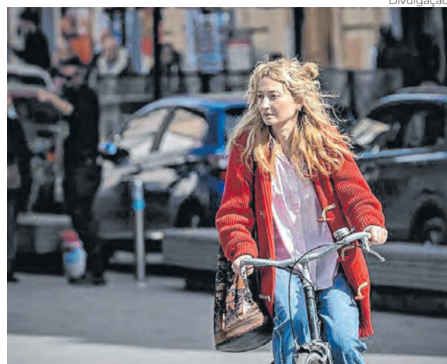
Divulgação 'Três Vezes Adeus' carrega a marca autoral da catalã Isabel Coixet para terras italianas