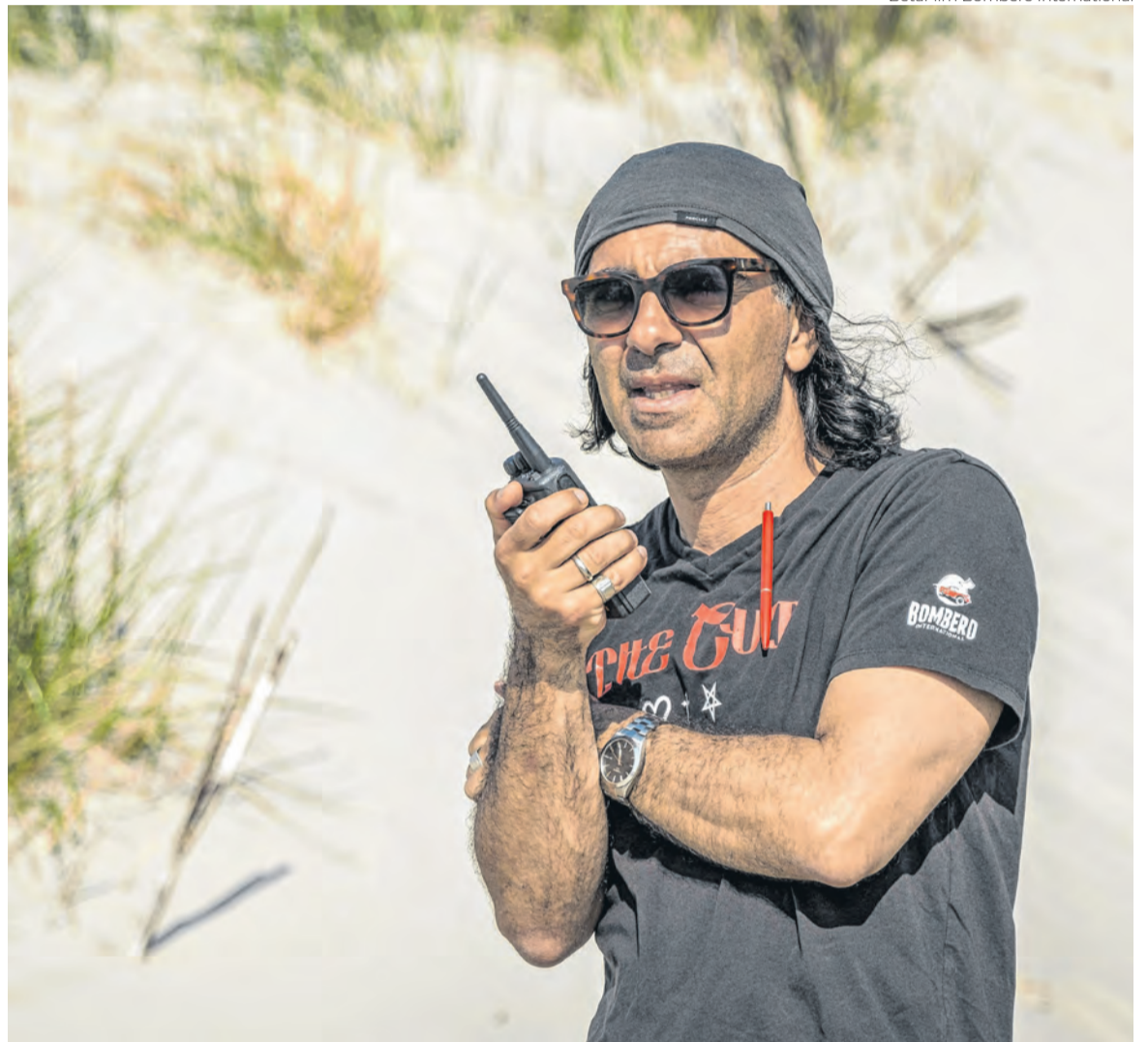
BetaFilm Bombero International

Filmar na Alemanha, com a liberdade que filmo, é a minha definição de ser alemão. Se eu tivesse satisfeito com o país de onde venho, não seria cineasta. Filmo para reagir, sem o desejo de retomar caminho que já percorri. Até o início dos anos 1990, mesmo com toda a segregação que vivemos na II Guerra Mundial, você não poderia se considerar alemão, mesmo nascendo na Alemanha, se o seu sangue não fosse germânico. E o meu sangue é turco, assim como parte da minha identidade, que