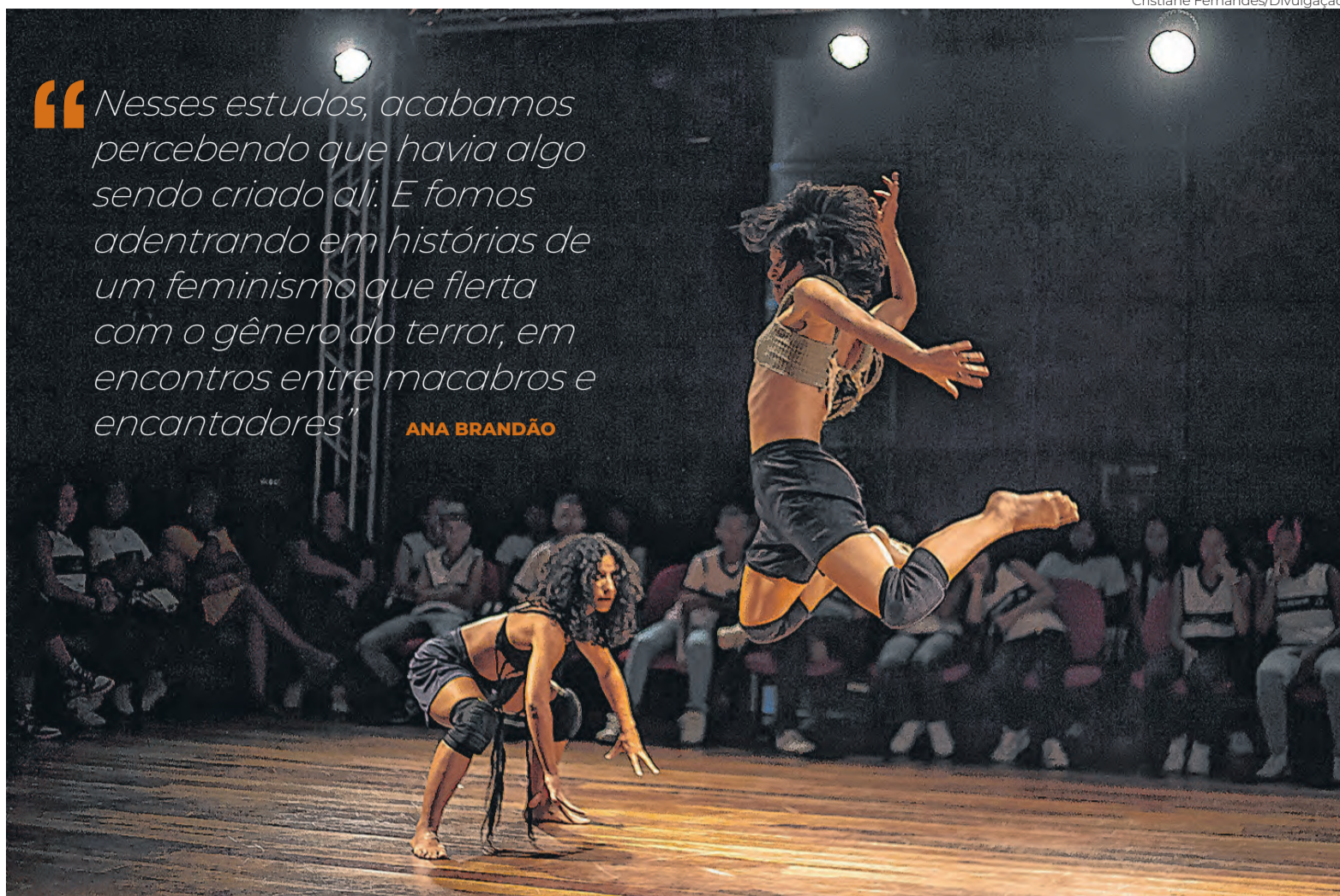
O processo criativo que deu origem ao espetáculo começou no período pós-pandemia, durante estudos de movimento

Entre as referências que atravessam o espetáculo, estão o conto “As coisas que perdemos no fogo”, da escritora argentina Mariana Enríquez, a obra “Xifópagas capilares entre nós”, do artista visual Tunga, além de mitologias populares brasileiras marcadas por transformações de