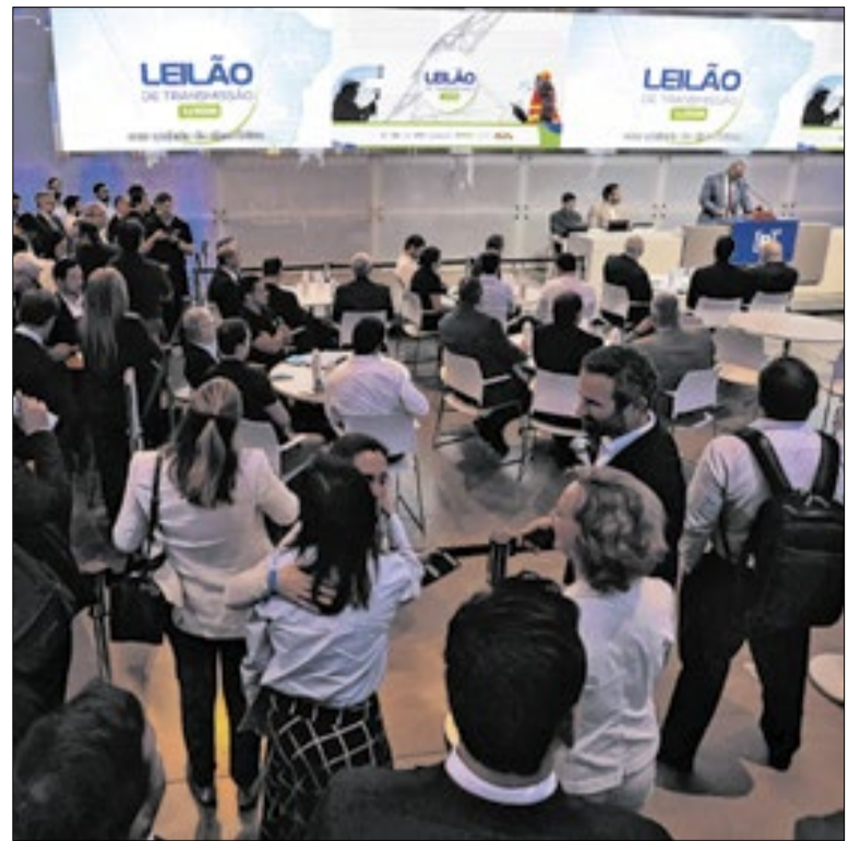
A parceria faz parte de uma missão oficial da Fazenda à China

Além do benefício mínimo, há o pagamento de três adicionais.