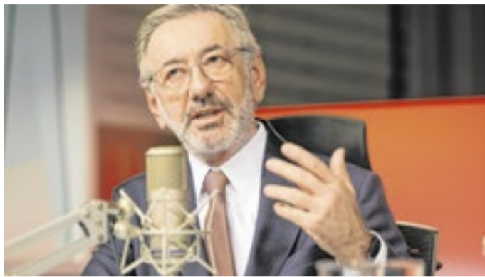
Medida tem validade por seis meses, diz ministro