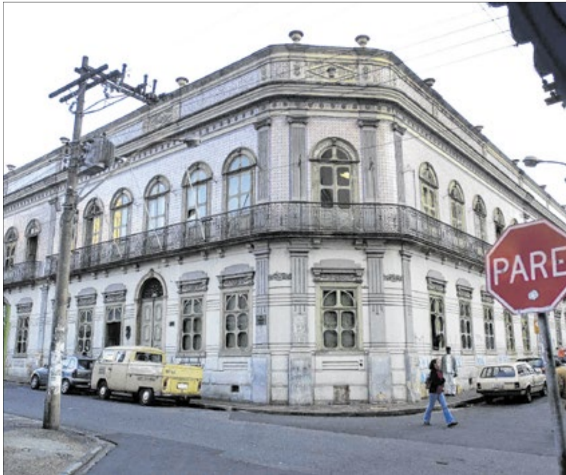
Construção foi erguida como uma demonstração de poder econômico e cultural no séc. XIX, a partir de um estilo arquitetônico neoclássico ainda raro no município naquele período