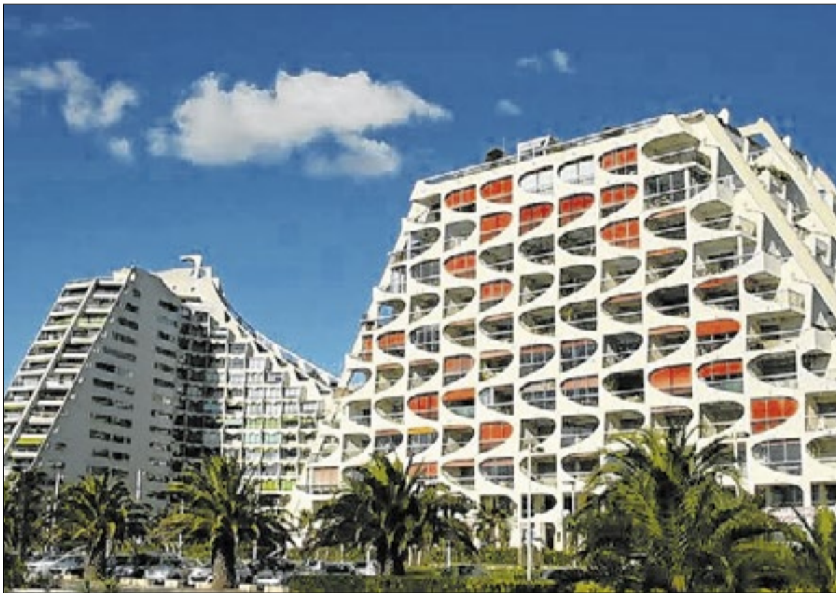
La Grande-Motte tem as mesmas características arquitetônicas de Brasília

Exposição “Urban Utopias” aproxima os dois países a partir do intercâmbio entre a capital brasileira e a cidade de La Grande-Motte