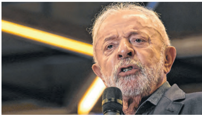
Presidente ouviu do PT-MG recusa a aliança com MDB