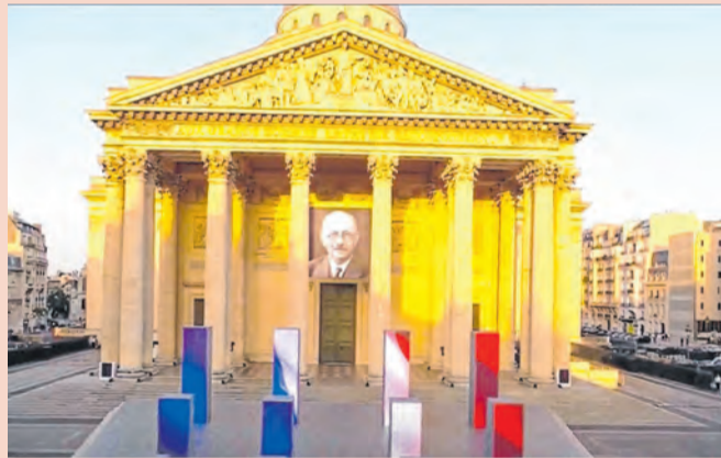
Homenagem da França ao historiador Marc Bloch