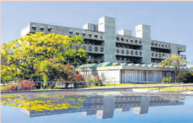
Centro de Reabilitação Sarah Kubitschek, em Brasília