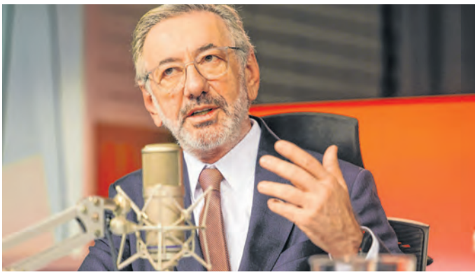
Medida tem validade por seis meses, diz ministro