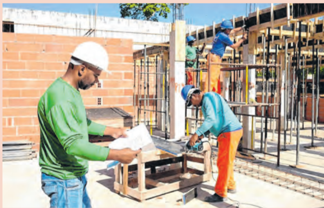
Projeto faz parte da ampliação do Hospital Municipal

As obras da futura Clínica de Hemodiálise de Porto Real seguem em andamento como parte do projeto de reforma e ampliação do Complexo de Saúde do Hospital Municipal São Francisco de Assis. A unidade está sendo construída no espaço onde era o antigo Centro de Diagnóstico e Tratamento e tem como objetivo permitir que pacientes realizem o tratamento no município, reduzindo a necessidade de deslocamentos para outras cidades.