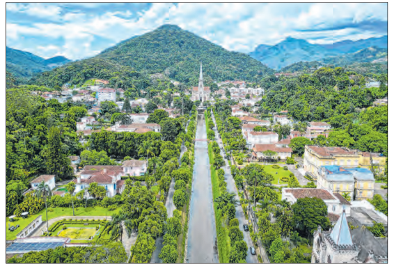
Relatório pede suspensão de grandes construções no município

Entre os destaques esteve o desempenho da rede hoteleira, que segue registrando índices expressivos de ocupação. Durante o feriado de Corpus Christi, a taxa ultrapassou 92%, refletindo o aquecimento do turismo e seus impactos positivos na economia. A reunião também abordou ações de promoção do destino.