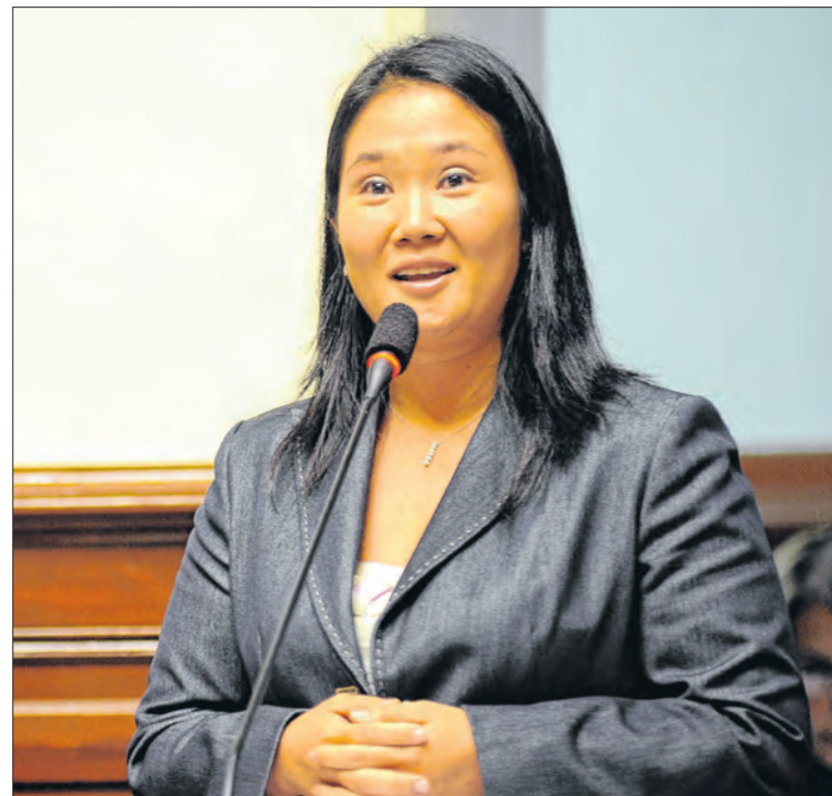
Keiko será a nona presidente do país em 10 anos com 9.206.241 votos

Um homem foi preso em Taizhou, no leste da China, por criar mais de 300 pítons em seu apartamento. Segundo a imprensa local, as cobras eram mantidas sem autorização. No país, a espécie é protegida por lei, e a criação, compra, venda ou transporte desses animais exigem permissão das autoridades.