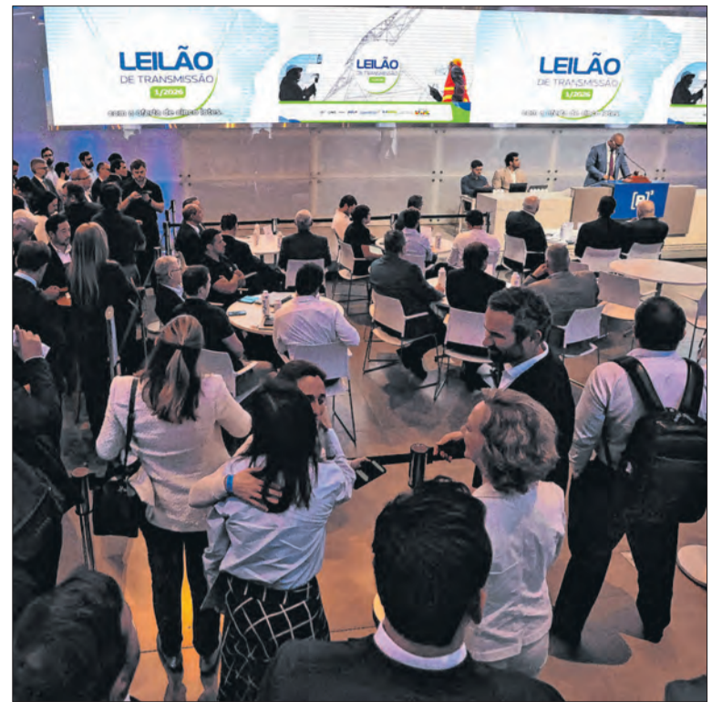
A parceria faz parte de uma missão oficial da Fazenda à China

Além do benefício mínimo, há o pagamento de três adicionais.