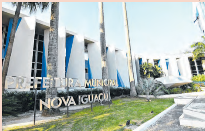
Classificação reforça a credibilidade do município