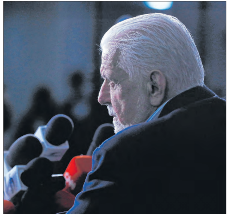
Saída de Jaques Wagner da liderança já era esperada

Mas já houve um bate-boca na CAE entre o presidente da comissão, senador Renan Calheiros (MDB-AL), e o presidente do Banco Central, Gabriel Galípolo, quando Renan cobrou a atitude do BC na negociação do Master com o BRB. Galípolo defendeu a instituição.