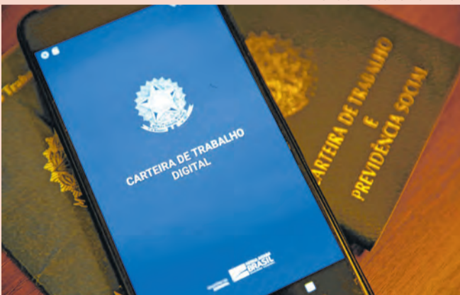
Serviço público puxa alta