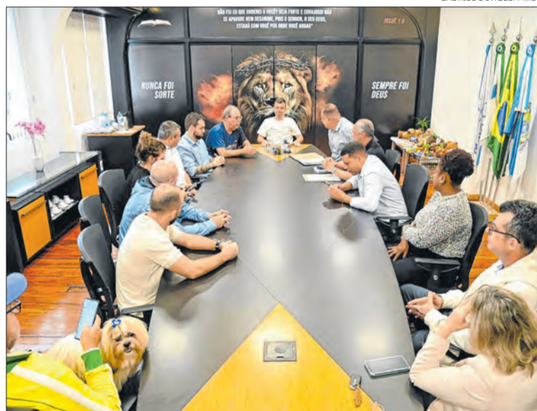
Prefeitura conclui licenciamento e autoriza início de empreendimento