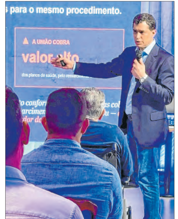
Ex-vice-presidenciável e relator da Ficha Limpa lança livro sobre o SUS, percorre o país em turnê nacional e estreia como mentor de empresários de setores regulados

O capítulo político, garante, está encerrado. “Não pretendo voltar à política. Quero seguir defendendo os hospitais brasileiros e, a partir dessa experiência, ajudar outros setores regulados que dependem do Estado a evitar riscos e abrir oportunidades no setor privado. Tudo começou pela saúde — e isso tem me dado sentido à vida.”