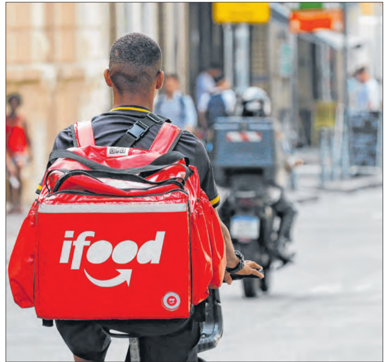
Julgamento foi adiado a pedido do Ministério Público do Trabalho

Mas, no Palácio do Planalto, a avaliação é de que Flávio apenas fez um agrado à parlamentar, fiel seguidora do bolsonarismo. Ele, afinal, sabe que essa disputa presidencial, polarizada como as mais recentes, tende a ser decidida por eleitores mais moderados. Bia Kicis passa longe desse tipo de perfil.