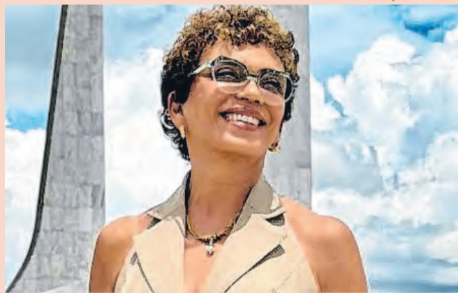
Ex-prefeita de Contagem quer o Senado