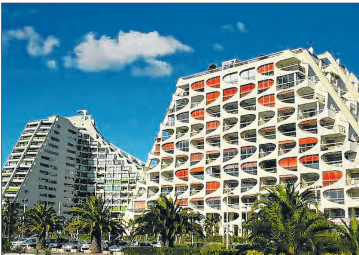
La Grande-Motte tem as mesmas características arquitetônicas de Brasília

Exposição “Urban Utopias” aproxima os dois países a partir do intercâmbio entre a capital brasileira e a cidade de La Grande-Motte