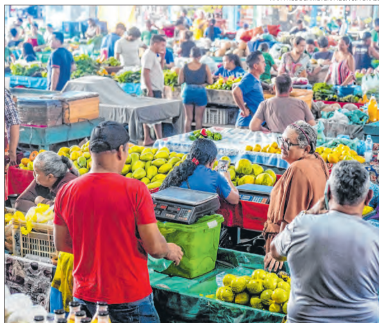
Dados de 2024 fazem parte da Pesquisa Industrial Anual: Empresa e Produto

A receita líquida de vendas (RLV), calculada a partir da receita bruta com a dedução dos impostos sobre vendas, das vendas canceladas e dos descontos incondicionais, alcançou R$ 6,8 trilhões.