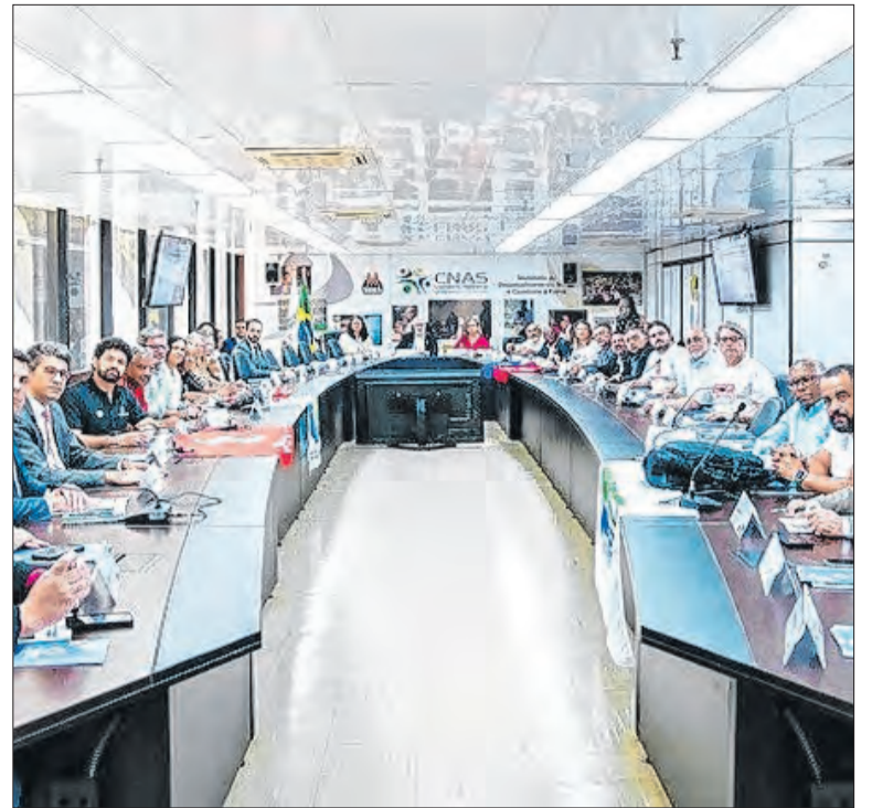
Reunião da Mesa de Negociações acontece nesta quinta-feira(25)

A proposta proíbe órgãos federais de eliminarem candidatos vulneráveis se o próprio Estado falhar em oferecer os laudos de saúde gratuitos. O texto abrange vagas efetivas e contratações temporárias da União, impedindo que o custo financeiro vire uma barreira de exclusão para quem passou na prova