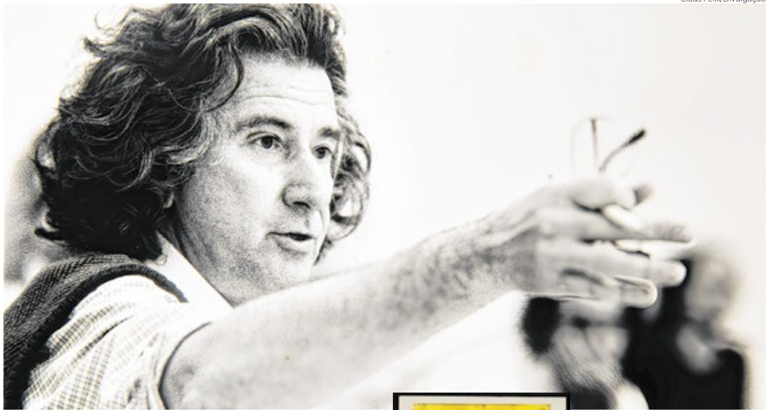
Augusto Boal dirigindo 'La Malasangre', em Nuremberg (Alemanha), em 1984

A ocupação também destaca a importância do Teatro de Arena, grupo fundamental da cena brasileira a partir dos anos 1950. Sob direção de Boal, o Arena consolidou uma dramaturgia voltada à realidade social brasileira e revelou autores, atores e encenadores que marcariam a história do teatro nacional. O grupo circulou por países como Estados Unidos, México, Peru e Argentina, tornando-se referência artística e política na América Latina e no mundo.