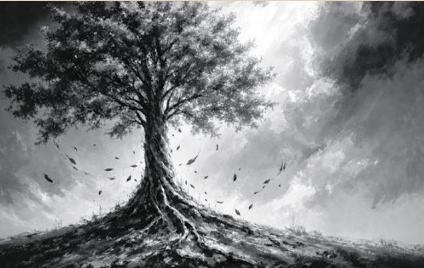
Imagem criada com a IA GPT Image 2

Ela é o vento. É a rajada que chega sacudindo tudo, a que levanta a poeira. A que causa uma tempestade, escurece o céu num átimo e, no instante seguinte, deixa o ar mais limpo do que estava