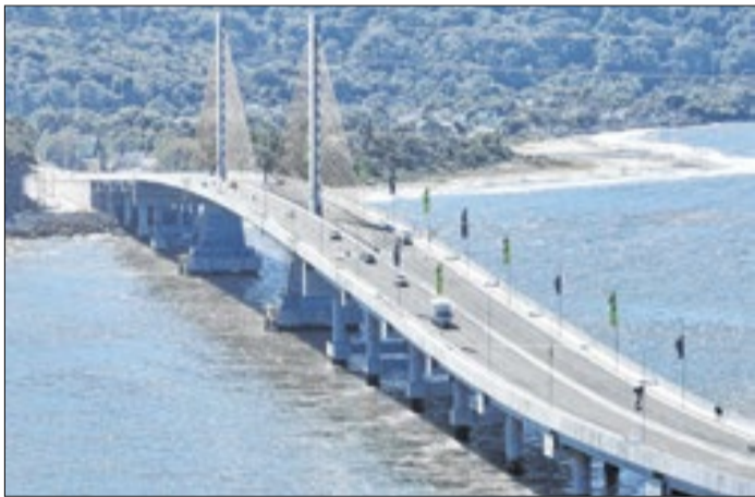
Estudo mostra o menor custo para ponte estaiada