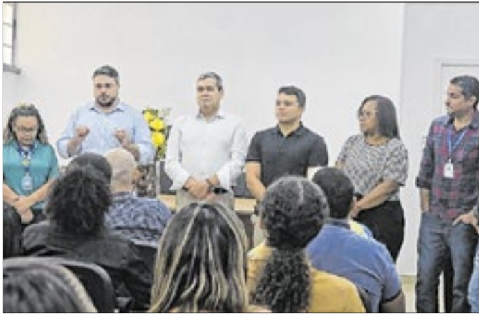
O encontro contou com a participação do PPSUS