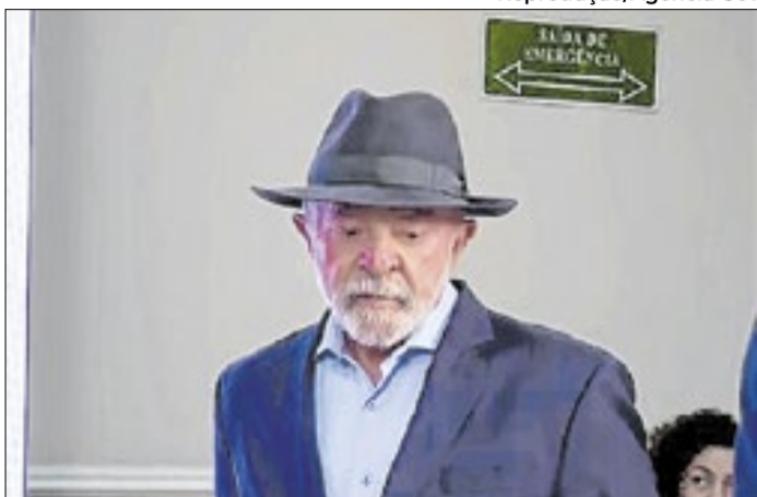
Lula participou de evento em Guarulhos nesta terça(23)