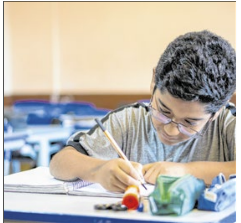
Educação amplia avanços na alfabetização no Paraná