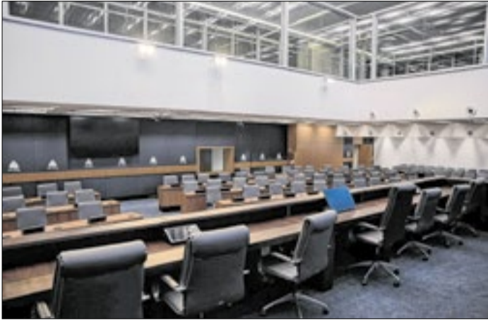
Reuniões separadas decidirão o comando das comissões