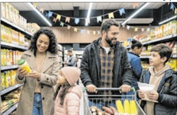
Segundo pesquisa, o planejamento costuma ser esquecido