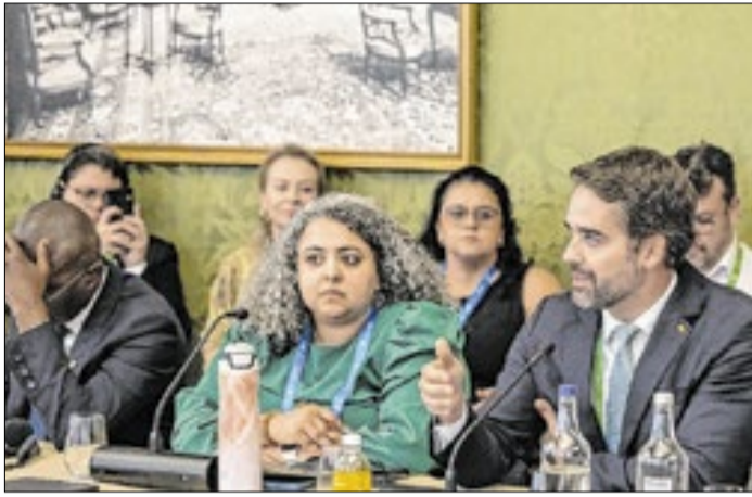
Eduardo Leite apresentou estratégias no Reino Unido