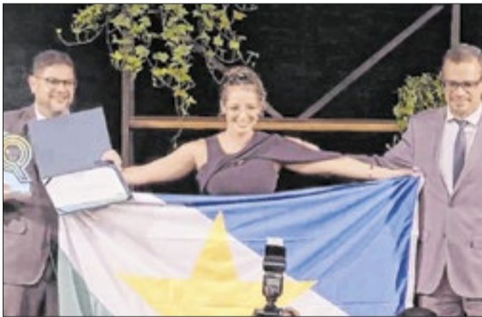
Estado ficou em segundo lugar no IV Prêmio Qualidade