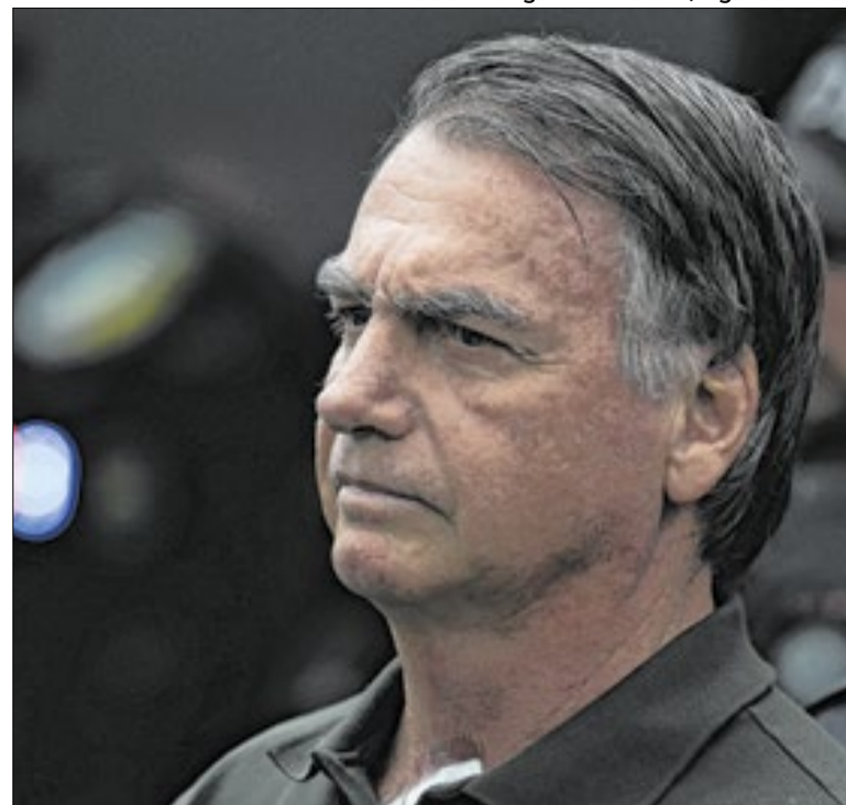
Prazo da domiciliar de Bolsonaro se encerra na quinta

Candidato à reeleição, o governador Tarcísio de Freitas é filiado ao Republicanos, partido controlado pela Universal. O Digimais também pode oferecer consignados a servidores da prefeitura paulistana, mas, de acordo com publicações no Diário Oficial, as autorizações são mais antigas, de 2023.