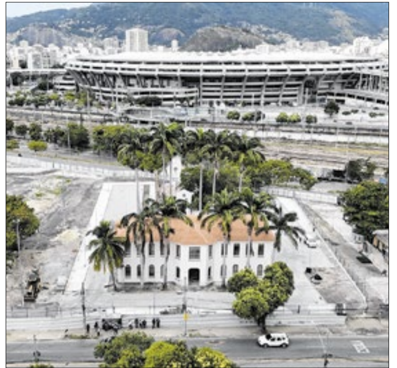
Local tem serviços da Deam, Defensoria Pública, entre outros

O Restaurante La Gare, em Búzios, recebe neste sábado (27), às 17h, a edição "Sunset" do Vinho no Vila. O evento na Praia dos Ossos terá degustação em formato Open Wine com rótulos de vários países, DJ e MPB ao vivo. Os ingressos custam R$ 126 por pessoa e o local sugerirá um menu harmonizado cobrado à parte.