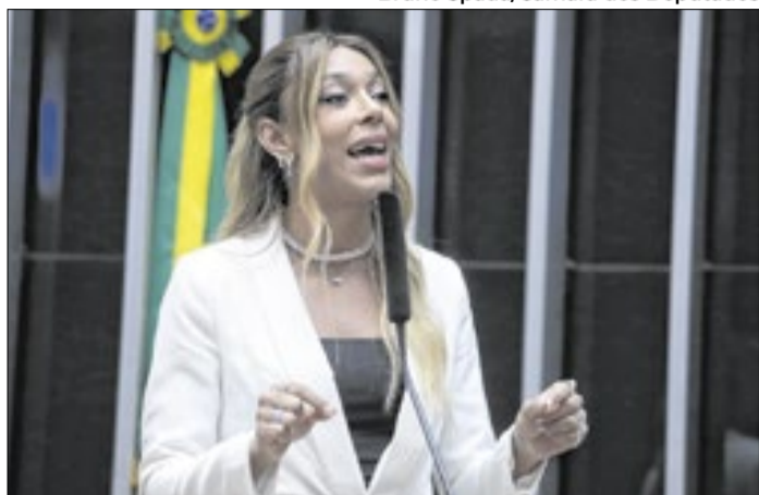
Parlamentar do Psol recorreu ao MP