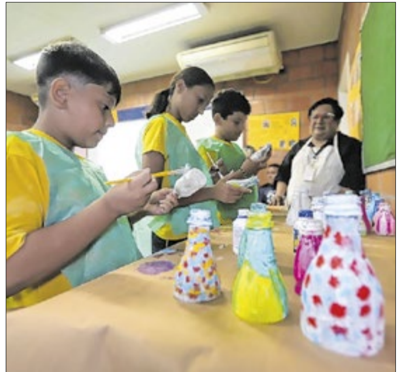
UGPE promove atividades ambientais em comunidade local

A governadora do Pará, Hana Ghassan visitou o novo Centro Administrativo do Estado do Pará. O espaço reúne estruturas destinadas ao funcionamento de órgãos públicos estaduais. A visita acompanhou o andamento das instalações e a organização do prédio para receber atividades administrativas.