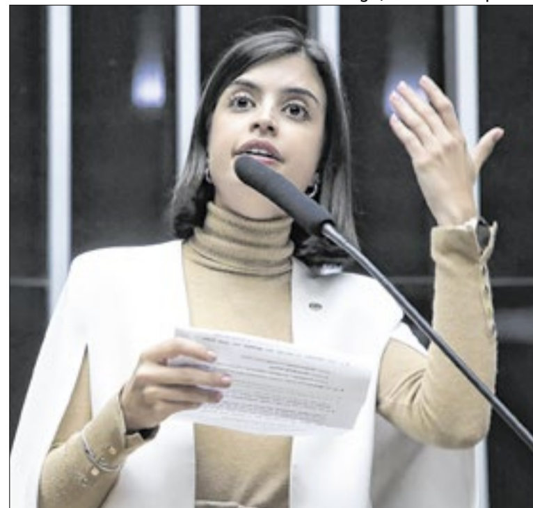
Deputada informou que 14,2% das crianças tem excesso de peso

Segundo a coluna de Mônica Bergamo na Folha de S.Paulo, Fernando Haddad saiu em defesa de Jaques Wagner e afirmou ser testemunha de que o senador atuou contra interesses do Banco Master. A declaração ocorre em meio a investigações da PF sobre supostas irregularidades ligadas ao caso.