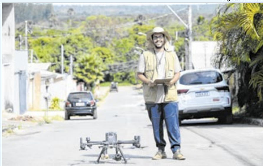
Operação dos drones segue os protocolos de segurança