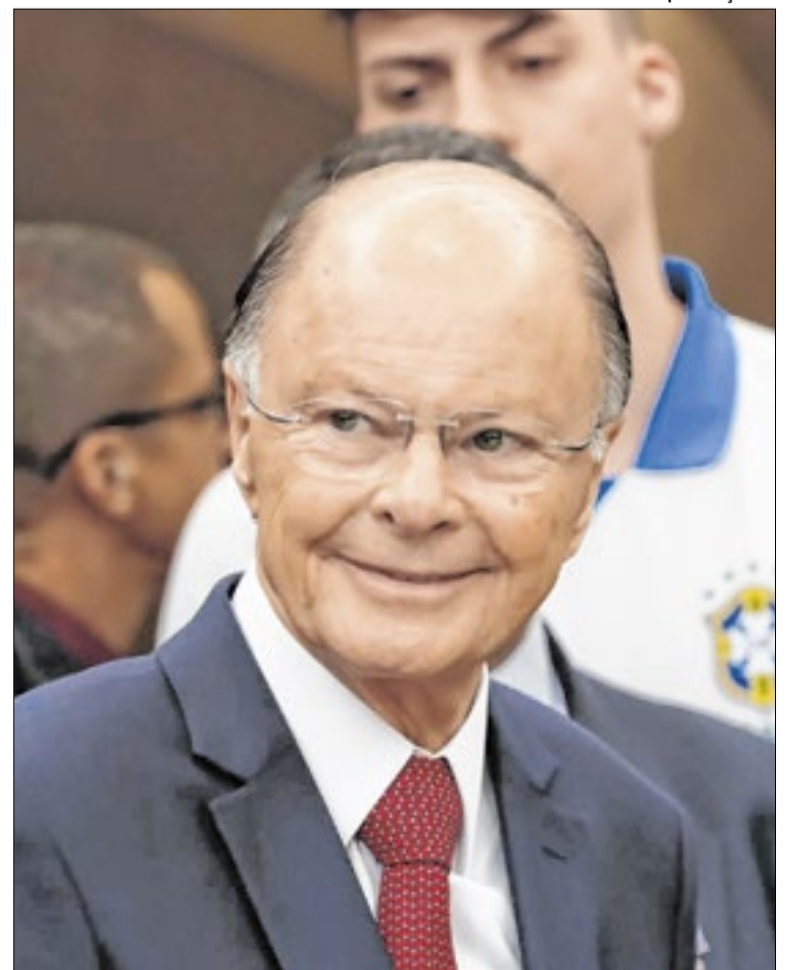
Banco de Edir Macedo comportou-se como o Master

"A instituição reafirma seu compromisso com a transparência, a conformidade regulatória e a plena colaboração com as autoridades competentes", disse a nota.