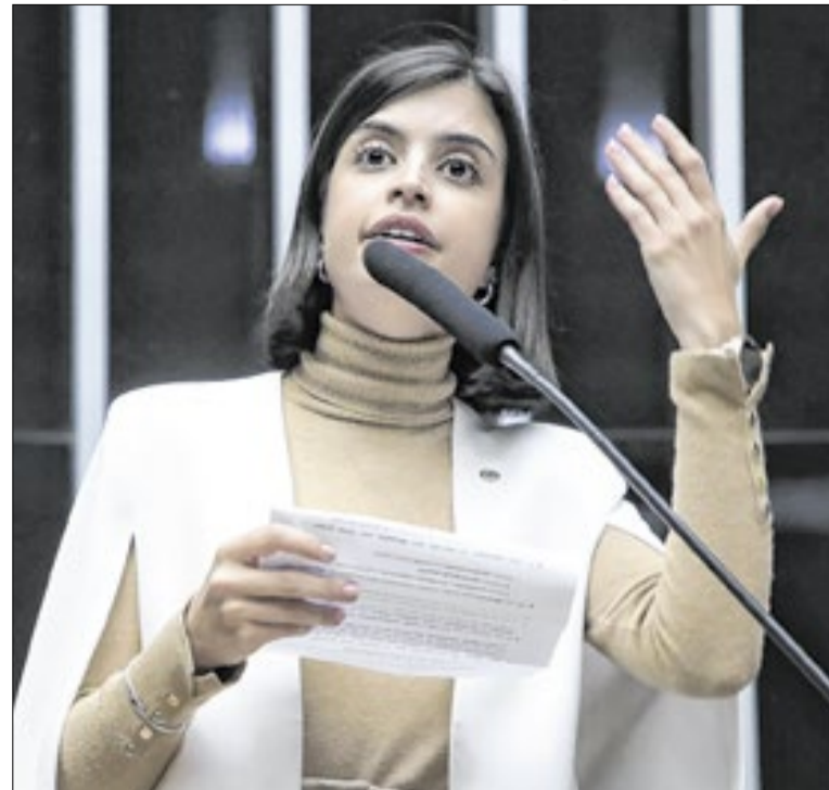
Deputada informou que 14,2% das crianças tem excesso de peso

Segundo a coluna de Mônica Bergamo na Folha de S.Paulo, Fernando Haddad saiu em defesa de Jaques Wagner e afirmou ser testemunha de que o senador atuou contra interesses do Banco Master. A declaração ocorre em meio a investigações da PF sobre supostas irregularidades ligadas ao caso.