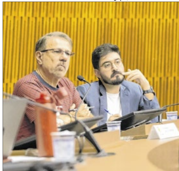
Debate abriu espaço para sugestões e questionamentos

O Comitê é formado por representantes das secretarias de Assistência e Desenvolvimento Social, Saúde, Educação, Segurança, Mulher, Família, Esporte e Cultura. Também participam membros dos Conselhos Municipais da Criança e do Adolescente, Assistência Social, Saúde e Educação.