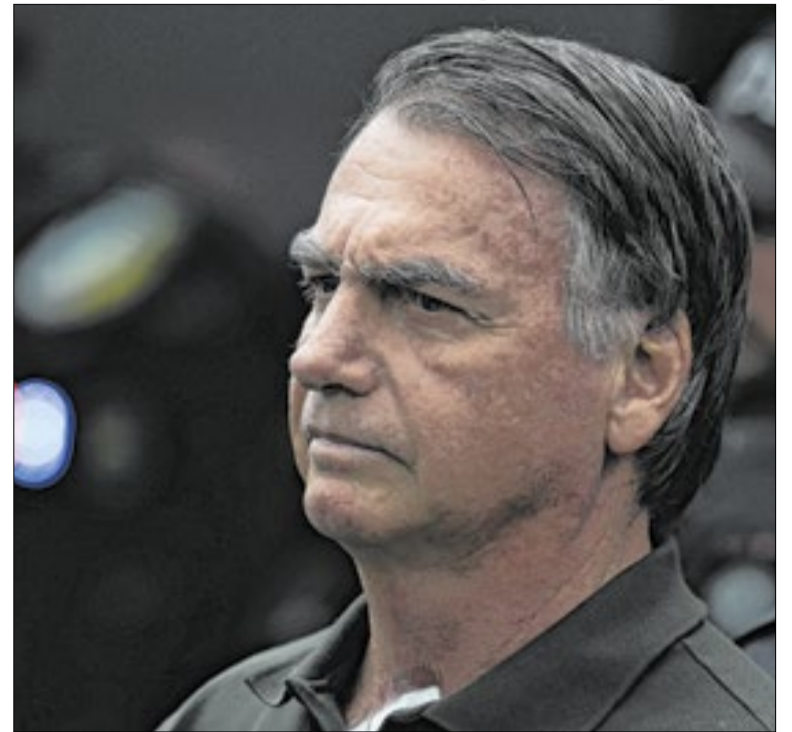
Prazo da domiciliar de Bolsonaro se encerra na quinta

Candidato à reeleição, o governador Tarcísio de Freitas é filiado ao Republicanos, partido controlado pela Universal. O Digimais também pode oferecer consignados a servidores da prefeitura paulistana, mas, de acordo com publicações no Diário Oficial, as autorizações são mais antigas, de 2023.