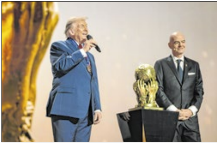
Trump e Infantino no sorteio dos grupos da Copa