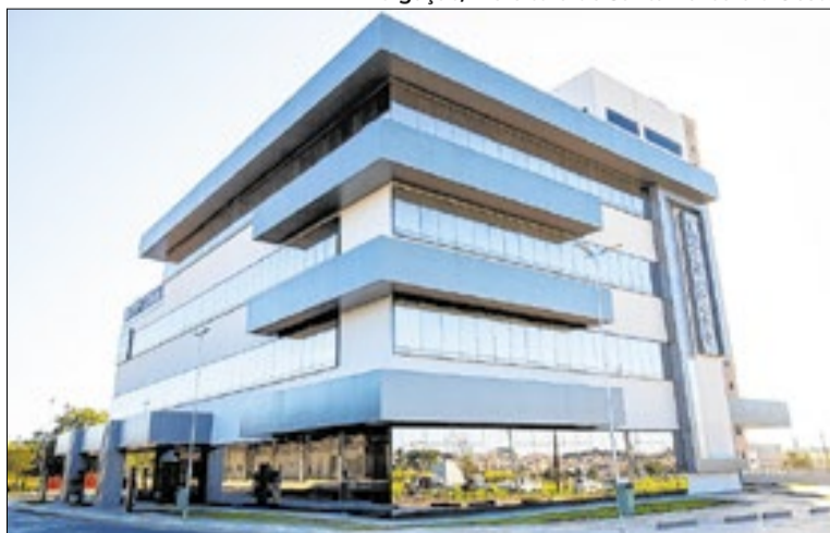
Estrutura recebeu investimento de R$ 25 milhões

A estrutura de 3,6 mil metros quadrados de área construída recebeu investimento de R$ 25 milhões de recursos próprios do município. O prédio possui quatro andares, 28 consultórios ampliados e levou 36 meses para ser construído. O complexo reunirá cerca de 300 trabalhadores e integrará o Centro de Especialidades, Central de Regulação, Vigilância em Saúde e a Farmácia Municipal.