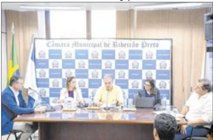
Comissão ouviu representantes do Consórcio Conecta