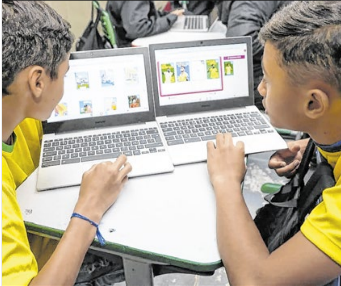
Além do aumento no tempo de leitura, houve mais acessos à plataforma da rede estadual

Nos anos iniciais do Ensino Fundamental, atendidos pela plataforma Elefante Letrado, os indicadores também avançaram. O tempo médio semanal de leitura passou de 33,96 para 37,45 minutos, representando aumento de 10,27%.