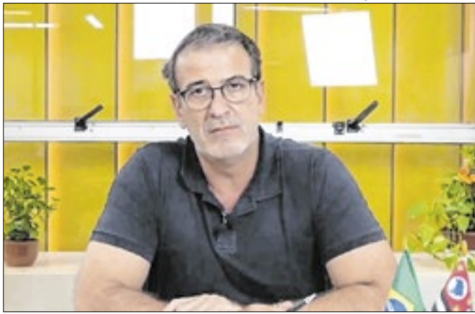
Luciano Almeida foi prefeito entre os anos de 2021 e 2024