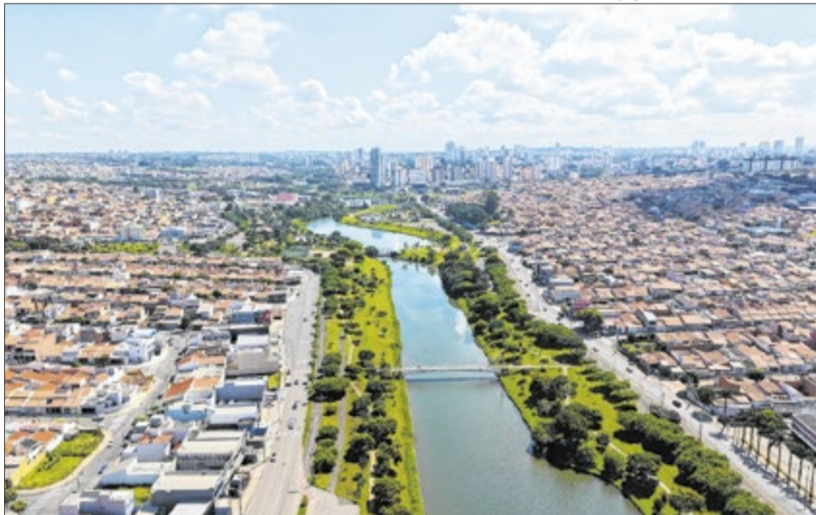
Na RMC, somente dez municípios atingiram o nível de excelência máximo do estudo

Na Região Metropolitana de Campinas, somente dez municípios atingiram a categoria máxima do estudo: Indaiatuba, Águas da Prata, Águas de São Pedro, Cordeirópolis, Hortolândia, Ita-