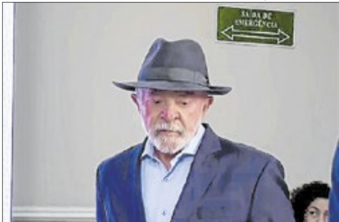
Lula participou de evento em Guarulhos nesta terça(23)