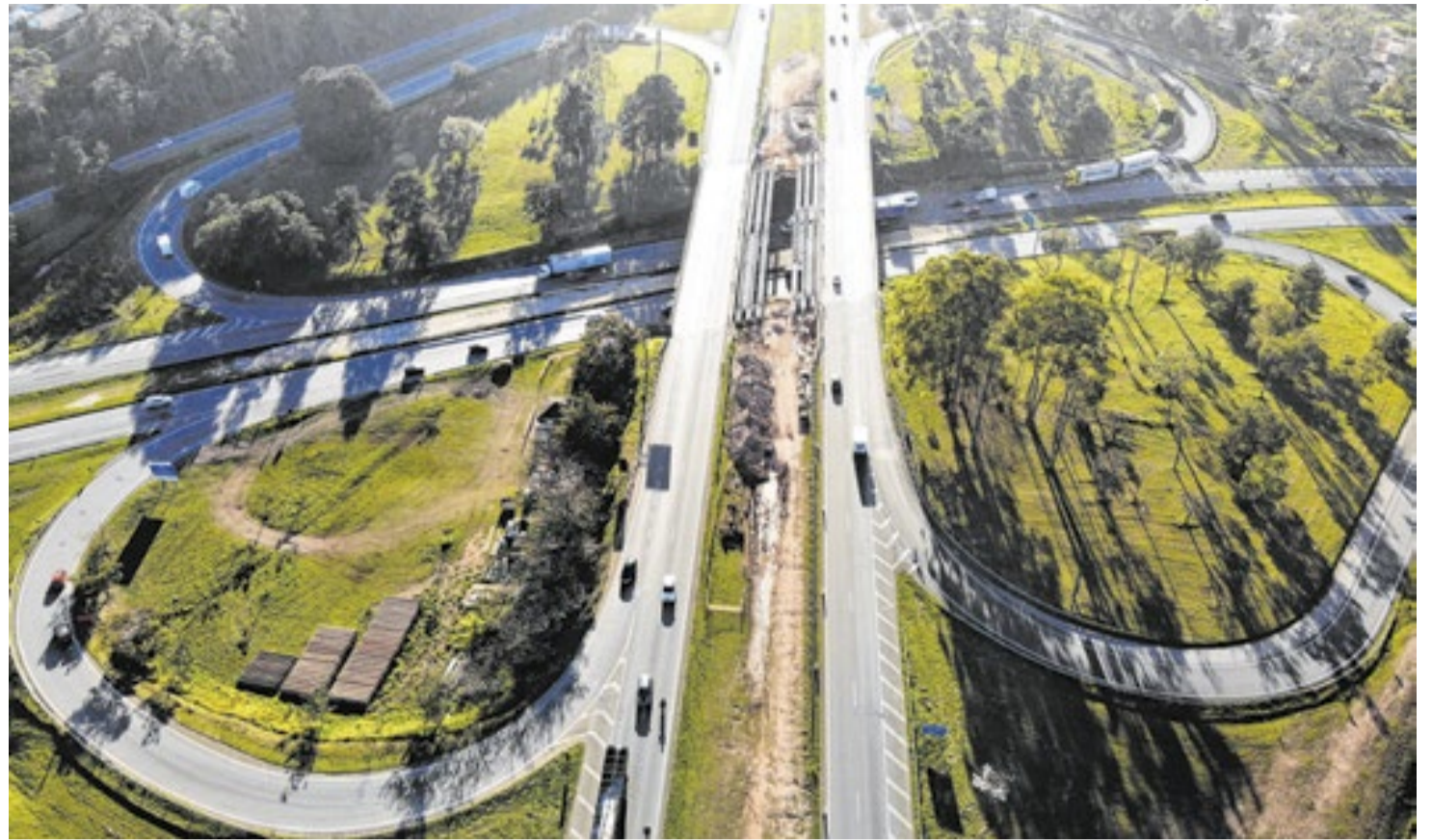
Estado recebeu estudos para implantação do Contorno Norte da Rodovia D. Pedro I

A proposta detalha a construção de um corredor rodoviário de aproximadamente 32 quilômetros. De acordo com as diretrizes preliminares, o traçado teria início na intersecção da Rodovia D. Pedro I com o Anel Viário Magalhães Teixeira (SP-083), nas proximidades do distrito de Sousas, em Campinas. A partir dali, a nova pista seguiria até o entroncamento com a Rodovia Anhanguera (SP-330), prevendo também conexões intermediárias com a Rodovia Professor Zeferino Vaz (SP-332) e com a Rodovia Governador Adhemar Pereira de Barros (SP-340), cruzando territórios geográficos de Cam-