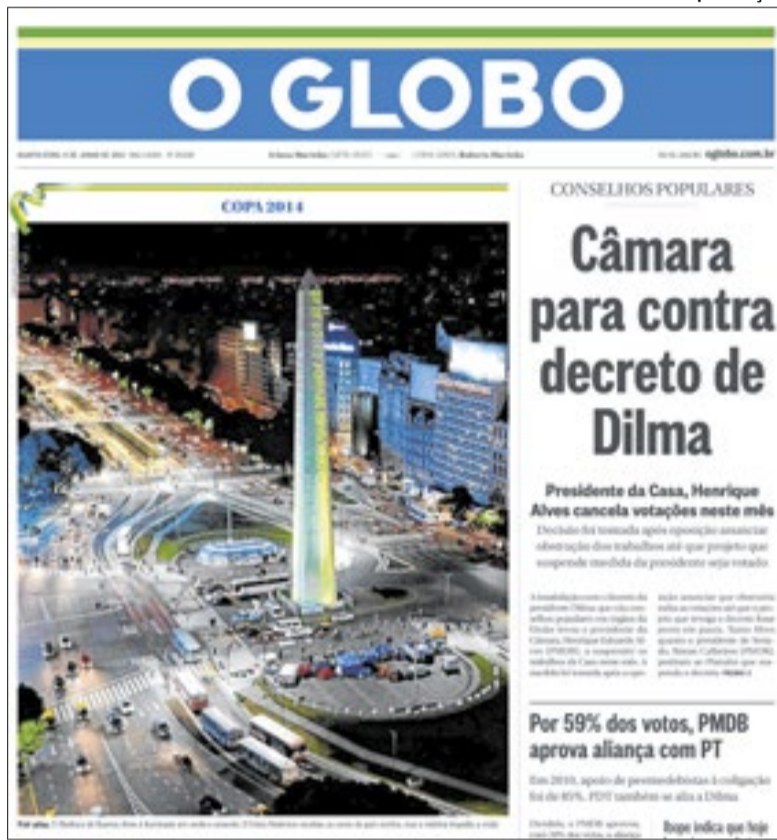
O jornal O Globo immortalizou a ação com uma gigantesca foto na primeira página

■ No último dia 10 junho, completaram-se 12 anos de uma iniciativa do Rio de Janeiro que marcou a relação entre o Brasil e a Argentina. Foi na véspera da abertura da Copa do Mundo de 2014, realizada no Rio. Algo impensável ocorreu naquele dia. O mais importante símbolo da nação argentina ficou duas horas iluminado com as cores verde-amarelo em homenagem ao Brasil. Seria algo semelhante ao Palácio do Planalto ficar duas horas iluminado com as cores da Argentina. Foi um feito que merece ser revivido e uma história que precisa ter os bastidores revelados pela primeira vez na história.