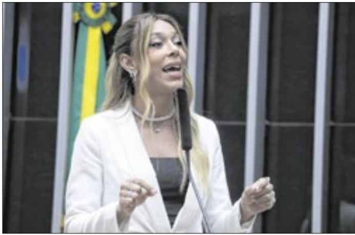
Parlamentar do Psol recorreu ao MP