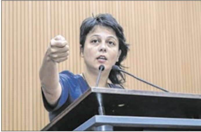
Conti rechaça LDO 2027 durante sessão que a aprovou