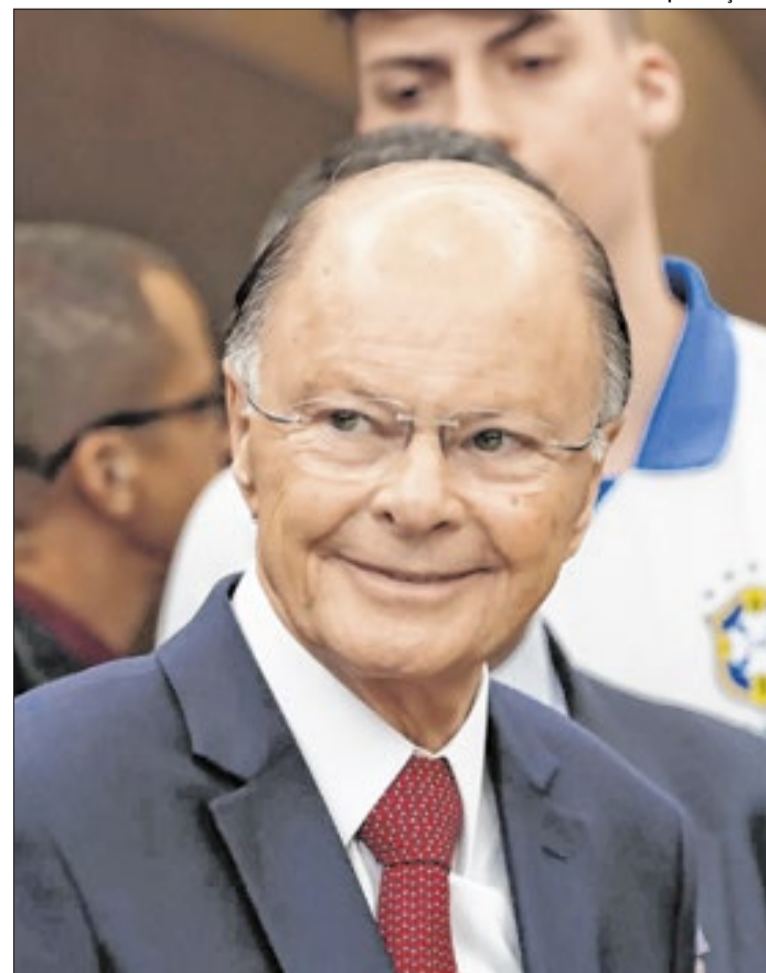
Banco de Edir Macedo comportou-se como o Master

"A instituição reafirma seu compromisso com a transparência, a conformidade regulatória e a plena colaboração com as autoridades competentes", disse a nota.