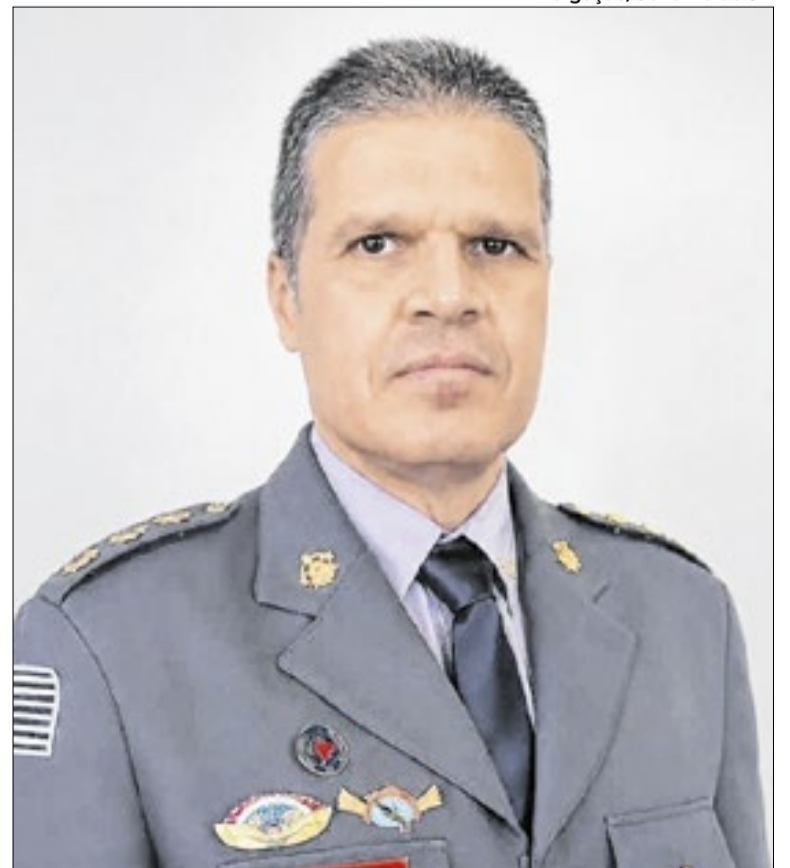
Recém-empossado comandante é natural da capital paulista

A formação acadêmica do novo comandante inclui mestrado e doutorado em Ciências Policiais de Segurança e Ordem Pública pelo Centro de Altos Estudos de Segurança da Polícia Militar do Estado de São Paulo. Também possui especializações em áreas ligadas à atividade de bombeiros, como salvamento terrestre, mergulho autônomo, salvamento em altura e perícia de incêndio. Entre as condecorações recebidas durante a carreira estão a Medalha Valor Militar em Grau Ouro, a Láurea do Mérito Pessoal em 1º Grau e a Medalha do Centenário do Corpo de Bombeiros da Polícia Militar do Estado.