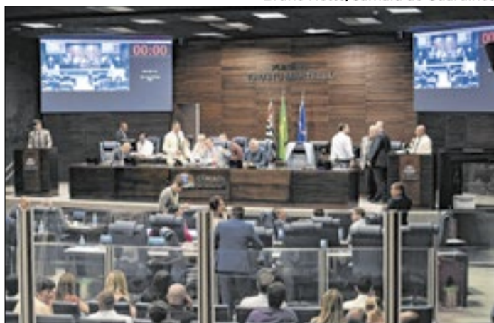
Vereadores durante a Sessão da Câmara de Guarulhos