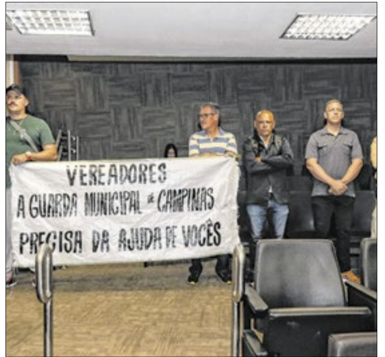
Agentes em manifestação na Casa de Leis campineira

A vacinação representa um pacto social indissociável, onde a proteção individual se estende ao bem-estar comum. Diante da estrutura disponibilizada e de óbitos evitáveis, a negligência torna-se injustificável. A prevenção efetiva exige que cada cidadão faça a parte que lhe cabe.