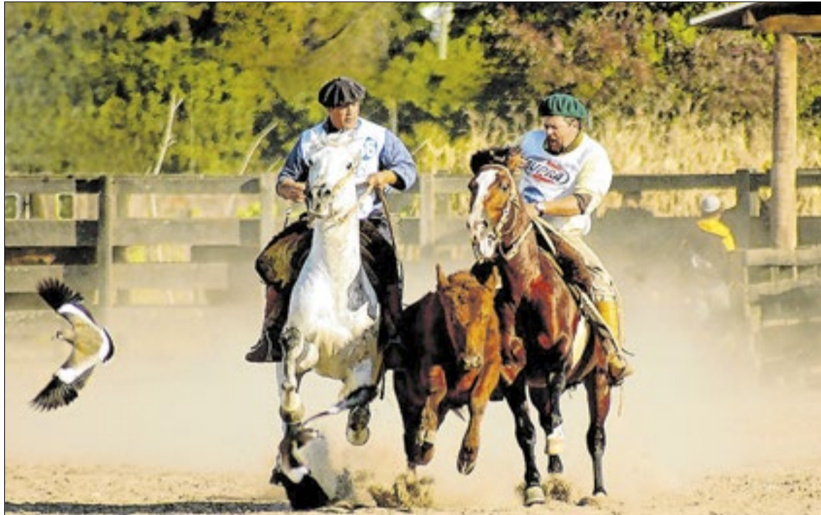
Proposta quer rodeios sem maus-tratos, para especialista não existe rodeio sem crueldade