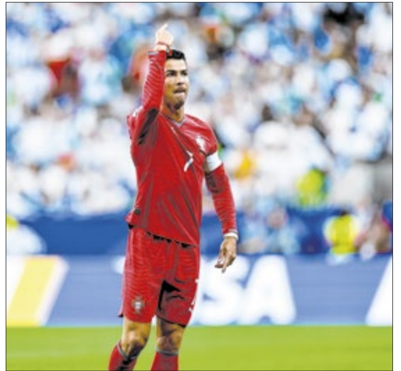
CR7 quebra recordes nesta Copa do Mundo

No último treino contra a Escócia, o Brasil foi à campo com 25 jogadores. Carlo Ancelotti pode ter definido o substituto de Raphinha. Dentre os mais cotados, a tendência é que seja Luiz Henrique. Porém, Rayan, Martinelli, Endrick e Igor Thiago correm por fora. Neymar vai estar no banco de reservas.