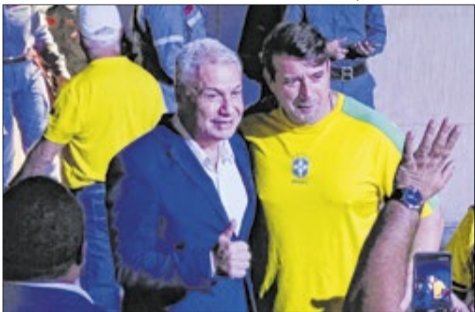
Apresentador deixou a TV para disputar eleições em SP