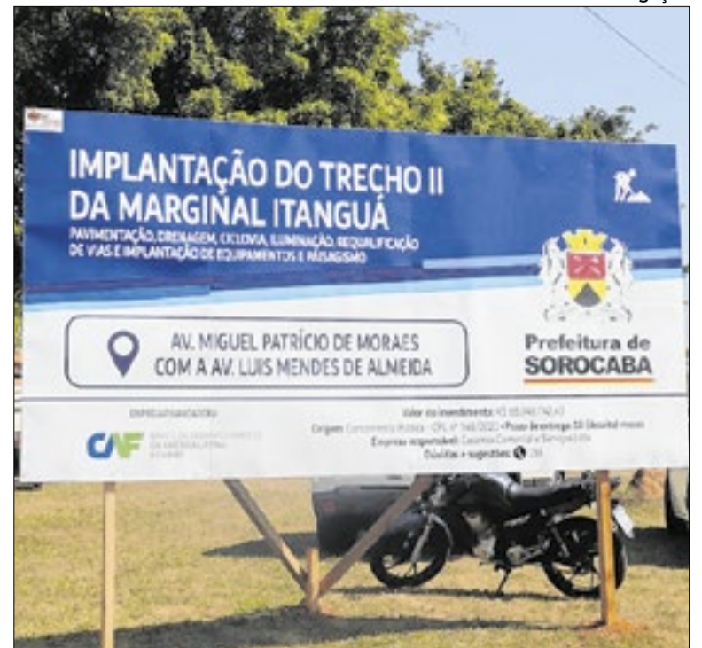
Cobrança consta em ofício assinado pelo gerente da Cetesb

O Conselho Municipal de Política Cultural de Itu realiza reunião nesta quinta-feira (25), às 18h30, no Centro Ituano de Letras e Artes (CILA). Na pauta estão projetos da Secretaria de Cultura, além de debates sobre acessibilidade e inclusão. O encontro foi transferido em razão do jogo da Seleção Brasileira.