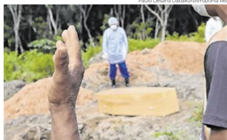
Paulo Desana Dabakuri/Amazônia Real