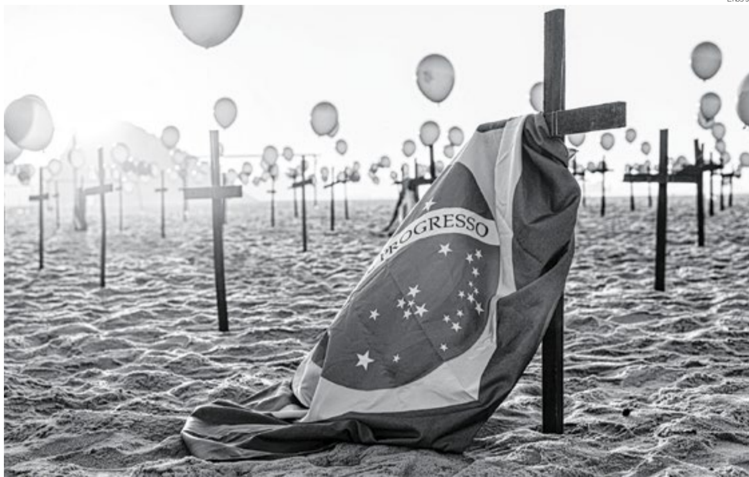
Enquanto o mundo parava, a ciência precisava correr: A exposição dá destaque para o papel da ciência, da pesquisa e da inovação na superação da crise sanitária, ao mesmo tempo em que valoriza a arte como registro e interpretação da realidade

Estão previstas ainda rodas de leitura com a Fundação Biblioteca Nacional nos dias 6 de julho, 3 de agosto e 8 de setembro, abordando registros históricos de crises sanitárias e produções literárias do período. Entre 5 e 9 de agosto, uma mostra de filmes em parceria com o MAM-Rio exibirá documentários, ficções e curtas sobre os impactos sociais e humanos da pandemia, com debates entre realizadores e especialistas.