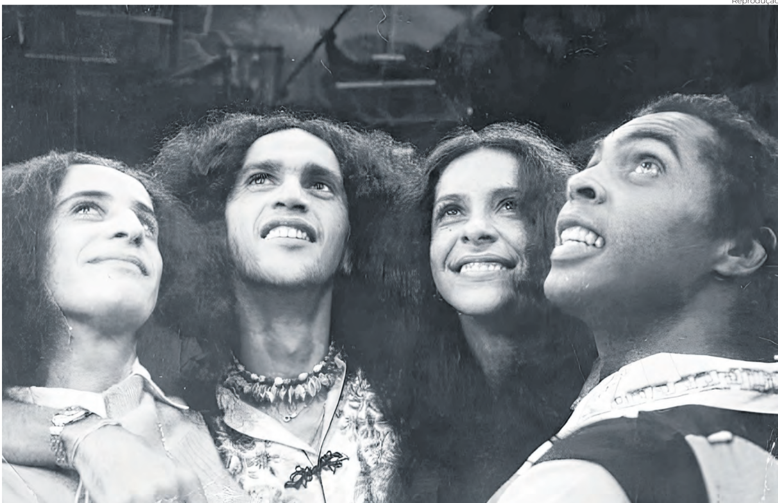
Bethânia, Caetano, Gal e Gil já tinham carreiras consolidadas quando se reuniram no projeto