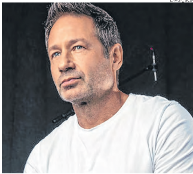
Aos 65 anos, David Duchovny ataca nas mais variadas frentes, do cinema à prosa, passando por shows

Dividido entre uma jornada de shows, o cinema e a escrita de romances, David Duchovny, o Fox Mulder de ‘Arquivo X’, hoje com 65 anos, será homenageado no Festival de Munique