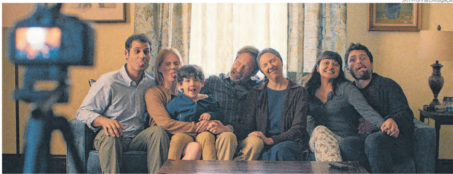
David Duchovny ao centro no elenco de ‘See You When I See You’

Mas a música é apenas uma parte de um percurso cada vez mais amplo. Na literatura, Duchovny consolidou uma obra que transita entre humor, existencialismo e observação social. Depois de romances como “Holy Cow” (editado no Bra-