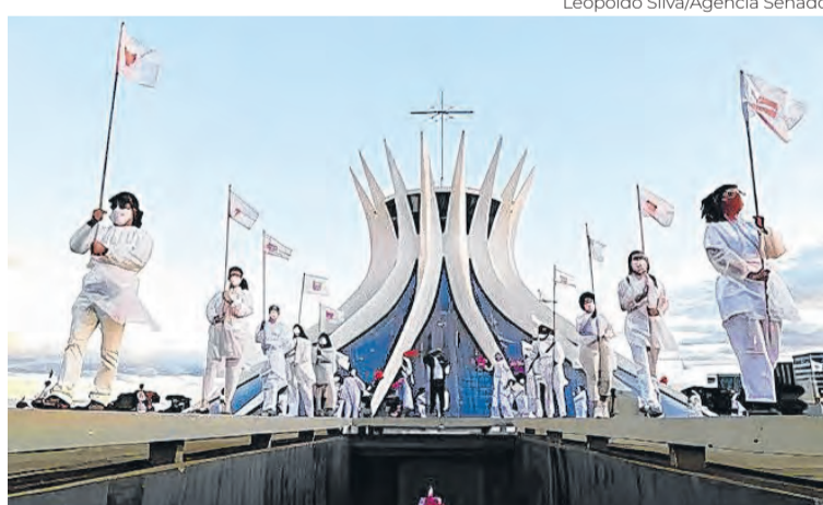
Leopoldo Silva/Agência Senado