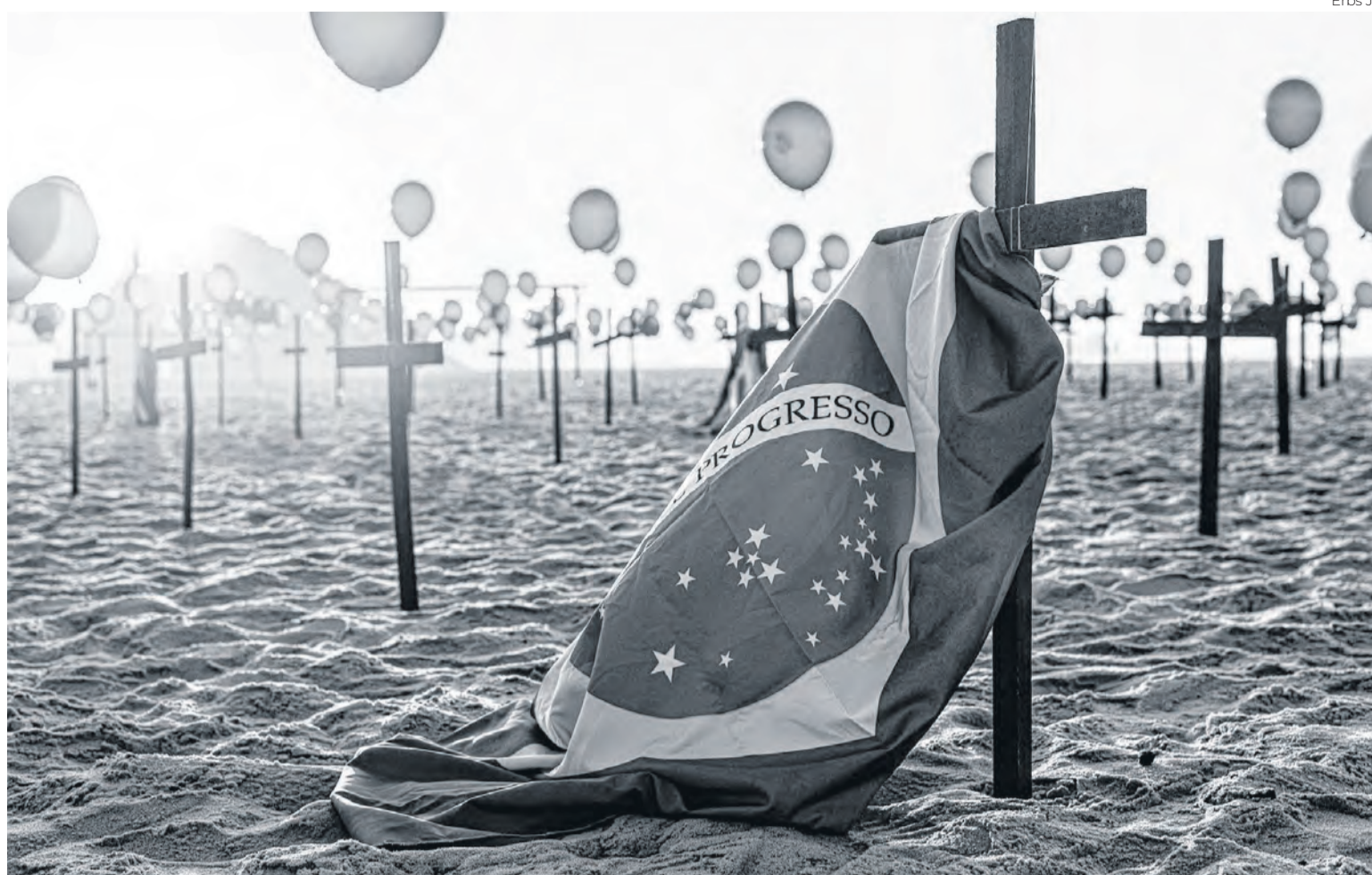
Enquanto o mundo parava, a ciência precisava correr: A exposição dá destaque para o papel da ciência, da pesquisa e da inovação na superação da crise sanitária, ao mesmo tempo em que valoriza a arte como registro e interpretação da realidade

Estão previstas ainda rodas de leitura com a Fundação Biblioteca Nacional nos dias 6 de julho, 3 de agosto e 8 de setembro, abordando registros históricos de crises sanitárias e produções literárias do período. Entre 5 e 9 de agosto, uma mostra de filmes em parceria com o MAM-Rio exibirá documentários, ficções e curtas sobre os impactos sociais e humanos da pandemia, com debates entre realizadores e especialistas.