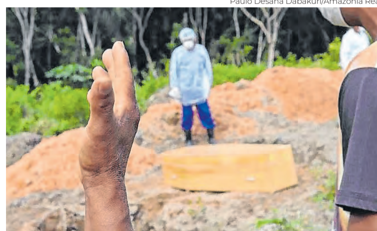
Paulo Desana Dabakuri/Amazônia Real