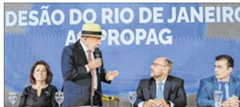
O presidente Lula e o governador em exercício do Rio, Ricardo Couto, se encontraram na assinatura da adesão do Rio ao Propag