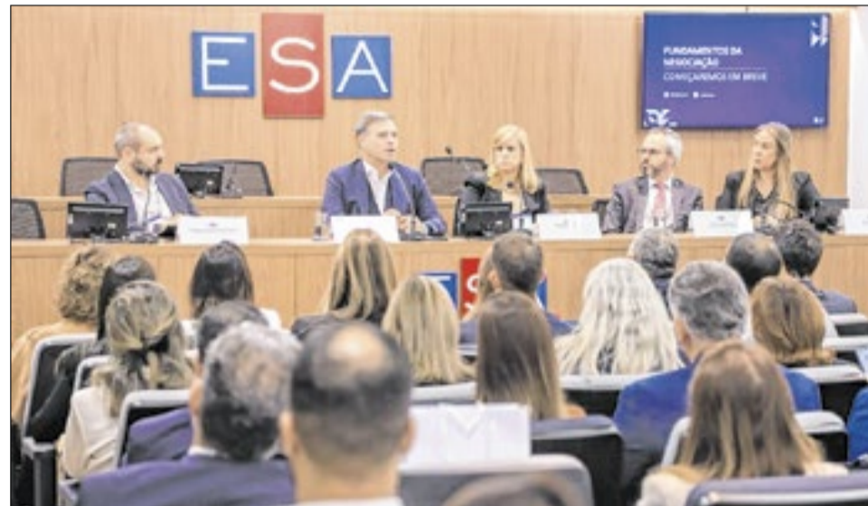
A formação segue até esta terça-feira, na sede da ESA, no Centro do Rio