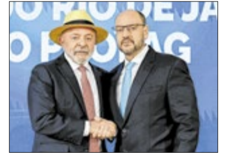
Lula com Ricardo Couto durante a cerimônia realizada nesta segunda-feira