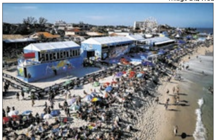
Decisão da etapa acontecerá até o fim da semana