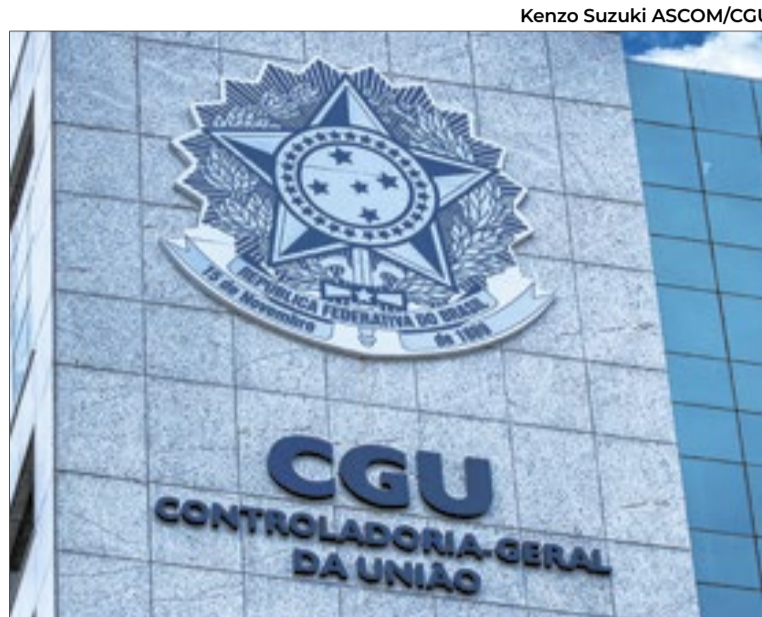
Alerta foi emitido pela Controladoria-Geral da União (CGU)

Na primeira análise, a CGU identificou quatro problemas prin-