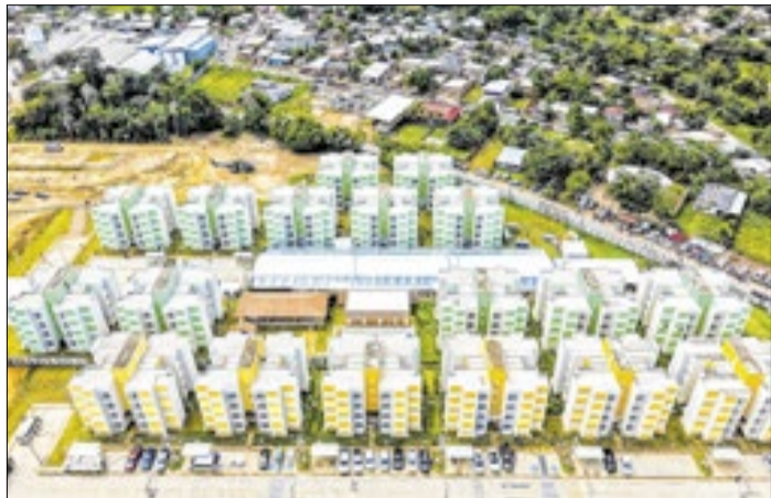
Programa Minha Casa, Minha Vida receberá R$ 20 bi