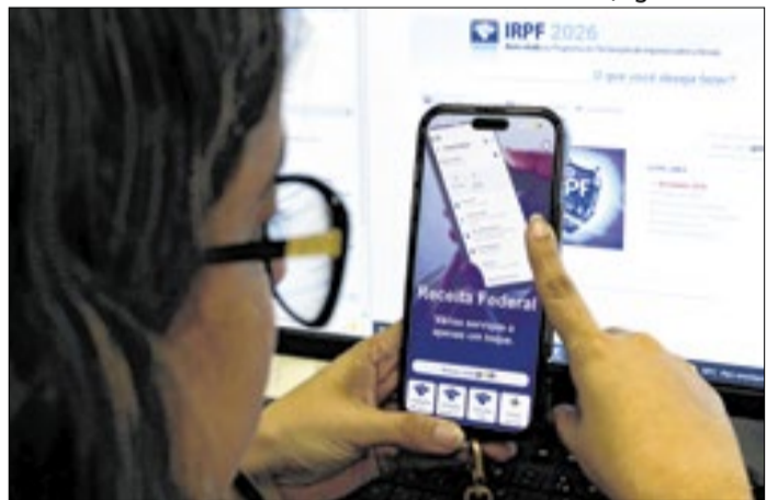
Etapa é a maior da história em número de contribuintes