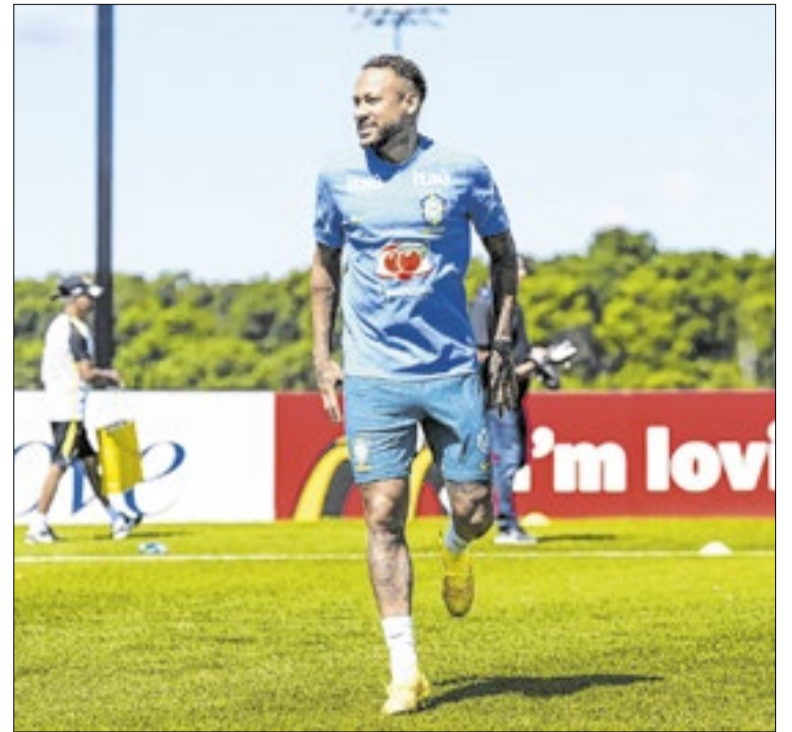
Neymar é opção para o segundo tempo contra Escócia

Há 40 anos, um gol que entrou para a história das copas: o famoso 'la mano de Dios' de Maradona. Argentina e Inglaterra empatavam em 1 a 1, quando Maradona disputou uma bola com o goleiro e meteu a mão para empurrá-la para o gol. Que valeu. A Argentina levou a Copa naquele ano, que fora no México.