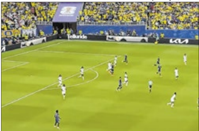
Com a derrota para o Brasil, Haiti deus adeus à Copa