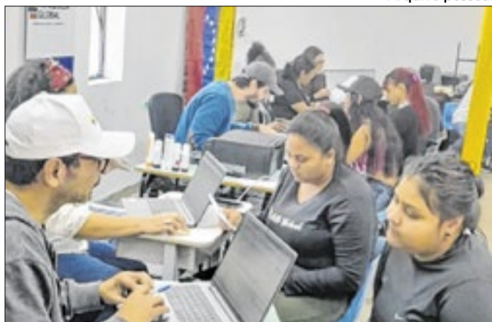
A ONG Venezuelanos Global apoia imigrantes desde 2021