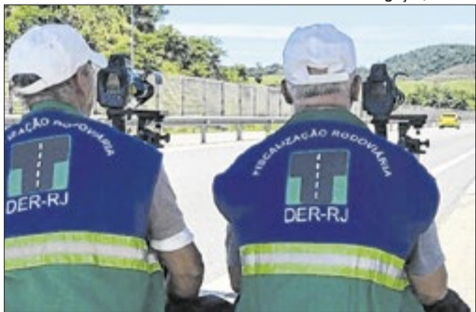
Suspensão afeta a instalação de 390 radares nas rodovias