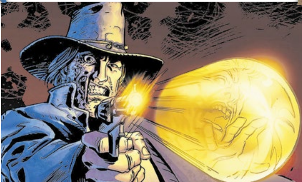
DC Comics almeja repaginar Jonah Hex, para conquistar nova massa leitora

Gênero celebrizado por heróis como Tex, o banguê-banguê ganha sobrevida nos quadrinhos, mundo afora, ao se abrir às lutas identitárias da contemporaneidade e combater o racismo