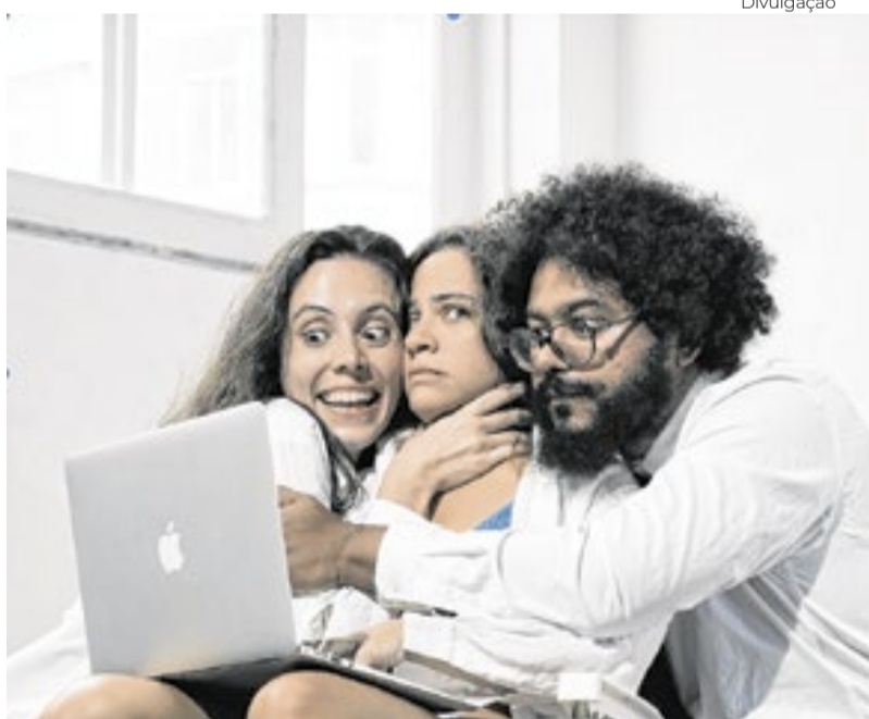
Só Percebo Que Estou Correndo Quando vejo Que Estou Caindo