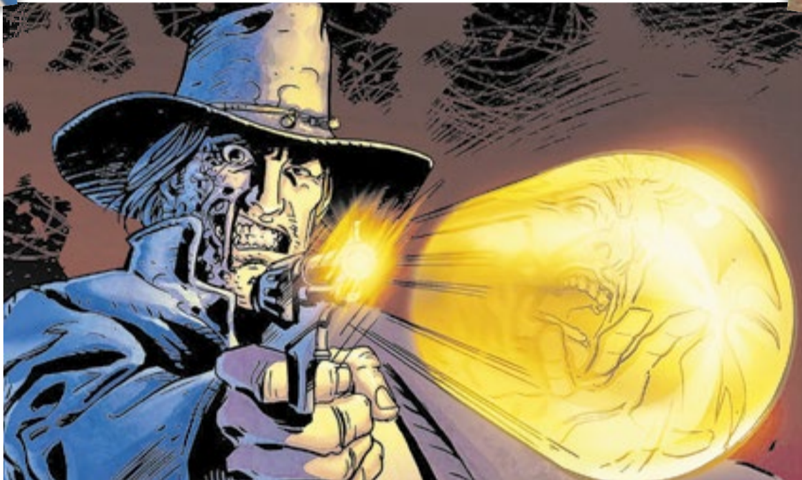
DC Comics almeja repaginar Jonah Hex, para conquistar nova massa leitora

Gênero celebrizado por heróis como Tex, o banguê-banguê ganha sobrevida nos quadrinhos, mundo afora, ao se abrir às lutas identitárias da contemporaneidade e combater o racismo