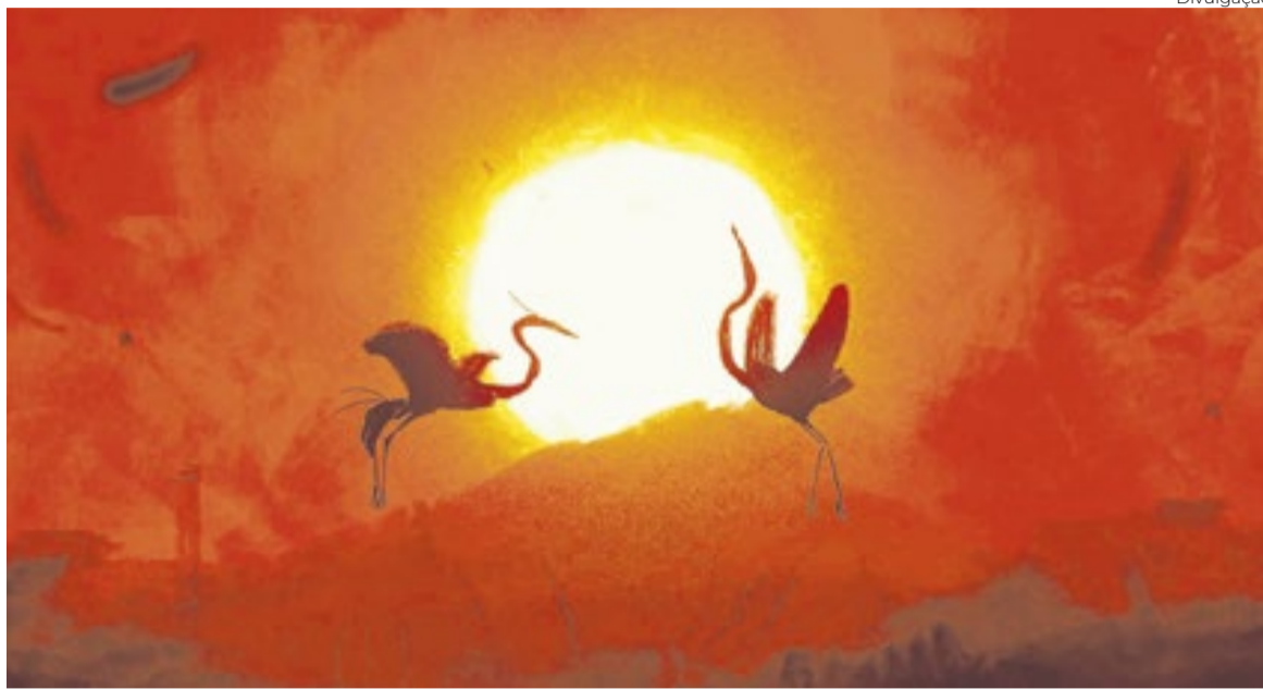
'Lago do Abandono' integra a competição oficial de curtas

Em 2026, quando se espalha de 21 e 27 de junho, Annecy recebe o Brasil nas telas nas principais vitrines de sua programação. Estamos até na mostra competitiva Contrechamp (Contracampo), a segunda mais importante vitrine de longas dessa micareta cinéfila francesa, de-