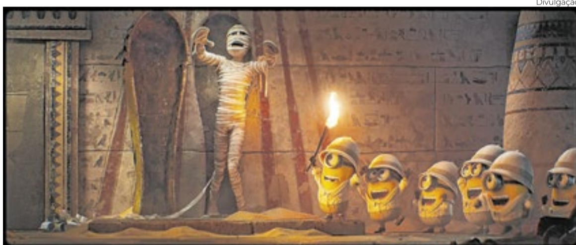
'Minions & Monstros', que estreia aqui em julho, vai abrir o maior festival de animação do mundo