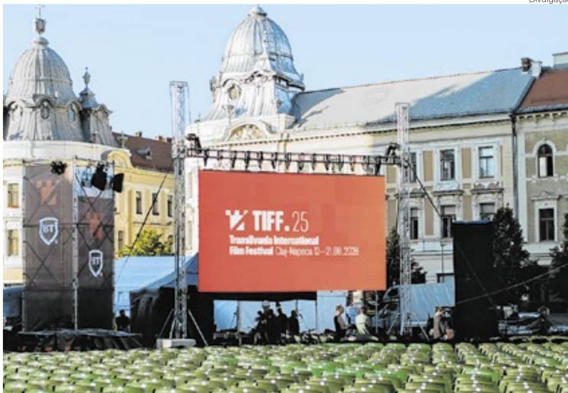
Praça de Cluj-Napoca decorada com os motivos celebrativos do festival

O Brasil não teve vez por lá este ano, mas a América do Sul se destaca na competição central (a lista ao lado) com “Hangar Rojo”, do Chile, que veio consagrado da Berlimale. Dirigido por Juan Pablo Sallato, com base num orçamento de US$ 700 mil e apenas 16 dias para dar conta da tarefa de recriar a América