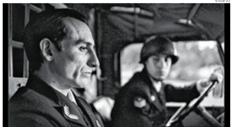
“Hangar Rojo” remonta às origens da ditura no Chile, em 1973, em coprodução com a vizinha Argentina