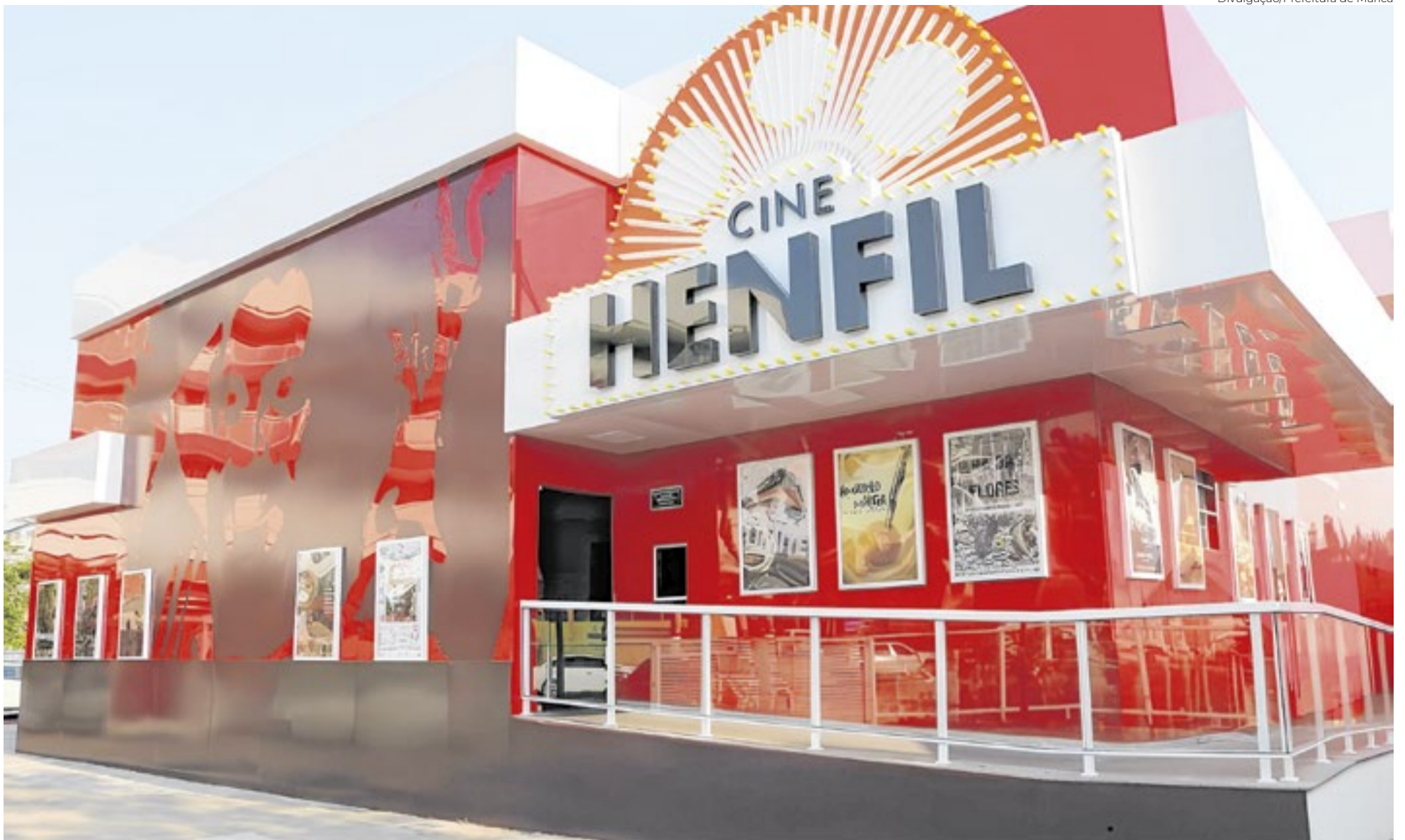
O Cine Henfil, no centro de Maricá, recebe as atividades do festival, uma programação inteiramente gratuita