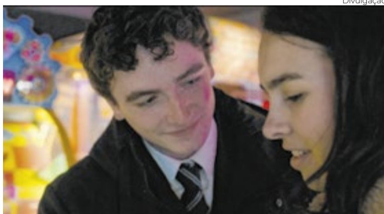
“Truly Naked”, de Muriel d’Ansembourg, é parte da retrospectiva dos Países Baixos na maratona romena